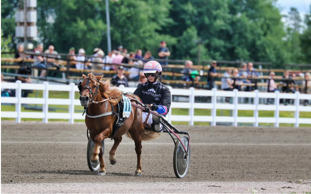
Kuva Anu Leppänen