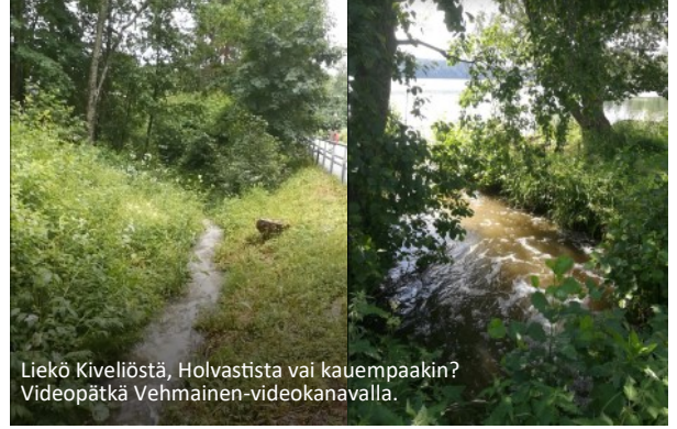
Liekö Kiveliöstä, Holvastista vai kauempaakin? Videopätkä Vehmainen-videokanavalla.