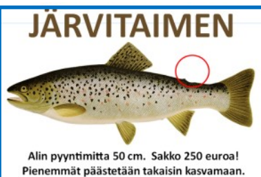
Alin pyyntimitta 50 cm. Sakko 250 euroa! Pienemmät päästetään takaisin kasvamaan.

Järvitaimenen kasvu on nopeaa, onhan niillä luomua gurmee-ruokaa yllin kyllin. Sana kiihii jo yli kaksikiloisesta yksilöstä. Koska järvenissä on hyvin ruokaa, kalat pulskistuvat nopeasti. Eräs liuttulainen pilkkijä kertoi juuri, että yksilöiden välillä voi olla suuriakin koko eroja.