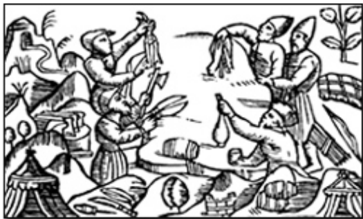
Olaus Magnus 1555