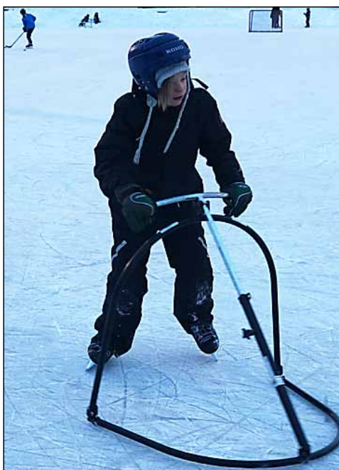
Säädettävä luistelutuki auttaa isompaakin luistelijaa pysymään pystyssä.