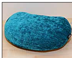
Taikofon on äänituntumasoitin, joka yhdistää äänen ja tuntoaistin.