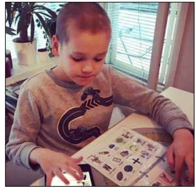
Puhekupla-kerhossa harjoittelee kommunikaatiotaitoja.

Jaatisen toiminnan tarkoituksena on edistää vammaisten lasten ja nuorten sekä heidän perheidensä oikeuksien toteutumista ja mahdollisuutta elää täyttä elämää. Jaatinen tekee vaikuttamistyötä yhdenvertaisen osallistumisen mahdollistamiseksi vammaisille lapsille ja nuorille. Haluamme vaikuttaa myös muun muassa palvelu-