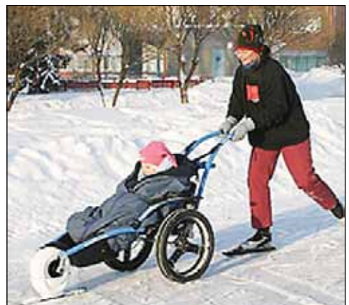
Hippocampe-maastopyörätuoli toimii myös talvisissa olosuhteissa.