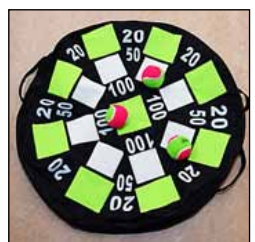
Vuokraamme muun muassa painopeittoja ja soveltavia pelejä.