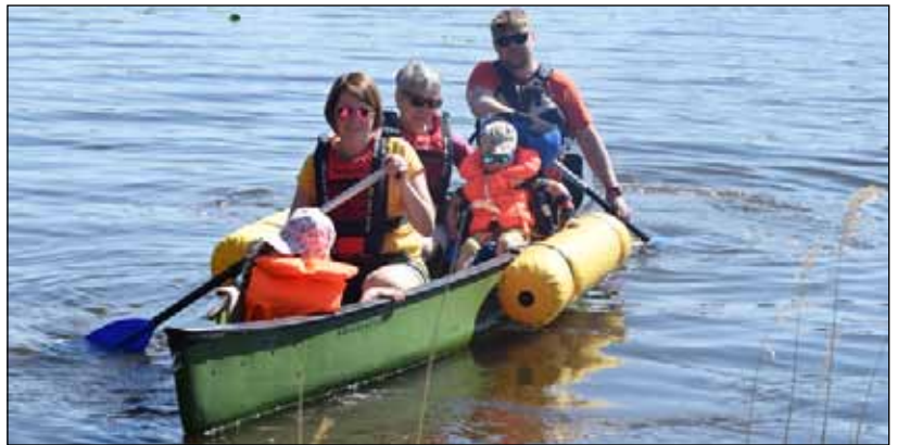
Harrastus- ja toimintavälinevuokraamo toimii yhteistyössä Malikkeen kanssa.