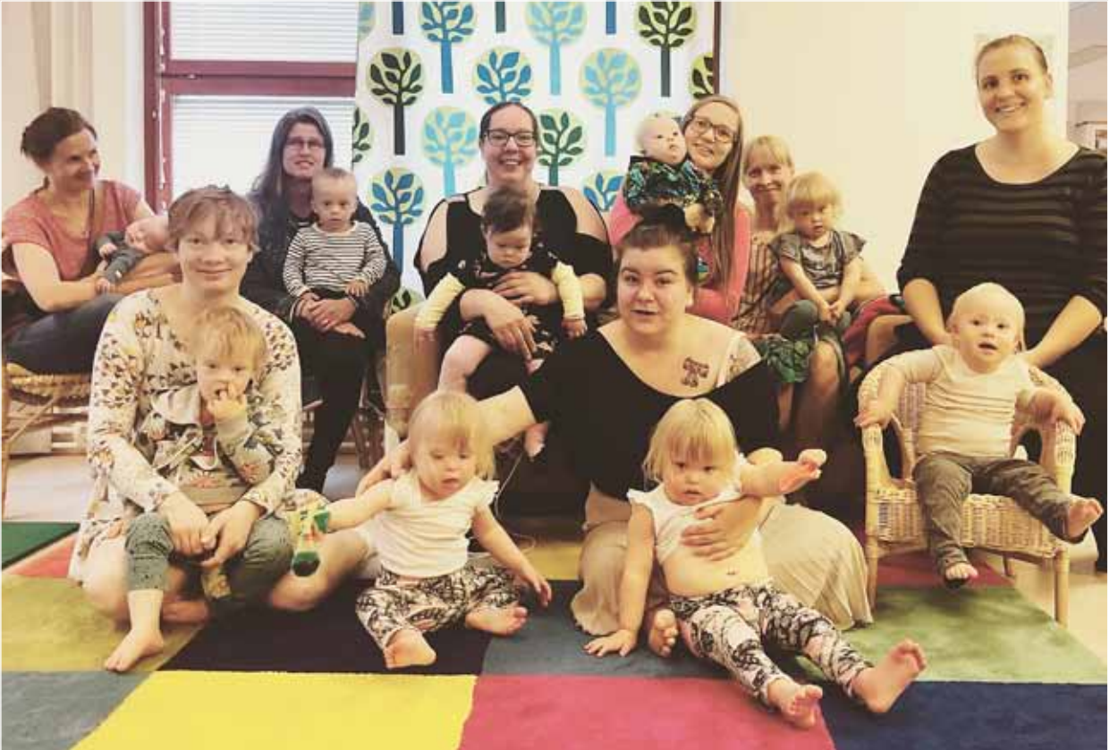
Ihanat pienet Down-lapset äiteineen Jaatisen Majalla elokuussa 2019.

Ota yhteyttä sähköpostitse akseli@jaatinen.info tai puhelimitse 09 477 1002 ja katsotaan yhdessä kalentereita!