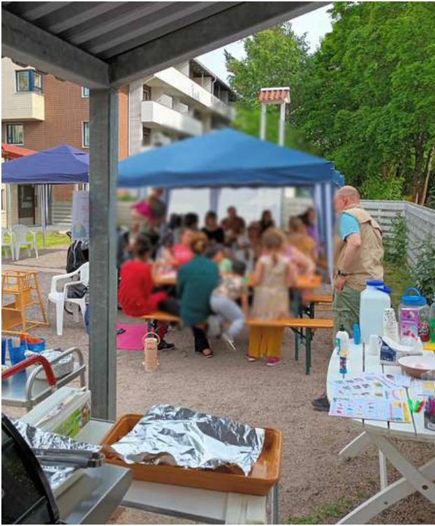
Pihajuhlissa leikittiin ja grillattiin