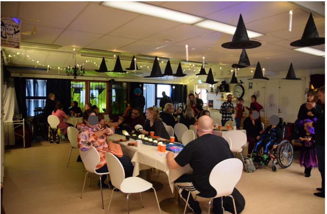
Halloween-juhlissa riitti hulinaa