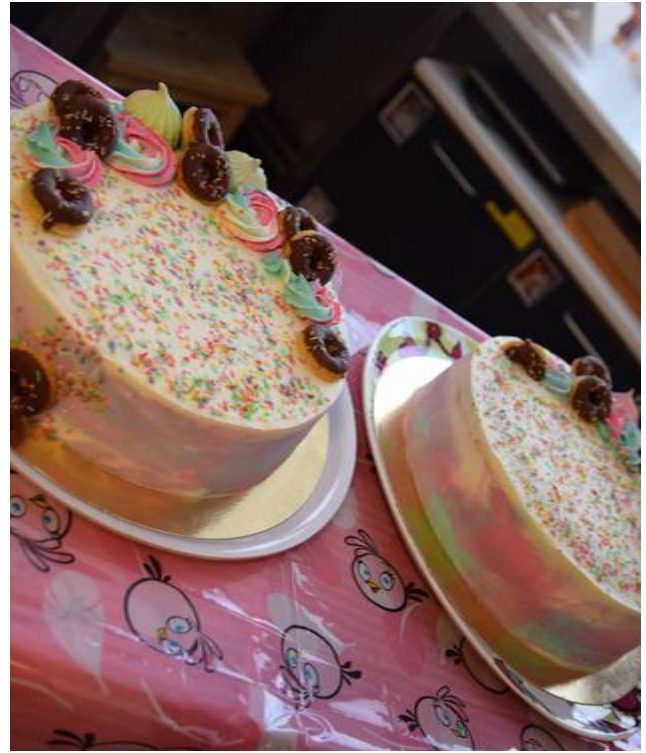
Kaikkien lasten synttäreillä oli herkulliset kakut