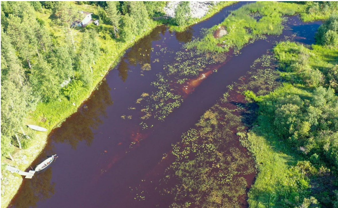
Kuva 2. Varvinkarin alue ennen ja toimenpiteiden jälkeen.