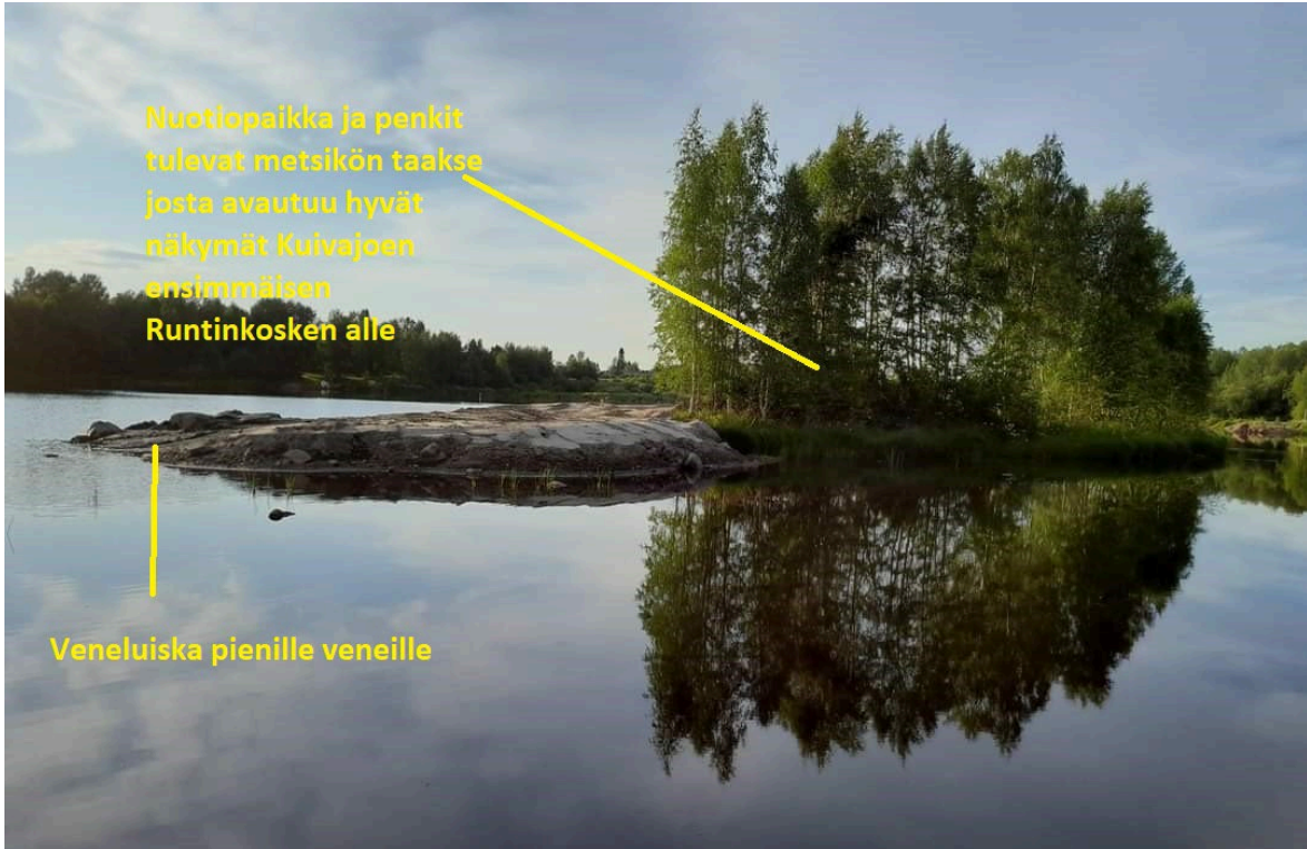
Kuva 5. Vuolunkari kuvattuna Kuivajoen eteläpuolen rannalta .