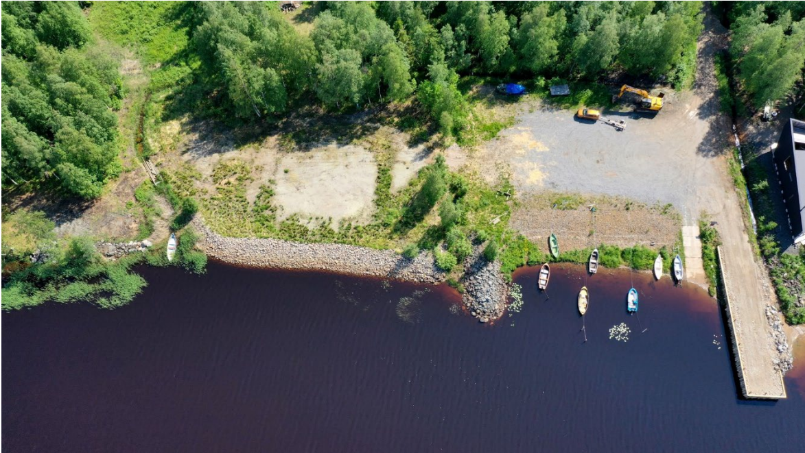
Kuva 3. Kaikkolanrannan aallonmurtaja kunnostuksen jälkeen (kuvan oikeassa laidassa)

Kaikkolanrannan toimivuutta ja turvallisuutta parannettiin kunnostamalla vanha aallonmurtaja siten, että tehtiin pystypoolat käyttäen hyväksi vanhoja sähköpylväitä, jotka saatiin lahjoituksena Rantakaira Oy:ltä, kuva 3. Myös aallonmurtajan sivuilta ruopattiin massoja pois, jotta rantautuminen isommallakin veneellä on nyt mahdollista. Aallonmurtajaa voidaan käyttää nykyisin kalastukseen ja veneiden väliaikaiseen täyttämiseen ja tyhjentämiseen tavaroista. Kuvassa oikealla on uusittu aallonmurtaja ja keskellä vielä kunnostamaton vanhanaikainen aallonmurtaja.