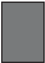
1/1 sivu 210 x 275 mm

Huom! Reunoihin meneviin ilmoitukseen: + 5 mm:n leikkuuvara.