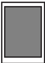
1/1 sivu kehysilmoitus 180 x 240 mm

Huom! Reunoihin meneviin ilmoitukseen: + 5 mm:n leikkuuvara.