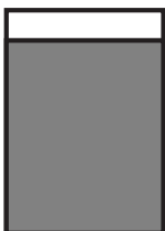
Takakansi 210 x 245 mm

Huom! Reunoihin meneviin ilmoitukseen: + 5 mm:n leikkuuvara.