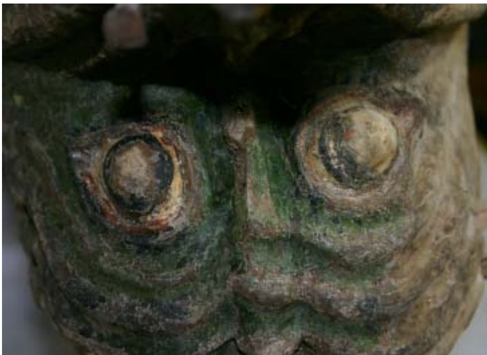
Kuva 2. T:mi Taidekonservaattori Jaana Pauluksen konservoima lohikäärme-puuveistos, konservoinnin jälkeen..