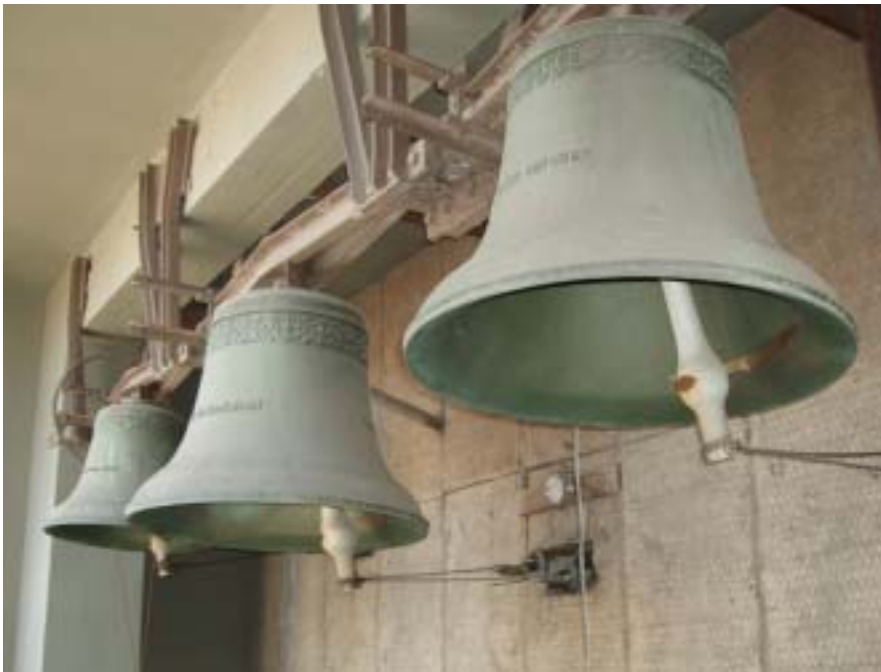
Kuva 1. Opinnäytetyöni yhteistyötahona toimineen Alppilan seurakunnan kirkon kellot. Alppilan kirkon kellot on valanut Veljekset Frils Oy Kokkolassa. Kellojen sävelet ovat A, B ja Cis. Kelloihin on valettu teksti: "Kunnia olkoon Jumalalle korkeuksissa; Kaikki maa kumartakoon sinua; Herra antaa sanoman".

Keskeiseksi jatkotutkimusaiheeksi havaittiin kirkkorakennusten irtaimen kulttuuriperinnön pelastussuunnittelukysymykset. Irtaimen kulttuuriperinnön varastoinnin, säilyttämisen ja hallinnoinnin kehittämisellä kirkkorakennuksissa voidaan ratkaisevasti parantaa myös irtaimen kulttuuriperinnön säilyvyyttä ja evakuoitavuutta onnettomuustilanteissa. Kirkkorakennusten evakuointiprosessien jatkokehittäminen vaurioiden minimoimiseksi edellyttää laajempaa jatkotutkimusta.