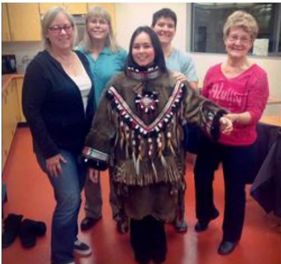
Alutiig Museumien nettisivuilla Suomessa käynyt nahkaompeluryhmä juhlii Etholénin kokoelman esineen VK135 mallin mukaan syntyynyttä karibunnahkavaatetta.

Tarvittiin usean konservattorin työ ennen kuin paidat olivat matkakunnossa. Silti paitojen kunnostus, pakkaus ja kuljetus eivät lopulta olleetkaan suurin haaste konservattoreille. Kävi ilmi, että paidoista kolme oli ns. ihmishiuksin koristettua seremoniallista soturinpaitaa, jota intiaanit pitävät pyhinä. Niisitapeille paidat edustivat kotiin palaavia esi-isiä, jotka pitäisi ot-