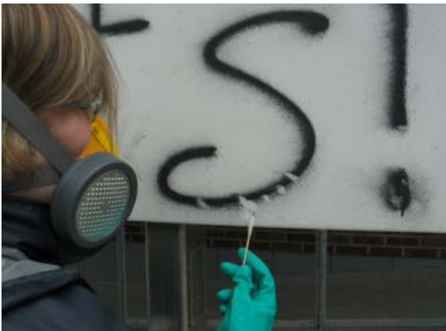
Kuva 4. Veikko Törmäsen Ruutuvihko (2002) teoksen töhrynpöistotestit 2005.

Muita artikkeleja on listattu paikkaan: http://paivik.typepad.com/