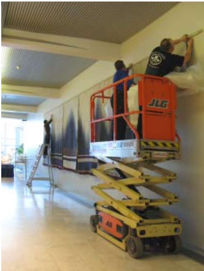
Kuva 1. Marjatta Metsovaaran Revontuli (1984) teoksen puhdistus ja konservointi toteutettiin ostopalveluna 2007. Kuva: Marjatta Metsovaara..

Sekä modernin että nykytaiteen dokumentoinnin ja materiaalidatan tutkiminen ja merkitysten kartoittaminen on tullut osaksi konservointia ja res-taurointia. Suomalainen veistostaide koetaan edelleen vahvasti modernismin perinteen mukaisesti painottaen teki-jyyttä ja taiteilijan yksilöllisyyttä sekä intenti-ota. Viime vuosikymmeninä veistostaide julkisena monumenttina on laajentunut mm. murtaen erilaisia materiaalisia ja teknisiä raja-aitoja, muuntuen paikoin ylläpidettävän tapahtuman kaltaiseksi, esimerkiksi valo-ohjelman sisältäväksi kohteeksi.