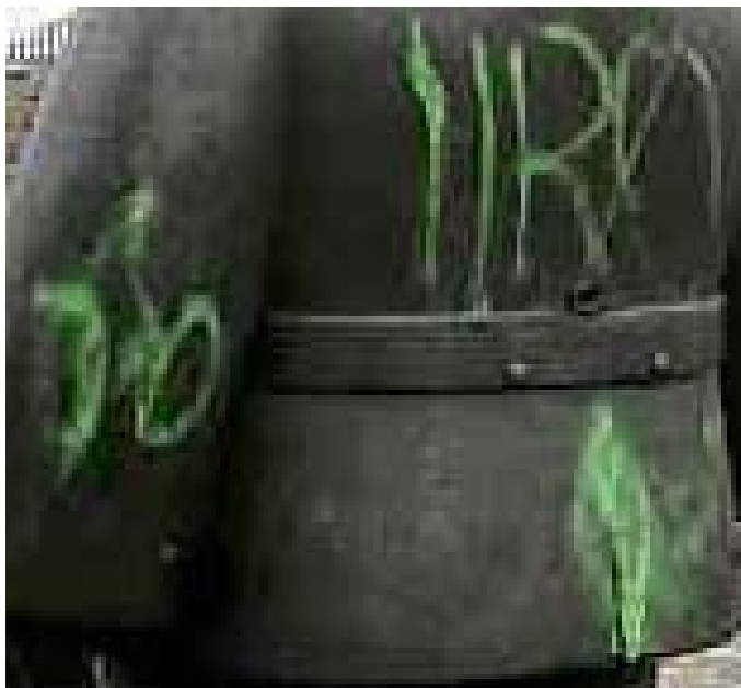
Kuva 1. Töhritty Toripolliisi.

Konservaattoriliiton lehti pyysi tutkija-konservaattori Päivi Kyllönen-Kunnakselta aiheeseen liittyvää artikkelia, jossa Kyllönen-Kunnas esittelee Oulun taidemuseon veistoshuoltoa.