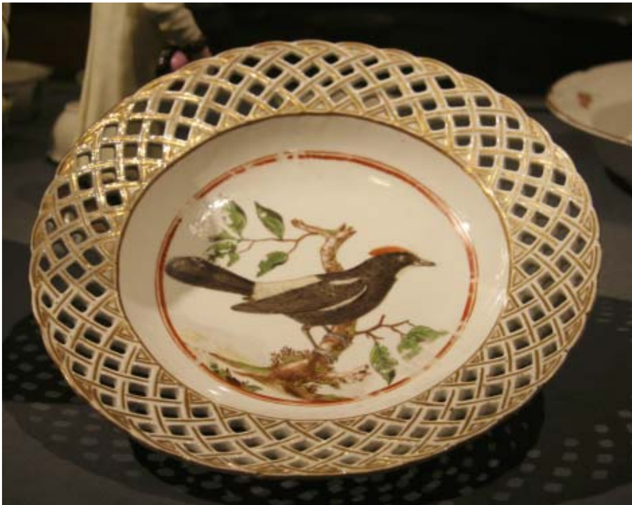
Kuva 1: Jälkiruokalautanen keisarinna Elisabetin astiastosta. Keisarillinen Posliinitehdas, Pietari 1765-69. Collection Vera Saarela. Esillä Lumoava posliini näyttelyssä.

Lumoava posliini- näyttely on esillä kansallismuseon kellarikerroksen vaihtelevien näyttelyiden tilassa 19.4.2009 saakka. Näyttely on toteutettu Vera Saarelan säätiön ja Suomen kansallismuseon yhteistyönä. Näyttelyssä on esillä mm. keisarillisen posliinitehtaan sekä Gardnerin tuotantoa.