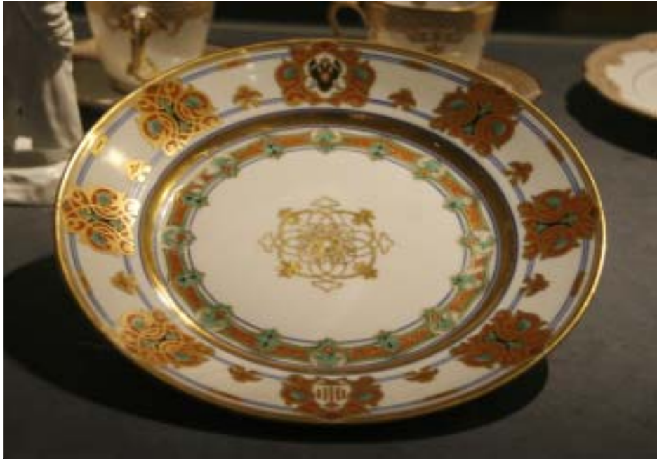
Kuva 2: Lautanen Konstantin Nikolajevite´sin astiasosta. Keisarillinen Posliinitehdas, Pietari 1848. Cay Sundströmin kokoelma. Esillä Lumoava posliini näyttelyssä.