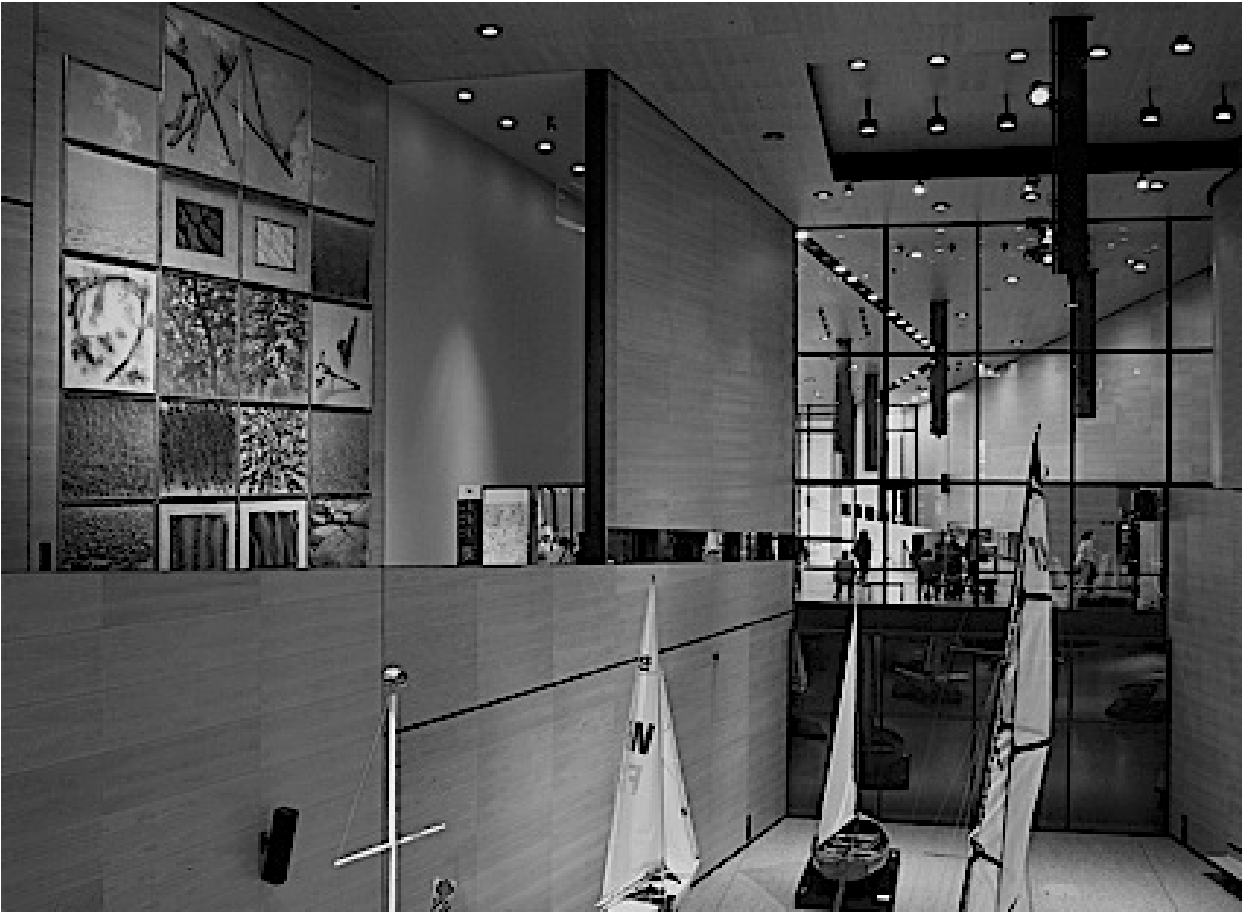
Kuva 2: Suomen Merimuseon ja Kymenlaakson museon yhteinen korkea näyttelytila.

Arkkitehtuurikilpailussa haettiin Suomen merimuseon ja Kymenlaakson museon kotipesänä toimivaa rakennusta, jolla olisi kaupunkikuvassa selkeä rooli. Tilauksessa oli siis maakunnallista, kansallista ja kansainvälistä merkitystä omaava rakennus, joka olisi osaltaan muokkaamassa Kotkan ja Kaakonkulman ilmettä.