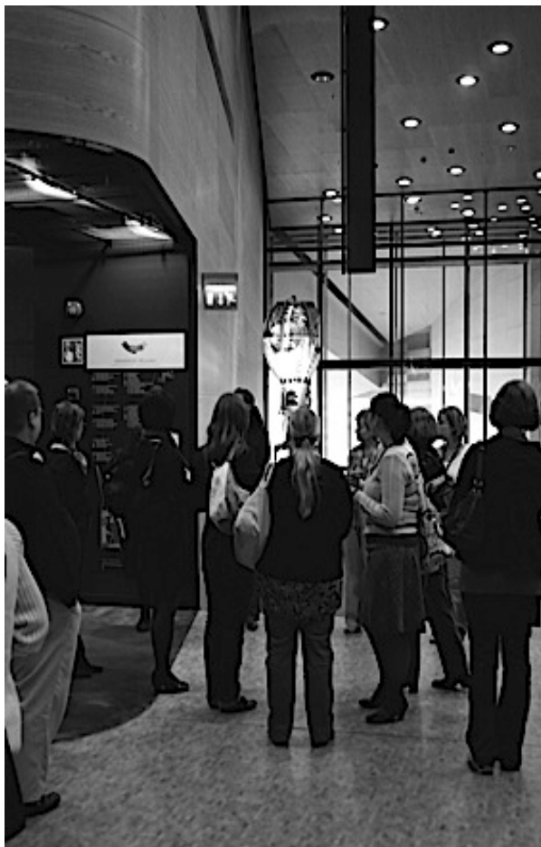
Kuva 1: Merikeskus Vellamon sisääntuloaula.

Ulkohahmo kuin valtava aalto, julkisivut kuin kimaltava merenpinta. Viisaat ovat todenneet, että arkkitehtuuri on rakennettua mielentilaa. Arkkitehtuuri luo puitteet ja herättää tunteita. Merikeskus Vellamon arkkitehtuurin perimmäisenä ajatuksena on ollut luoda paikka, jossa merelliselle ja kymenlaaksolaiselle ilmapiirille annetaan tilaa olla ja vaikuttaa.