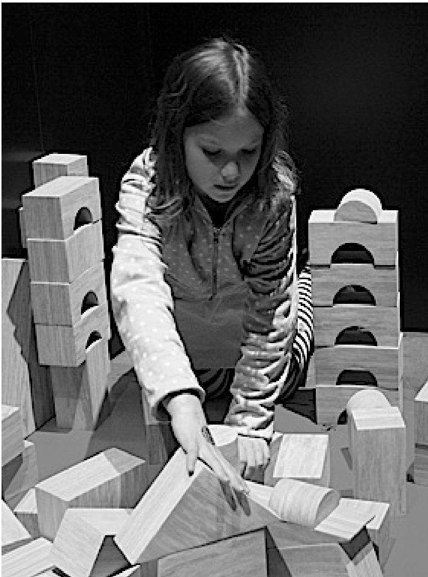
Kuva 3. Suomen Merimuseon leikkipaikka houkuttelevine rakennuspalikoineen.

Rakennuksen teknisen esittelyn jälkeen jäsenistö sai vapaasti tutustua Suomen merimuseon ja Kymenlaakson museon näyttelyihin. Jokaiselle varmasti löytyi jotakin ja ehkäpä jopa enemmänkin: oma kierrokseni eteni pienen koululaisen mielenkiinnon mukaan. Parhaat pisteet sai vedenvaraan joutuneen veneilijän pelastuspeli museokeskuksen korkeassa venehallissa. Pienen harjoittelun jälkeen...lapsikin sen hallitsi!