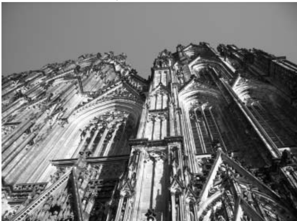
Kuva 1. Kölnin katedraali.

Konferenssi pidettiin 5.- 6. lokakuuta 2007 Kölnin Fachhochschulen tiloissa. Osanottajia oli satakunta, opettajat mukaan luettuna. Vaikka suurin osa osallistujista ja luennoitsijoista olivat saksankielisistä maista, yhteisenä kielenä konferenssissa käytettiin englantia. Esitelmät olivat mielenkiintoisia ja hyvin toteutettuja, mutta erityisesti mieleen jäivät omaa suuntautumisalaamme koskevat aiheet rauskun nahan käytöstä huonekaluissa sekä Marcel Breuerin suunnitteleman tuolin “ti3d” tutkimus ja konservointi .