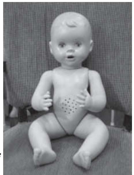
Kuva 2. Nukke valmiina.