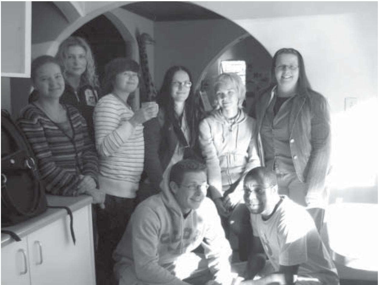
Kuva 1. Evtékin opiskelijat ystävineen.

Kolmannen vuoden EVTEK Muotoiluinstituutin opiskelijaryhmä lähetettiin maaliskuussa 2007 kolmeksi kuukaudeksi työharjoitteluun Namibiaan. Tutkimusryhmään kuului kuusi opiskelijaa kolmelta eri suuntautumislinalta: tekstiili-, huonekalu- ja esinekonservoinnista. (kuva 1) Lisäksi mukana olivat näiden linjojen lehtorit, jotka olivat Namibiassa vuorotellen valvomassa yhteistyön kulkua. Oppilaitoksemme ja Namibian Kansallismuseon välille on tehty monivuotinen yhteistyösopimus, jonka seikkailunhaluisia koekaniineja olimme. Työskentelimme useissa eri kohteissa: Namibian Kansallismuseossa (National Museum of Namibia) Windhoekissa, pienessä Nakambale-museossa Namibian pohjoisosassa, Swakopmundin museossa rannikolla sekä Rehobothin museossa. Tarkoituksena oli tutustua kulttuurillisiin olosuhteisiin paikassa, jossa konservoinnin pohjimmaisat periaatteet ovat vasta nousemassa ajankohtaisen keskustelun aiheeksi.