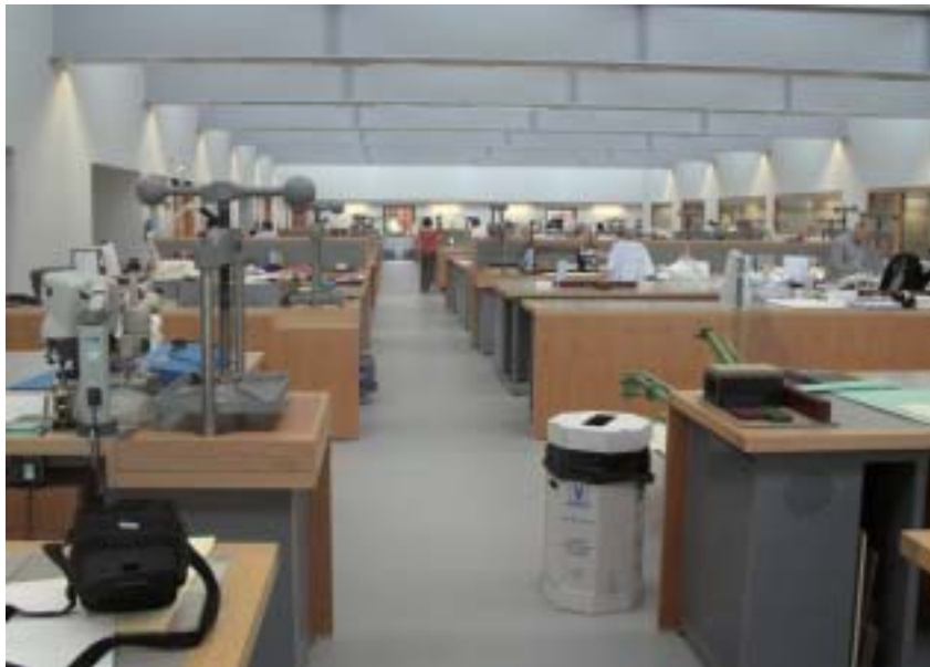
Kuva 1. The British libraryn uusi konservointikeskus.