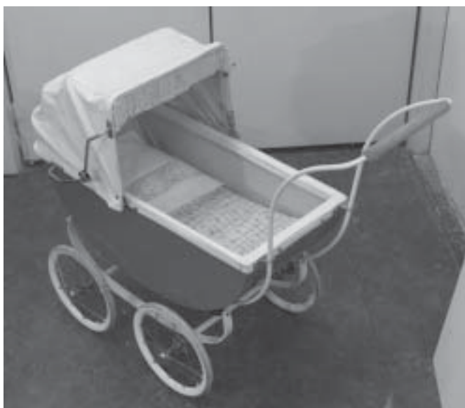
Kuva 4. Nukenvaunut korjauksen jälkeen.