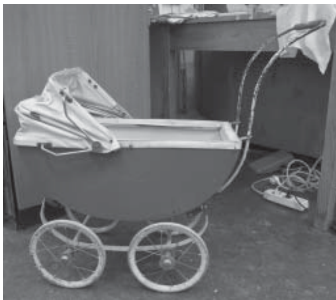
Kuva 3. Nukenvaunut ennen konservointia.

Kirjoitin kuvissa 3 ja 4 näkyvien vaunujen kunnostuksesta Benitan Nukke ja Nalle-lehteen artikkelin "Nukenvaunut kuntoon: konservoiden, entisöiden vai korjaten." Tässä artikkelissa yritin selvittää tavalliselle kaduntallaajalle mitä konservointi on ja perustella syitä miksi konservointi kannattaa. Konservoinnin ilosanomaa on siis saatu levitettyä taas hieman eteenpäin. Menikö se sitten perille, sitä en tiedä.