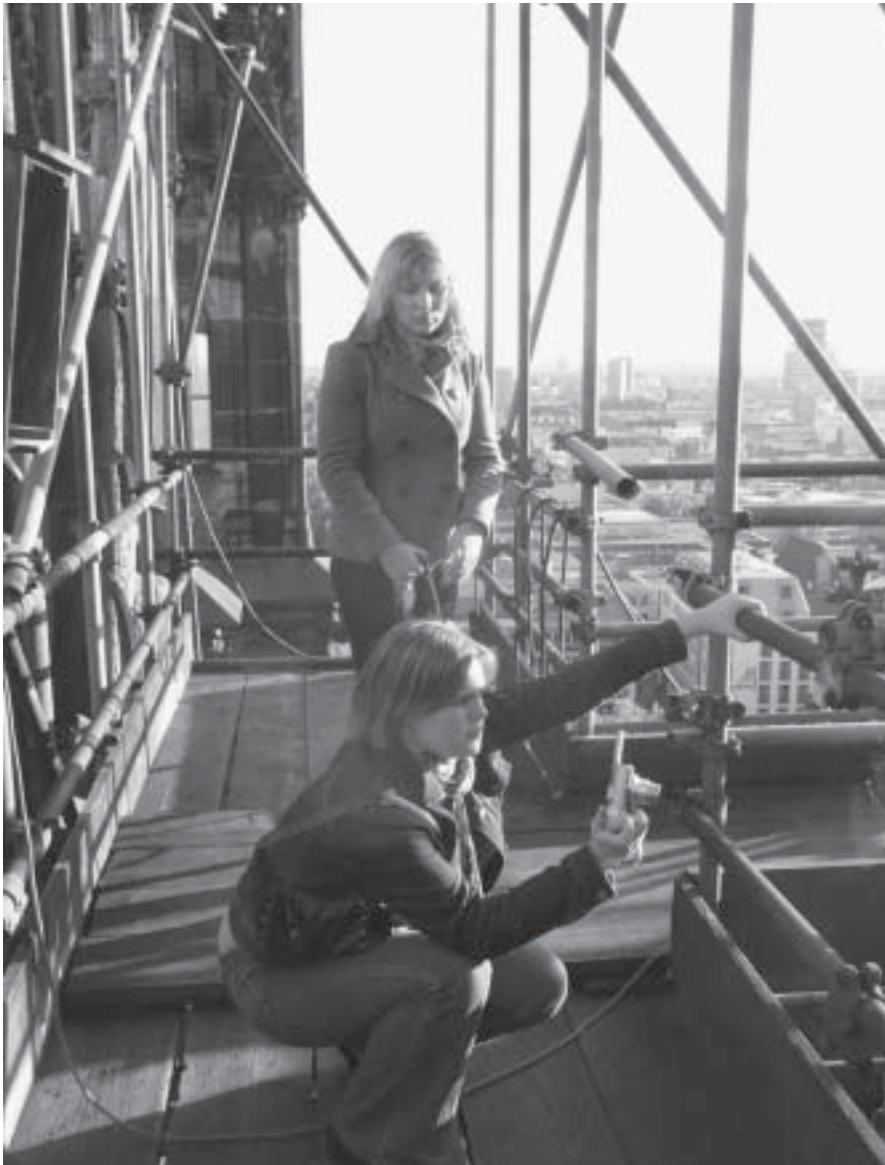
Kuva 2. Rakennuskonservaattoreiden työmaalla..

Konferenssin esitelmien lisäksi meillä oli mahdollisuus tutustua mahtipontiseen Kölnin katedraaliin (kuva 1) sekä osallistua ohjattuun kaupunkierrokseen. Pääsimme katedraalin korkeuksiin seuraamaan rakennuskonservaattoreiden jalan jälkiä sekä nauttimaan kirkon tornista avautuvasta mielettömän upeasta näköalasta Kölnin kaupungin yli (kuva 2).