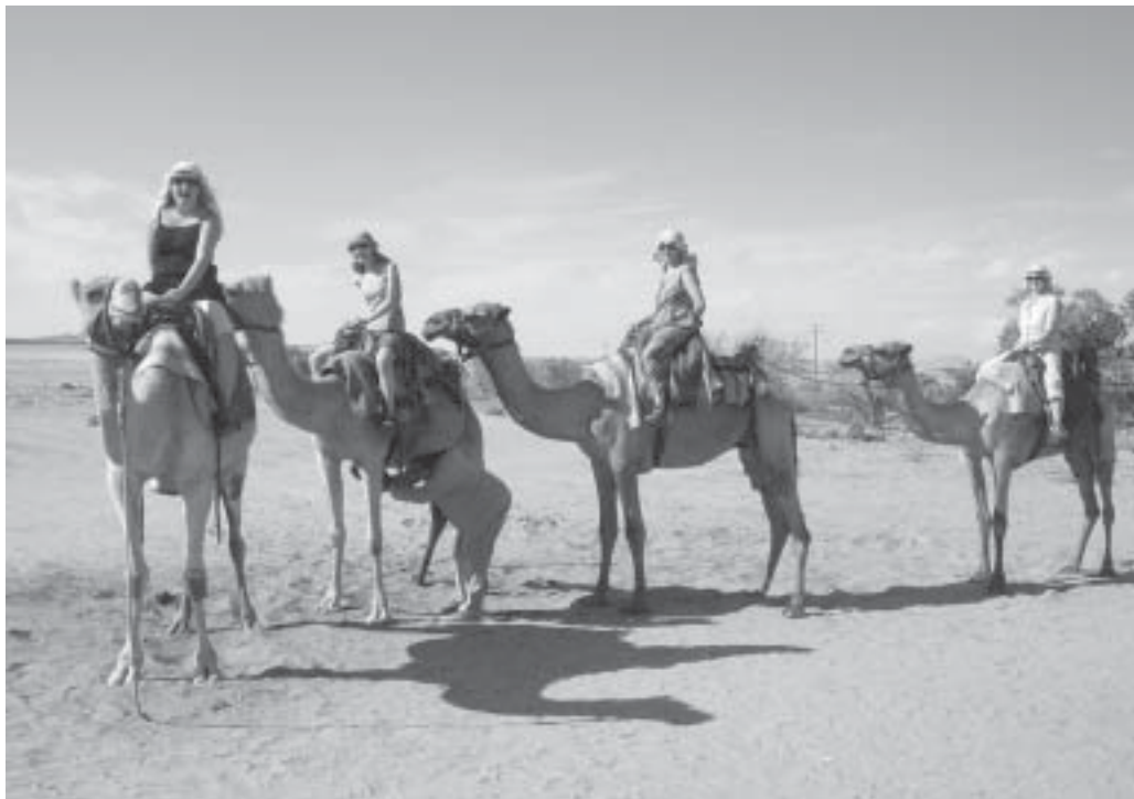
Kuva 3. Kamelin selässä.

Kulttuuriero Suomen ja Namibian välillä vaikutti työskentelyilmapiiriin niin hyvässä kuin pahassakin. Erilaiseen kulttuuriin tutustuminen muistutti meitä siitä, miten itselleen tuttuja asioita täytyy olla valmis käsittelemään täysin uudelta näkökannalta. Työn lisäksi saimme kokea myös paljon muuta mielenkiintoista. Ratsastimme kamelilla kuumalla aavikolla nomadien tapaan, metsästimme rukoilijasirkkoja kylpyhuoneen katosta kirkumisen säästyksellä, maistelimme paikallisia perinneruokia, näimme monenlaisia eläimiä norsuista leijonaan, kahlailimme kylmässä Atlantissa ja keräsimme taskut (ja matkalaukun) täyteen kauniita kiviä ja simpukoita, ihastelimme ikivanhoja luolamaalauksia ja kävimme katsomassa maailman suurinta hyljeyhdyskuntaa. Vain muutamia mainitaksemme. Tällaisen jäljen jätti meidän Afrikkamme!