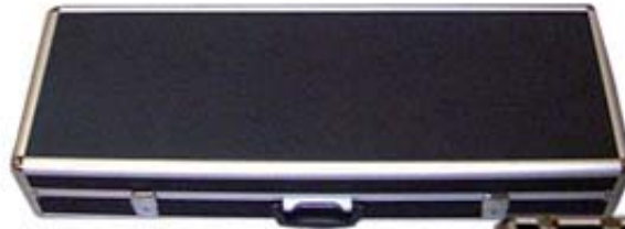
Brite Site taljahylly