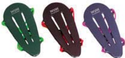
Win & Win alumiini-epoksirannesuoja