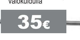
Cartel Scope valokuidulla

suosittu Brite Site Tuner Rest on hyvin virittyvä hylly, jolla ampuu moni ammattilainenkin