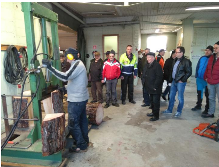
Demonstration av spånspjälkning