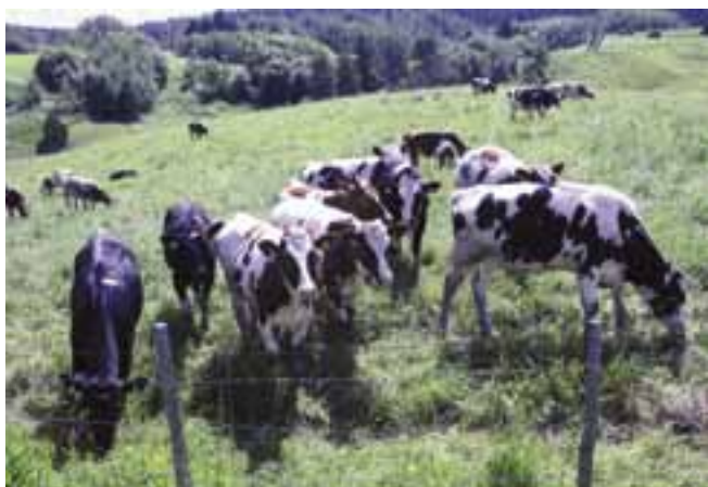
Häntälän notkot on jälleen otettu laidunmaaksi.

Häntälän notkot ja niissä laidunnetut lehmät olivat elinehtomme. Nyt notkot ovat matkailunähtävyyksiä, mutta edelleenkin karjan laitumia. Luontopolkua pitkin pääsee ihailemaan notkomaisemia. Polku kulkee Kaunelan laitumien kautta Murrunkulmalle, missä hehkuvat keväisin keltaiset kullerot, ja sieltä Häntälän kylän lävitse takaisin entiseen alakouluun, joka nyt toimii Kyläkeskukseksi. Näin muuttuu maailma. Notkojen viljelyä on kuitenkin hauska muistella, kun seurailee tämän päivän tehokasta maataloutta.