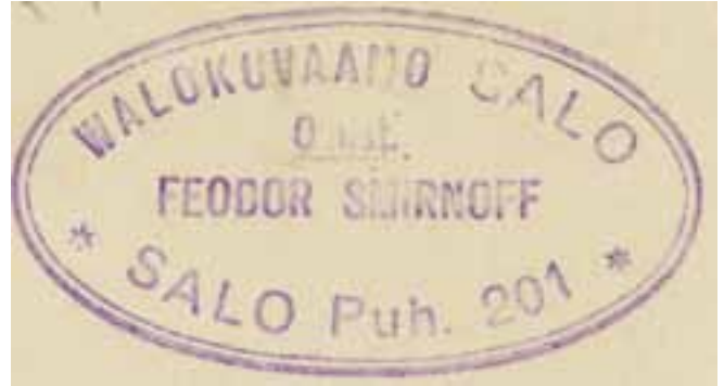
Smirmoffin valokuvaamon leima 1930-luvulta.

Hangon vankileiristä on lähetetty Someron taloihin vankeja. Ei ole selvinnyt, saivatko talolliset valita haluamansa vangit vai määräisivätkö vankileirin viranomaiset, kuka lähtee ja minne lähtee. Tämä olisi mielenkiintoista tietää. Toisten tietojen mukaan vankien saamiseen isäntien piti tehdä anomus, joka käsiteltiin. Tämä tuntuu luonnolliselta, siltä vankien työstä piti kuukausittain maksaa työvoimapäällikölle: jos maksaa, kai saa päättää monestako vangista maksaa. Isännät saivat tietää etukä-