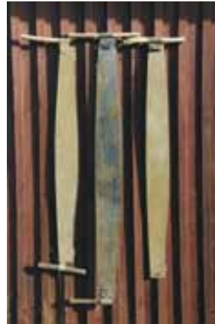
Kaksi justeeria ja jääsaha.