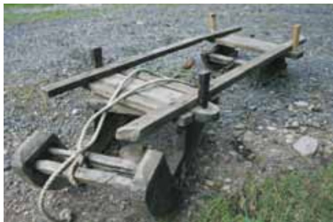
Pienet Koiviston Reinon tekemät tukkireet.

Istuessani aitan portailla omissa ajatuksissani tajuan miten mielenkiintoisen ajanjakson maaseudun elämässä olen päässyt näkemään: oma-varaistalouden ajan. Jäljellä ovat vain esineet. Niiden käyttötarkoitus ja merkitys on jo nykynuorisolle tuntematon. Olen tyytyväinen siitä, että olen onnistunut säilyttämään edes pienen osan tuon ajan esineistä tulevien sukupolvien ihailtavaksi.