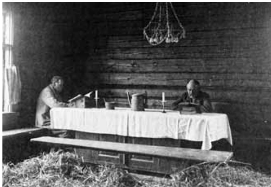
Hljainen jouluilta vanhassa pirtissä.

Mustalaisia kulki usein suurin joukoin perhekunnittain ajopeleineen. Heidän elämänsä tuntui olevan ihmisten hyväntahtoisuuden varassa. Mustalaisyksiin myös välillä kyllästytettiin, kun heidän tarpeillaan ei ollut mitään rajaa ja varsinkin, jos he käyttäytyivät röyhkeästi. Aina ei näistä vieraista väli-