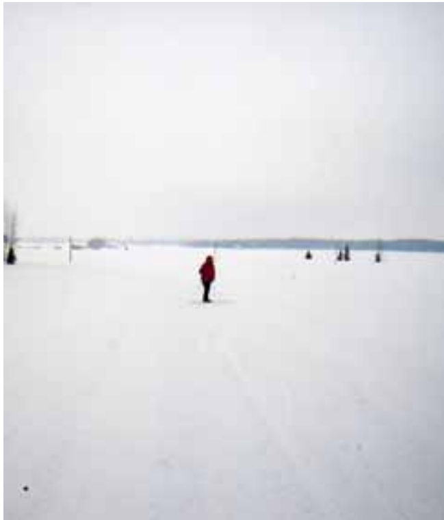
Pelloilla on tilaa hiihtää.

Ikääntynytkin ihminen voi hoitaa kuntoaan, kun on joutoaikaa ja raajat toimivat. Talvella hiihtäminen on kunnonkohotusta. Vauhdin ei tarvitse olla pääasia.