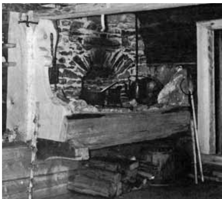
Karjalainen savutuvan uuni. Uhvatta pystyssä oven vieressä.

Vielä piti leipoa piirakoita ja sultsinoita. Viimeksi emäntä laitto vettä ja ohrarynejä tsukunaan ja nosti sen uhvatalla uunin perälle jälkilämpöön hautumaan yli yön. Aamulla oli puuro valmista.