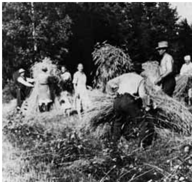
Elonleikkuu Lehtimäen pellolla 1935.

Olin pikkupoikana näkemässä Lerpakan makasiinin