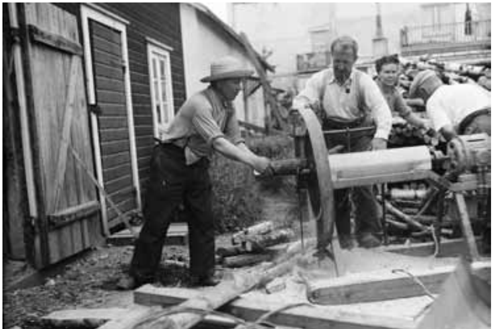
Polttopuiden tekoa.

säilömään paitsi arkiston valokuvat, myös muu tieto. Tavoitteena on, että jonain päivänä kuka tahansa voi tutustua kattavasti ja vaihtomasti kotiseutumme historiaan.