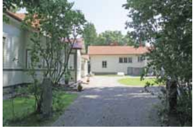
Hovilan kartanon kunnostus aloitettiin kesällä 2009 hirsirakenteiden kengityksellä ja murtuneiden kattotuolien vahvistamisella. Päärakennus maalattiin kesällä 2010.

Hovilassa pidettiin kärjjiä 1880–1900. Tilavaan kärjäsaliin mahtuukin runsaasti väkeä tänäkin päivänä. Korkean alapaneelin yläosaan hankittiin Keski-Euroopasta vanhantyylinen tammenleivätapetti. Ikkunaverhoiksi valittiin valkoiset puuvillakankaiset sen ajan tyyliset ”heittoverhokapat”. Pöydät teetettiin vanhojen mallien mukaan ja tuolit ovat osittain