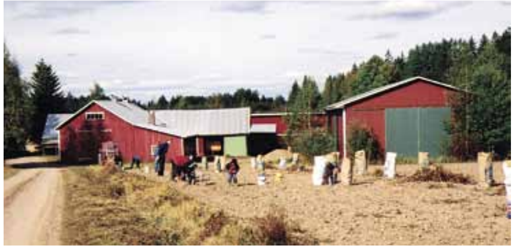
Suomisen perunapellolla vuonna 2002.

Meillä oli autossa mukana vähän välipalaa. Karkkipussitkin oli varattu molemmille, koska oli lauantai ja karkki-