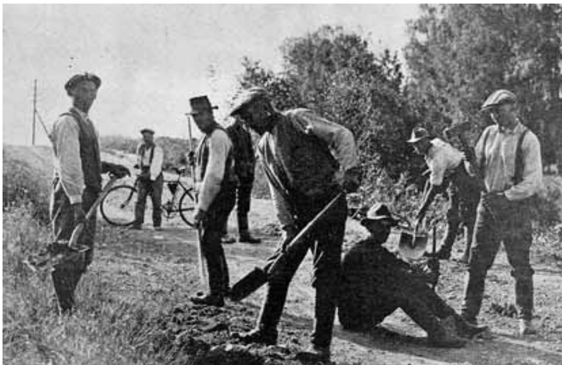
Lankin ahdetta alennetaan 1910-luvulla.