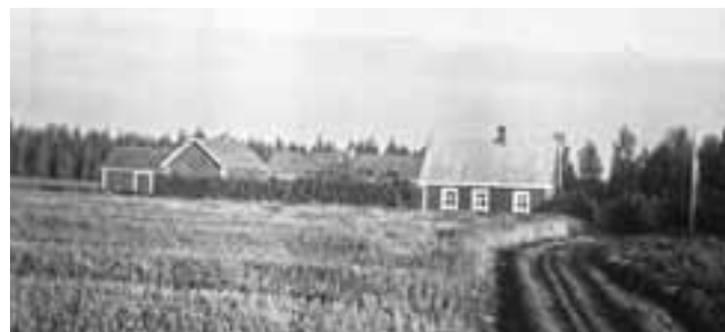
Ojala.