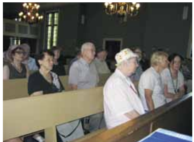
Muurla-Seura Somerniemien kirkossa 2011.

Somerolla käy enimmäkseen eläkeläisryhmä. He tulevat yleensä viikolla. Töissä käyvät keräävät ryhmän yleensä viikonlopuksi, koska ovat silloin vapaita matkustelemaan. Otamme avosylin vastaan kaikki ryhmät Somerolle ja tarjoamme jokaiselle mieleisen päivän Somerolla.