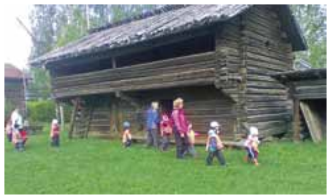
Päiväkotilapset 1.6. museoon tutustumassa.

Koululaisten museopäivän ohjelmassa oli hiirentappope- liä, esineiden tunnistusta, puujaloilla kävelyä. Oppilaat opastivat museon rakennuksissa. Ilmaisutaidon ryhmä esitti Badding-näytelmän sekä päivällä että illalla.