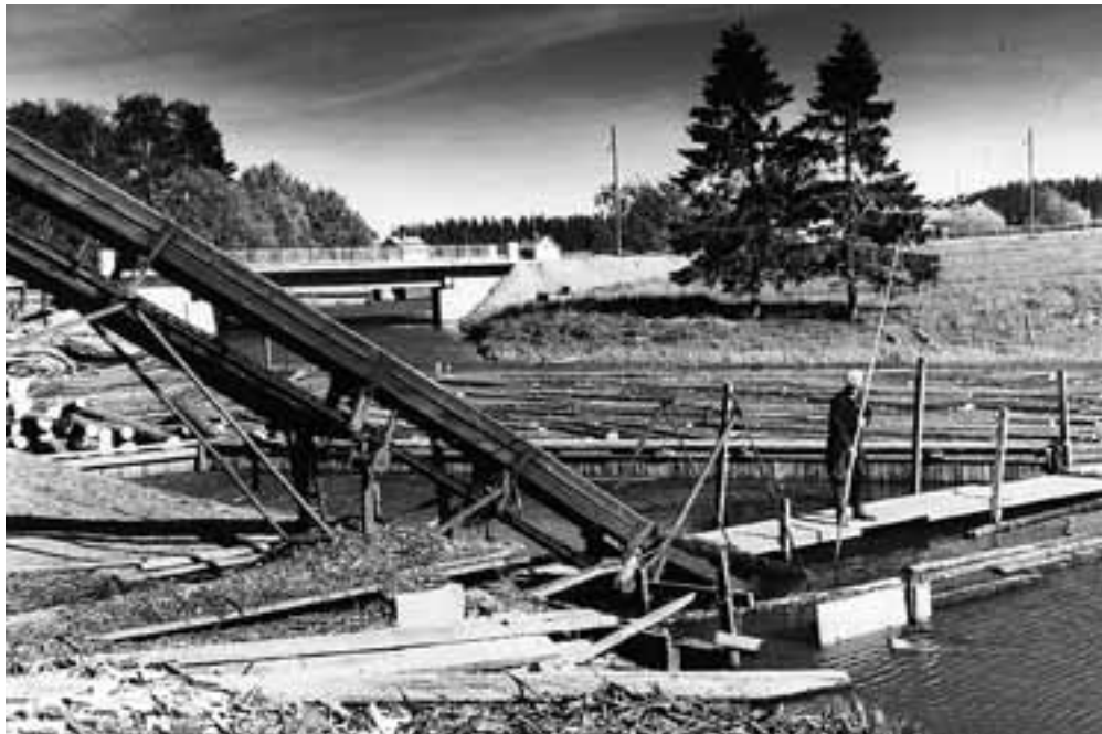
Someron Sahan tukkikuljetin 1960.