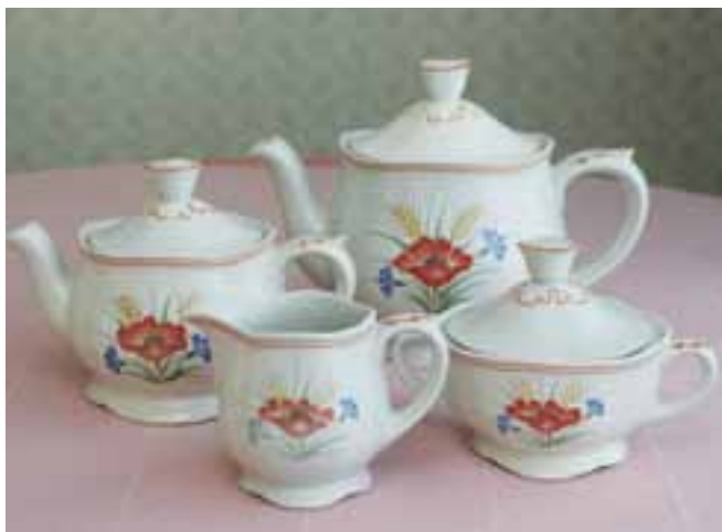
Häälahjoja tuli runsaasti. Vielä on tallella kahviastiasto, jossa on kauniit kukkakoristeet.