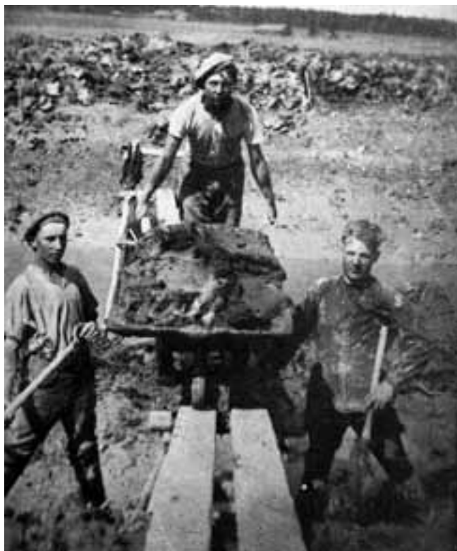
Ennen tietä tehtiin lapiolla ja kottikärryllä.

Tietarkastus, joka suoritettiin joka kevät ja syksy, oli ajankohtaan nähden maataloilla kiireisimpiä aikoja, sillä useasti ne ajoittuivat juuri viljojen kylvö- ja korjuu-aikaan. Tietä ei haluttu kunnostaa aikaisemmin, ettei sen kunto kärsisi ennen tarkastusta. Tietarkastus oli hyvin tärkeä toimitus, sitä jännitettiin koko tiekunnan osakkaiden keskuudessa. Jokaiselle tilalle oli jyvityksessä määrätty tien pätkä hoidettavaksi. Ei kukaan olisi sallinut, että hänen osuudesta tulisi moitteita tai määräys jälkitarkastukseen. Tarkastuksessa oli mukana nimismies,