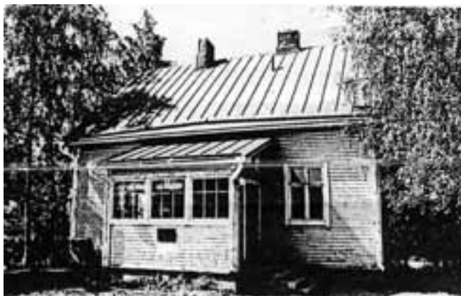
Lahjoituksena saadussa Ruusa-kodissa Sepäntiellä toimi lasten leikkikoulu 14 vuotta.