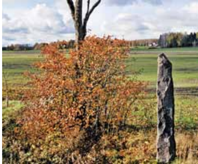
Virstanpylväs Pitkäjärvellä Kennintien risteuksen kohdalla.

Härkiä ei käytetty pitkillä matkoilla, sillä sorkkaeläimenä se väsy helposti. Kotona härkä oli verraton työjuhta. Kun hevoset vietiin sotaan, härät saivat jäädä kotiin. Sanotaan, että hevosella Härkätien kulki päästä päähän viidessä päivässä. Ennen oli Somerolla paljon portteja ja veräjäiä, sillä kotieläimet tepastelivat vapaasti tiellä. Sieluni silmin näen jonkun kiltin pojan tai tytön avaamassa ja sulkemassa porttia kulkijoille. Joskus tämä saattoi saada