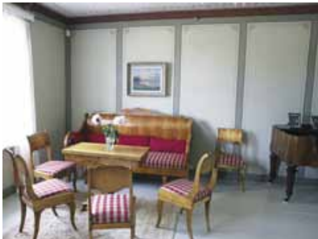
Suuressa salissa on entistetty katto- ja seinämaalaukset. Hovilan vanha biedermeier-kalusto kunnostettiin salia varten.

Ruokasalin entinen vaaleansinisen tunnelma säily-