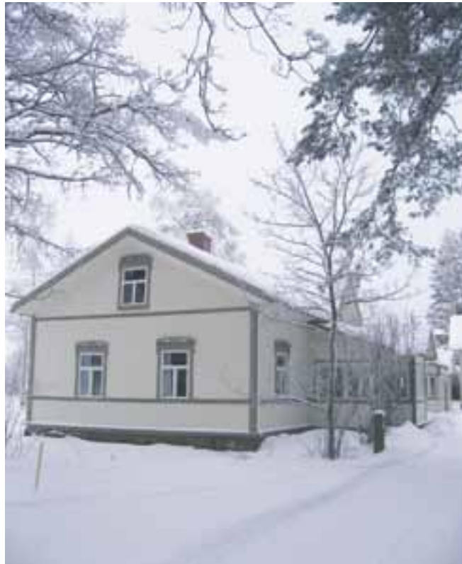
Hovila vuonna 2011.

Hovilan vanhan tilikirjan mukaan on vuonna 1886 ruispeltoja varten tuotu iso määrä luujauhoja lannoitteeksi. Tämä lienee ensimmäisiä kertoja, jolloin seudulla on käytetty apulantaa. Oman käytön lisäksi sitä myytiin huutokaupalla talollisille ja muutamille torppareillekin.