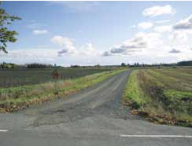
Härkätieta Pitkäjärvellä. Kuninkaankivi Långsjön risteyksessä. Kartanossa yöpyi Ruotsin kuningas Adolf Fredrik 9.–10.7.1752.

vauhdissa. Usein turistikin ihmettelevät valmisteilla olevia rivi- ja omakotitaloja. Vaurasta seutua, kuuluu toteamus. Varsinainen nähtävyys ovat Someron viljalakeudet ja Somerniemien harjumaisemat. Myös tanssi ja urheilu ovat Somerolla vauhdissa. Jokaiselle riittää jotakin harrastusta aina ratsastusta, urheiluautoilua ja keilaamista myöden.