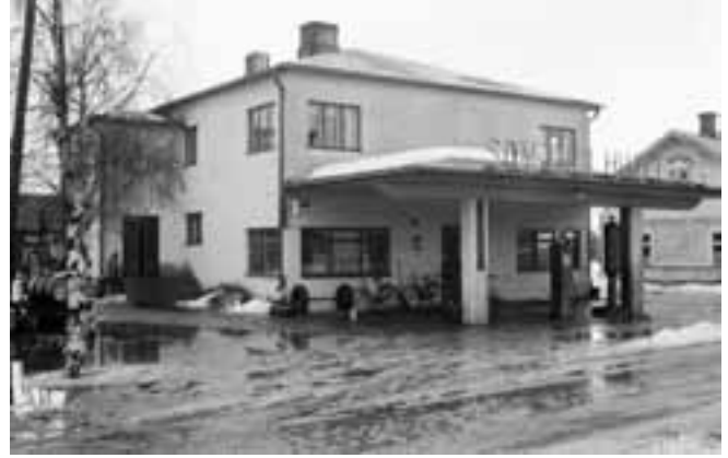
Someron Huolto Oy.