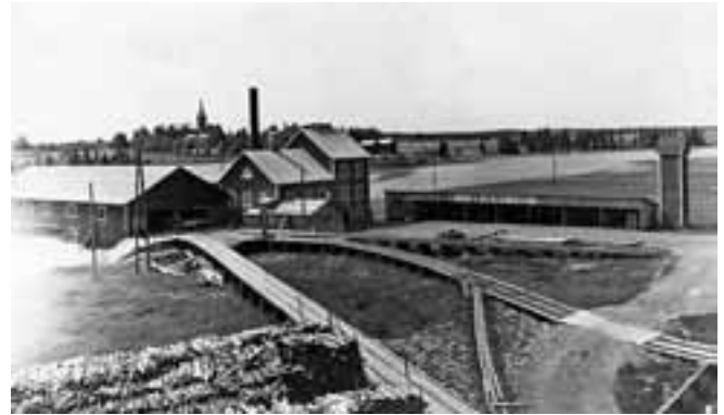
Someron Saha. Kirkko näkyy taustalla.

Saha oli merkittävä työnantaja Somerolla, suurimman osan vuotta monen perheen elannon turvaaja. Ja jos uittamalla Somerniemen metsistä tullut tukki usein joulun alla loppuikin, saatiin maan roustaannuttua autoilla metsistä uutta tukkia. Vuoden ilmoista ja keleistä riippui, miten moni