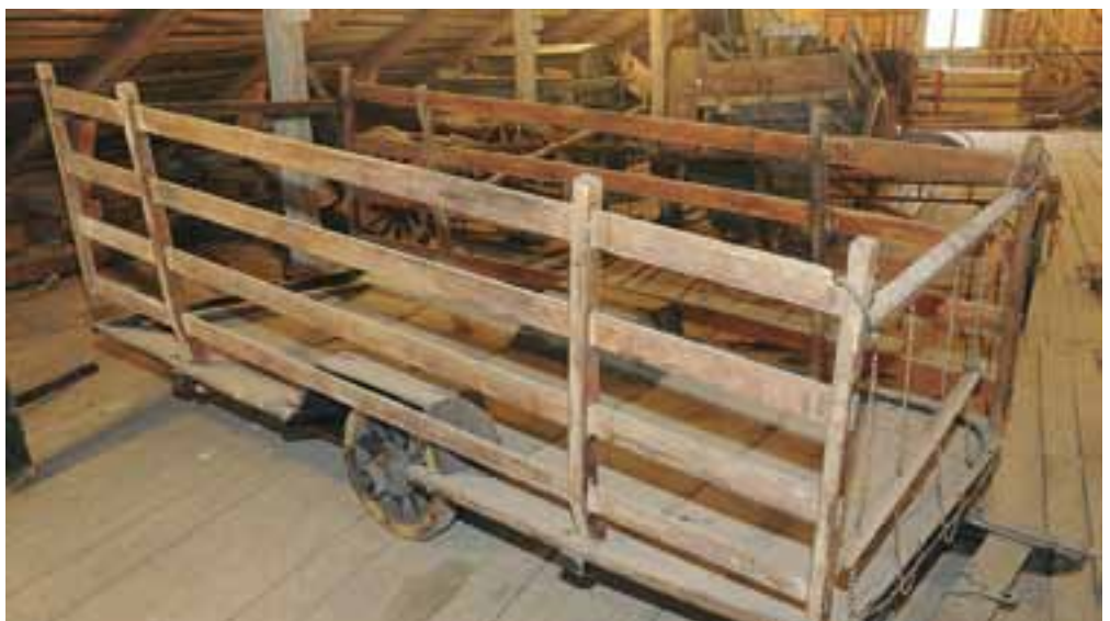
Tuuppurit eli heinäkorjuukärryt, jossa on myös jalakset. Laitojen eli rehtojen sisään saatiin tehtyä kunnan kuorma.

sesti notkoheinät koottiin, mutta häkki kaatui helposti. Tuuppurit pysyivät pystyssä, vaikka ne olivat kuin maailmanlopun välineet. Ne keikkuivat. Kun meni takapäähän, etupää nousi ylös. Tämä johtui keskellä tuuppureita olevista pyöristä. Notkon loivemmasta eli laukumasta mentiin alas ja tuottiin kuorma ylös. Alas mennessä köytettiin pyörät kiinni rehtoihin. Muuten eivät hevoset olisi voineet pidättää tuuppureita, koska aisoina olivat köydet tai ketjut. Köysi- tai ketjuaisaiset kakkulat kiinnitettiin tuuppureihin noin kaksikymmentäsensenttisellä s-muotoisella koukulla, joka kuitenkin helposti irtosi. Isä teetti Stälbergin pajassa koukun, jonka toinen pää oli melkein umpinainen silmukka ja toinen pää vähän loivempi. Ajettaessa hän työnsi vielä kepin tiukentamaan silmukka. Isä kutsui keksintöään ”Sattuma-Villen konstiksi”. Sattuma-Ville