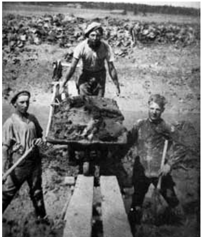
Ennen tietä tehtiin lapiolla ja kottikärryllä.

Tietarkastus, joka suoritettiin joka kevät ja syksy, oli ajankohtaan nähden maataloilla kiireisimpiä aikoja, sillä useasti ne ajoittuivat juuri viljojen kylvö- ja korjuu-aikaan. Tietä ei haluttu kunnostaa aikaisemmin, ettei sen kunto kärsisi ennen tarkastusta. Tietarkastus oli hyvin tärkeä toimitus, sitä jännitettiin koko tiekunnan osakkaiden keskuudessa. Jokaiselle tilalle oli jyvityksessä määrätty tien pätkä hoidettavaksi. Ei kukaan olisi sallinut, että hänen osuudesta tulisi moitteita tai määräys jälkitarkastukseen. Tarkastuksessa oli mukana nimismies,