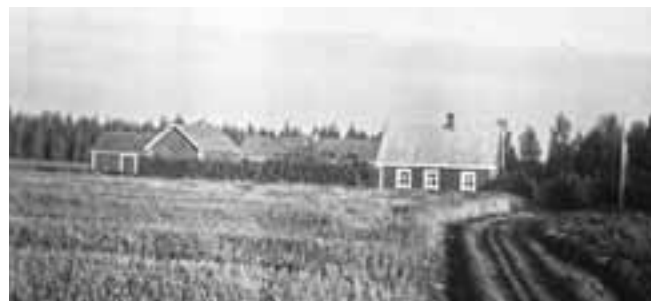
Ojala.