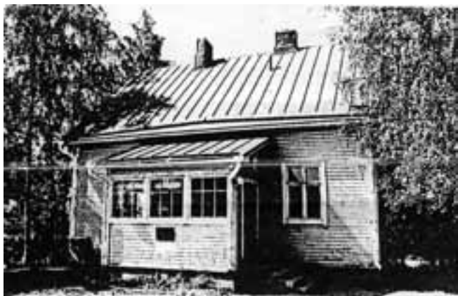
Lahjoituksena saadussa Ruusa-kodissa Sepäntiellä toimi lasten leikkikoulu 14 vuotta.