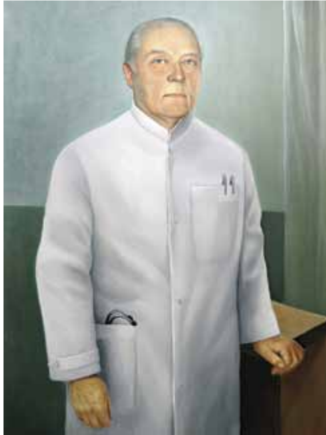
Juha lisäksi Jonkka 1911–2007. – Maalaus Aulis Uotila.

viettiin syömään Jonkan kanssa. Minusta hän näytti pelottavalta ja vanhalta mieheltä. Jonkka oli tuolloin 42-vuotias. Ainakin kerran söimme lihasoppaa, puhuimme small talkia ja lakkasin pelkäämästä häntä. Syötyäni näytin kirjoituspöydällä olevaa keinu- maista vekotinta ja ihmettelin mikä se oli. Jonkka hyväntahtoisesti näytti miten sillä kuivataan mustetta paperilla.