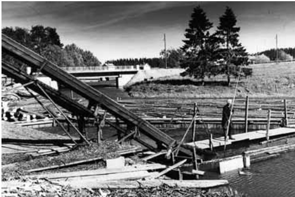
Someron Sahan tukkikuljetin 1960.