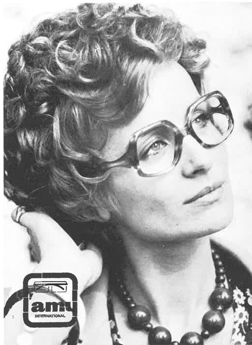
malli NEW LAM 06

Jos mielesi tekee Jouluksi uusia SILMÄLASEJA, niin poikkea meillä Kirkas joululahjavihje: LAHJAKORTTIMME.