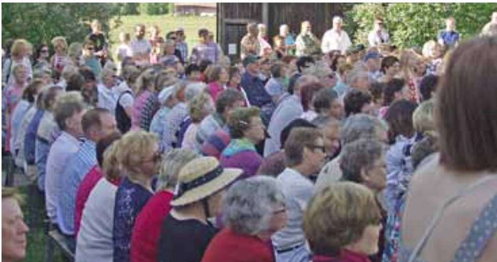
Häntälän kyläiltamat pidettiin Yli-Eskolan pihapiirissä.

Kaskiston iltamien jälkeen projektissa ollaan puolivälissä. On ollut ilo huomata miten innokkaita ja aktiivisia kyläläisiä löytyy Somerolta. Yhteishenki on lähes käsin kosketeltavissa ja talkoohenkeä löytyy.