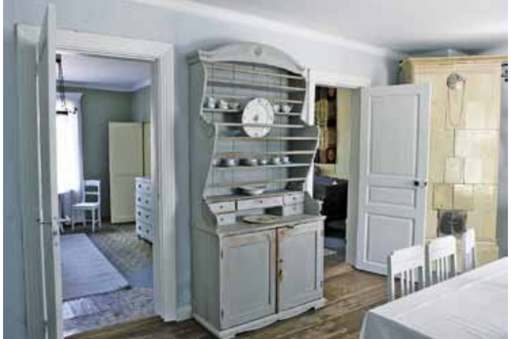
Eteisestä päästään ruokasaliin, josta aukeaa ovet kahteen kamariin ja kärejäsaliliin.

Salista löydettiin alkupe- räiset katto- ja seinämaalaukset, jotka kunnostettiin Museoviraston valvonnassa. Salin yhdelle seinälle jätettiin esille myös fragmentti vanhaa alimmaista seinämaalauk- set, jonka yhteyteen kuulunut osa leh- tikuvioista katon holkkalista vahvistettiin. Vanhoja tapetti- kerroksia otettiin talteen kuusi. Hovilan vanha bieder-meier sohva verhoiltiin ja lisäksi hankittiin toinen bieder-meier kalusto, joka alkuaan on tee- tetty Porvoon pappilaan 1820. Lepänjuuripöydän ympärillä on Raumalta kotoisin olevat biedermeier-tuolit. Kartanon saliin kuuluu taffelipiano. Kattokruunuksi hankittiin kertaustyylinen kristalliva- laisin. Vanha lankkulattia