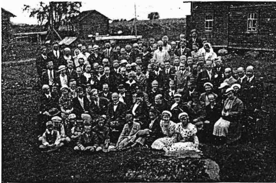
Paavolaisten Sukuseuran ensimmäinen sukukokous Vuottaalla 28.6.1936 "Koko suku"