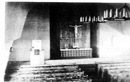
Pajarin kirkko Kivennavalla Linnamäellä v.1943

kanteen oli kaiverrettu hänen rakenta- mansa kirkon kuva.