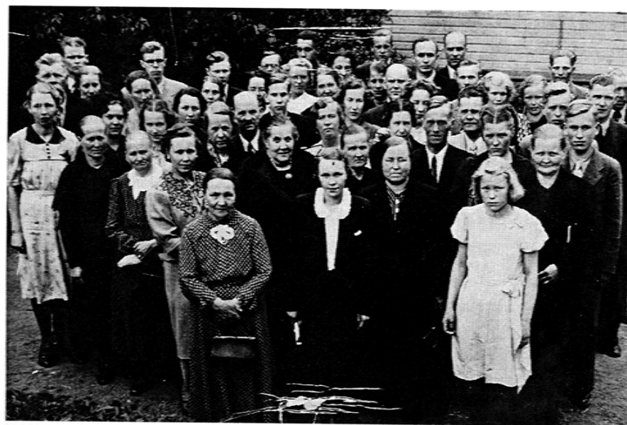
Hämeenlinnassa elokuussa v. 1941