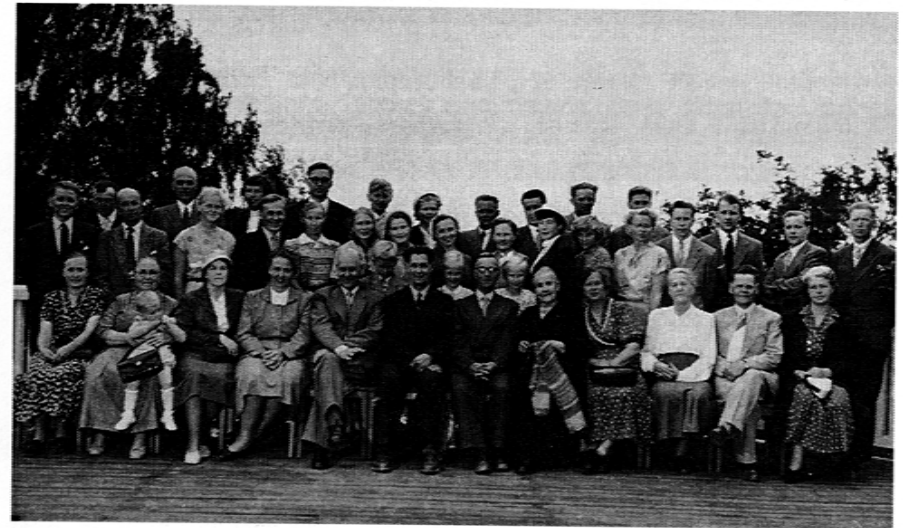
Helsingissä Klippanilla v. 1953