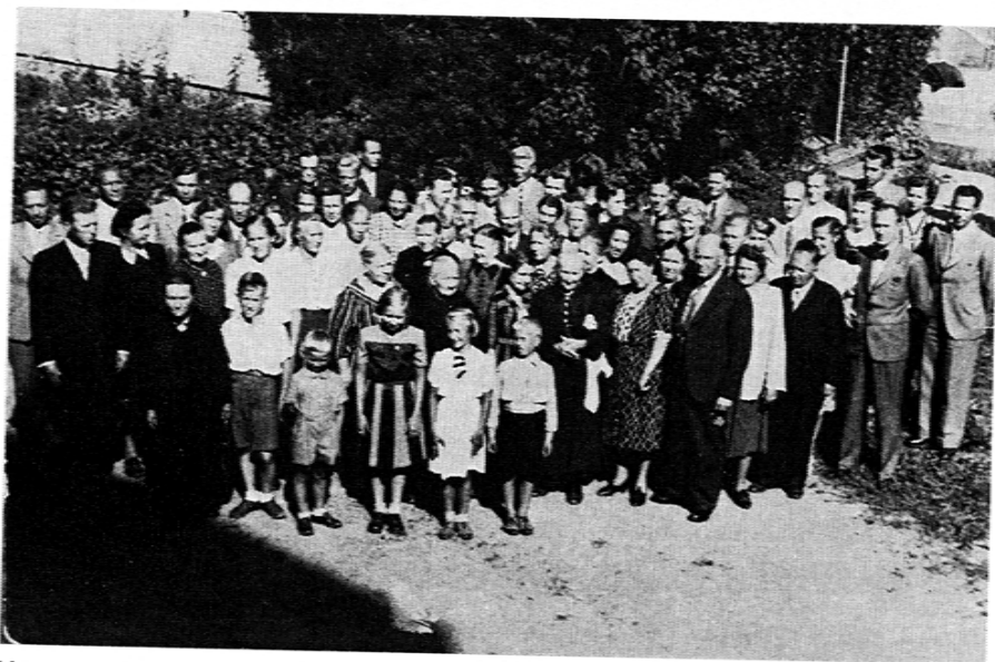
Hämeenlinnassa elokuussa v. 1947

kanssa me pääsimme yhteisymmärrykseen juhlan järjestelyistä. Meidän perheeltä oli kadonnut kahden kuukauden maitokortit, mutta mieheni oli saanut ylipuhutuksi erään miehen, joka ajoi meijerin maitoja, ja hän toi meille suoraan kotiin enemmän maitoa kuin korttiannokset sallivat (korttiannos oli silloin 2 dl aikuiset ja 6 dl lapset). Siksi voin viedä maitoa ravintolaan juhlia varten. Sokeria olimme ostaneet peräti 50 kg:n säkin ennen kuin se meni kortille, mutta se oli kovettunut, kun kuljetin sitä evakkoreissullani Sääksmäellä. Niinpä sitä ei kulunut paljoa, kun säkistä oli vaikea ottaa, kun se oli niin kovaa. Siten sitä riitti sukukokouksen leipomisia varten.