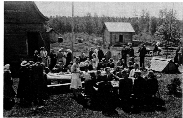
Vuottaalla elokuussa v. 1936 ensimmäinen sukkokokous. Kaurakiisseli on nähtävästi nautittu ja nyt on kahvin vuoro

täällä mitään venäläisvaaraa ole, paavolaisvaara vain. Nyt he, tämä vaara, juttelivat, nauroivat ja halailivat jälleennäkemisen ilossa. "Ai siekii tulit ja sie. Voi mite mukavaa, mite lokosaa on olla täällä. Naiset lähinnä sanailivat, parveilivat, juttelivat ja miehet seisoskelivat niinkuin miesten kuuluu. Muutenkin noudatettiin vanhaa, vankkumatonta patriarkaalista järjestystä. Miehet asettuivat ensin valkoliinaisten pöytien ääreen nauttimaan tulikuumaa kaurakiisseliä voisilmän ja kylmän maidon kanssa. Oli kyseessä oikea keittotaidon näyte kannakselaiseen tyyliin, jota minun viipurilainen äitini ei saanut täysin onnistumaan niinä harvoina kertoina, kun hän yritti keittää sitä isän mieliksi. Oli tietysti mainioita, ohutkuorisia piirakoita moninlaisin täytein ja montaa mallia. Myöhemmin ilmestyivät, kun välillä oli kuunneltu ohjelmaa, pöydille kahvikupit mainion, kotona leivotun pullan ja vesirinkelin kera. Ei mitään kaupunkilaista, ei mitään paakarin tekemää. Mainiot, taitavat talonemännät ja heidän nopsajalkaiset nuoret apulaisensa valkoisissa esiliinoissaan saivat runsaasti kiitoksia kokousvierailta - niinkuin muistelen.