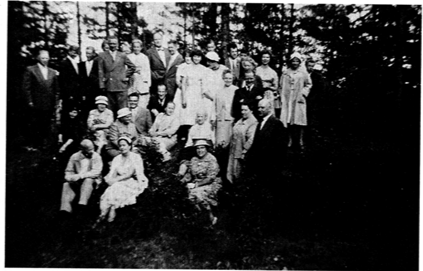
Jaalassa v. 1958