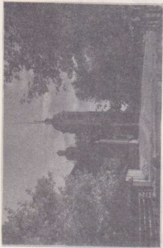
KIVENNAVAN KIRKKO v. 1934 VAS. PITÄJÄNTUUPA. KATSO KIVENNAVAN HISTORIA siv. 200 - 202.