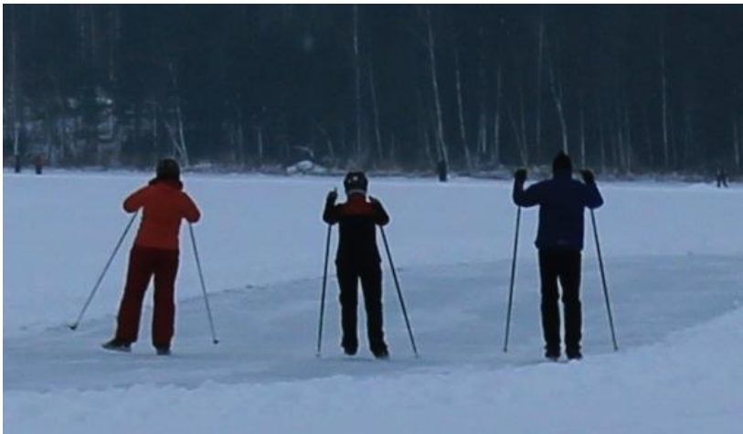
Retkiluistelun suosio on kovassa kasvussa.

Retkiluistelu sopii lähes kaikille. Laji ei kuormita niveliä, kuten esimerkiksi juoksu. Pidemmille retkille ja haastaviin olosuhteisiin tarvitaan kuitenkin hyvä peruskunto ja luistelutaito. Luonnonjäällä turvallisuusasiat ja hyvä varustus ovat tärkeitä. Jäänaskalit, reppu, jossa on ilmatiiviissä pussissa varavaatteita, jääsauva ja heittoköysi kuuluvat retkivarusteisiin. Vauhdin hurman takaavat pitkäteräiset retkiluistimet, jotka voi kiinnittää tukeviin kenkiin tai monoihin. Tämä mahdollistaa helpon ja nopean siirtymisen apostolin kyytiin silloin, kun ei voi edetä luistellen. Jäällä kiidetään aina turvallisesti ryhmässä.