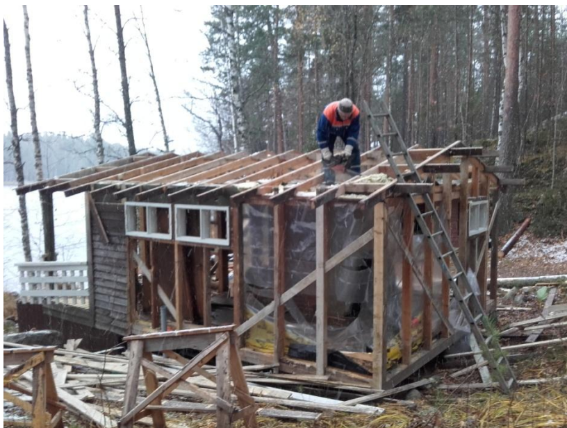
Vanhan saunan purkua.

Kuluvan vuoden suurin urakka on Tervastuvan uuden saunan valmistaminen. Vanha sauna on purettu talkootyöläisten voimin ja perustukset uudelle saunarakennukselle on valettu. Projekti lepää pimeimmän talven ylitse, mutta jo alkukevästä uuden saunan hirssiä ruvetaan nostamaan paikoilleen.