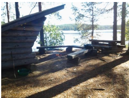
Laavu Petkeljärveltä