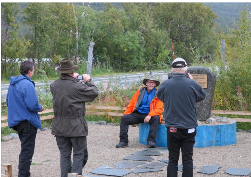
Onnellisia retkeläisiä Suomen rajalla.

Kiinnostuneet, työhaluiset kahvion ylläpitäjät, ottakaa yhteys Kari Kerviseen, puh. 044 271 9998.