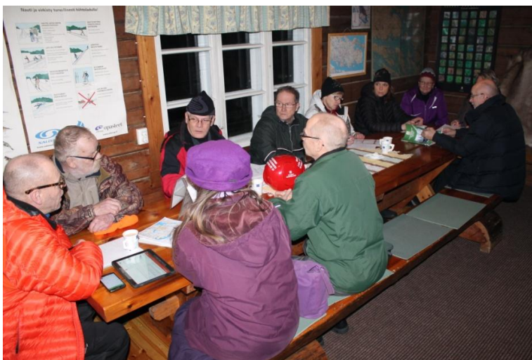
Hallitus pohtimassa tulevan kauden tapahtumia.