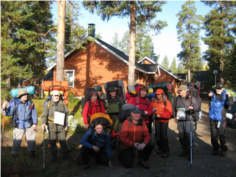
Retkeilijöitä Pallaksella