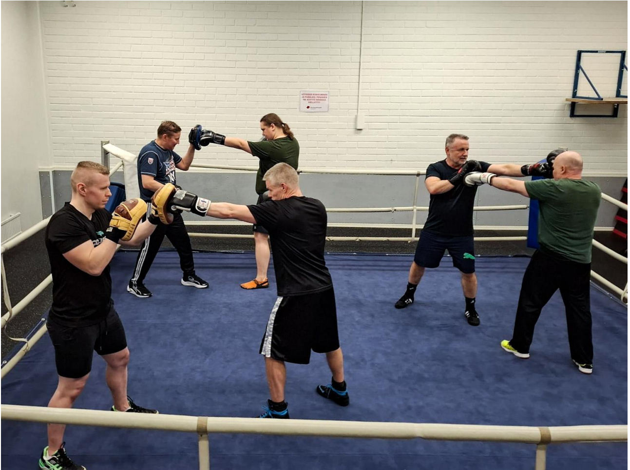
Kuva 17 - Miesten kuntonyrkkeily

Kuntonyrkkeilyharjoitusten puolella Riikka Niemi on iso kantava voima ja harjoitusten parissa kuntoaan nyrkkeilemällä hoitaa iso harrastajapohja. Harjoituskertoja kuntonyrkkeilijöillä on neljät harjoitukset viikossa ja harrastajia on runsaasti. Nyrkkeily on iloinen asia ja yksi parhaista tavoista pitää kuntoaan ja ylävartalon mobilisaatioita yllä.