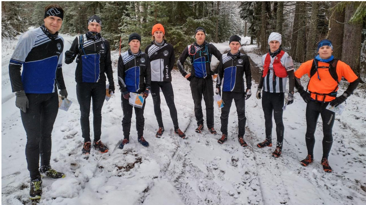
Kuva 12 - Valmennusryhmäläiset talvisella Oktobertuskalla.

Marraskuisena viikonloppuna oli Pikkulamppuyö ja testijuoksu valmennusryhmälle sekä Oktobertuska halki Pälkäneen 12 vaeltajan voimin. Tiedotuskanavia olivat jaoston verkkosivut, sähköpostitiedotteet, toimintakalenteri ja WhatsApp-ryhmä. Talvikaudella valmennusryhmä kokoontui etäpalaveriin joka toinen sunnuntai.