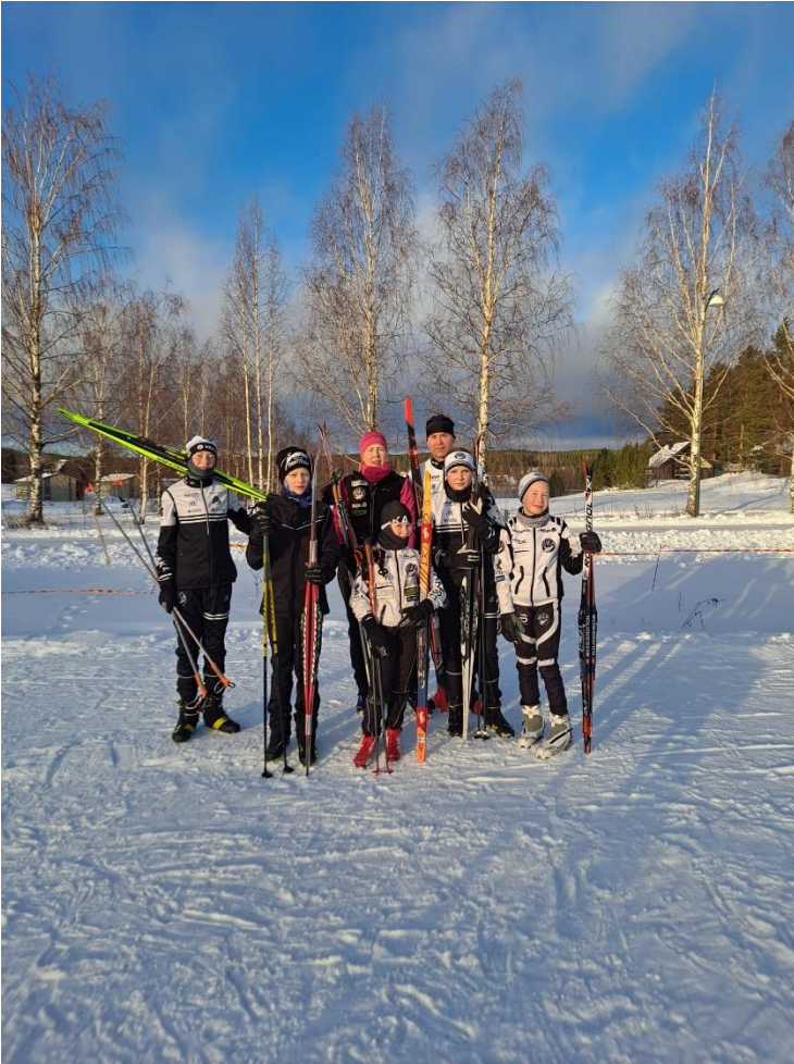
Figure 9 - Haka hiihto Hopeasompanuoret Himoksella