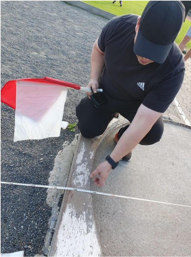
Kuva 5 - Toimitsijakoulutus

Muuna tapahtumana voisi mainita Teijan pitämän toimitsijakoulutuksen urheilukoululaisten sekä junioriryhmän vanhemmille, missä saimme muutamassa tunnissa hyvän läpileikkauksen lajipaikoilla toimimisesta.