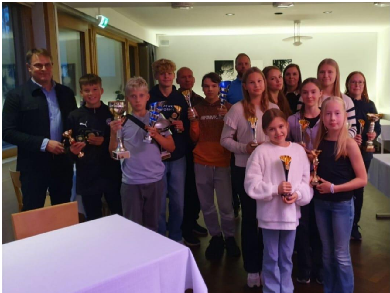
Kuva 8 - Kuuden päättäjäiset Melankärjessä

P13 4*100 Sulo Elliot Saarinen, Touko Korpela, Eelis Huotarinen, Aarni Mäkinen 53,91