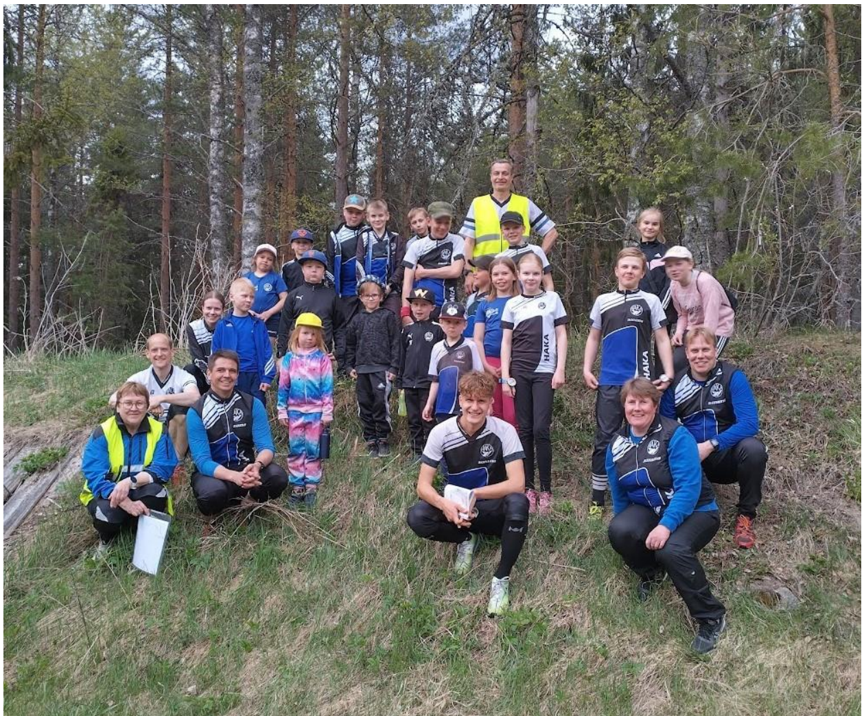
Kuva 10 - Suunnistuskoululaisia ja ohjaajia kevään maastoharjoituksessa.

Tsemppi- ja Vauhti-ryhmäläisiä osallistui kesäkuussa neljän päivän valtakunnalliselle Leimaus-leirille Pajulahdessa, mukana oli yhteensä 9 suunnistajaa ja kolme ohjaajaa.