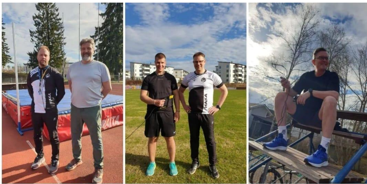
Kuva 4 - Yleisurheilun toimitsijoita

Harjoituksia järjestettiin kauden aikana 1 – 6 kertaa viikossa. Kilpailuja me järjestimme neljä kappaletta: kolmet Hippokisat sekä perinteiset Valkeakosken Nuorisokisat. Kilpailuiden määrä ja lajivalikoima oli vähäisempi edellisvuosiin verrattuna. Osittain tällä muutoksella haluttiin ohjata meidän omia urheilijoita hakemaan kovemman tason kilpailuja lähikunnista. Karu tosiasia on, että 15 vuotiaiden sarjoissa kilpailijamäärät ovat vuosi vuodelta valtakunnallisesti pienentyneet. Jotta voi menestyä SM tason kilpailuissa, on urheilijan kilpailtava läpi koko kesän sekä haettava tasaisesti tason nousua kovien kilpailujen kautta.