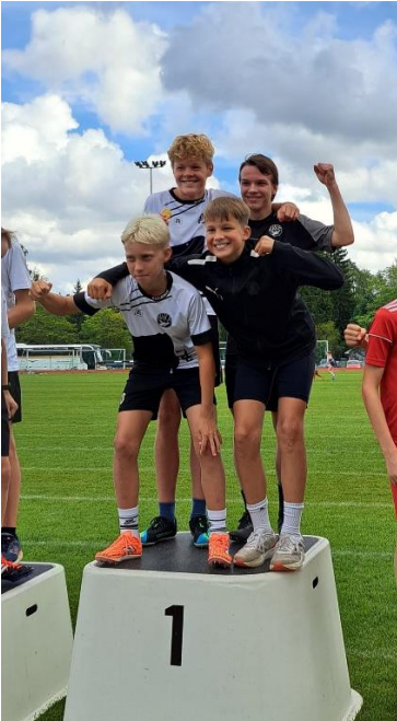
Kuva 6 - Sisulisäviestit Lempäälä