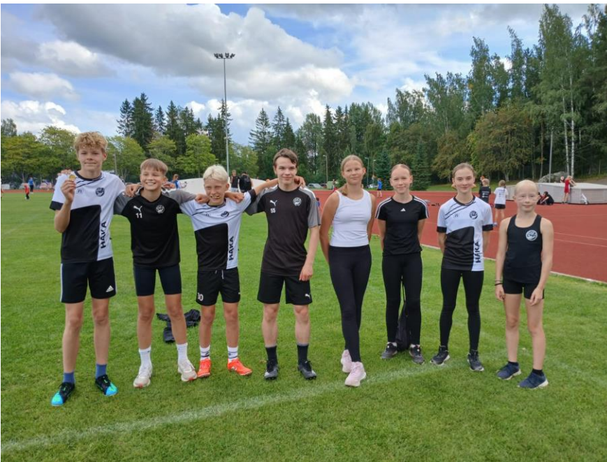
Kuva 7 - Sisulisäviestit Lempäälä