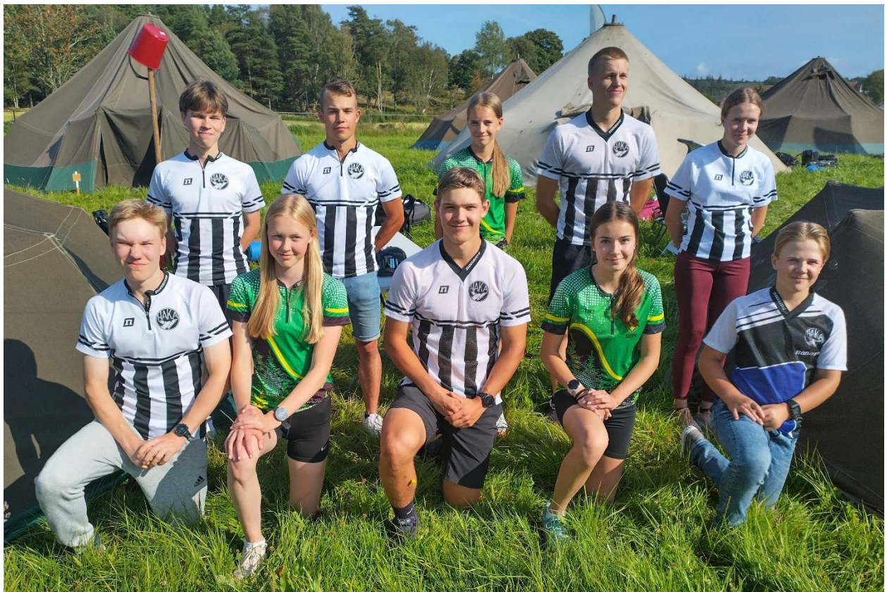
Kuva 11 - Hakan ja HIS:n yhteisjoukkue oli Ungdomens Tiomilassa 30. Matka ja kilpailu oli hieno kokemus nuorille.

Yksi suunnistuskoulun harjoitus järjestettiin Iittalassa, kun pääsimme mukaan naapuriseurojen harjoituskilpailuun. Suunnistuskoulun päättäjäisissä palkittiin perinteisesti aktiiviset osallistajat Pappilanniemen laavulla lokakuun alussa.