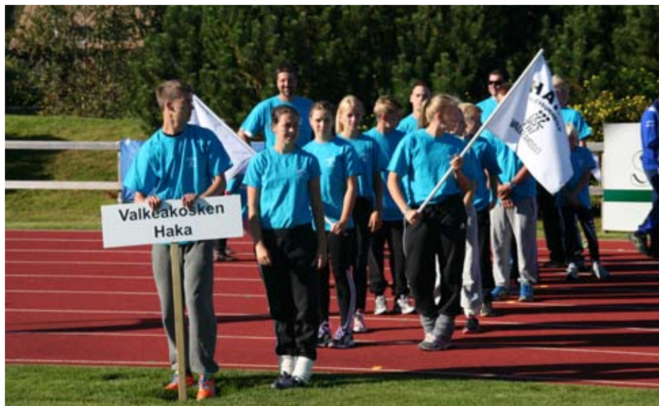
Joukkuekuva Vattenfall-loppukilpailusta Pedersödrestä.