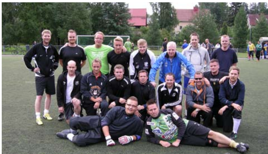
Haka junioreiden kokoontumisessa ikäluokka 1978 juhli voittoa.