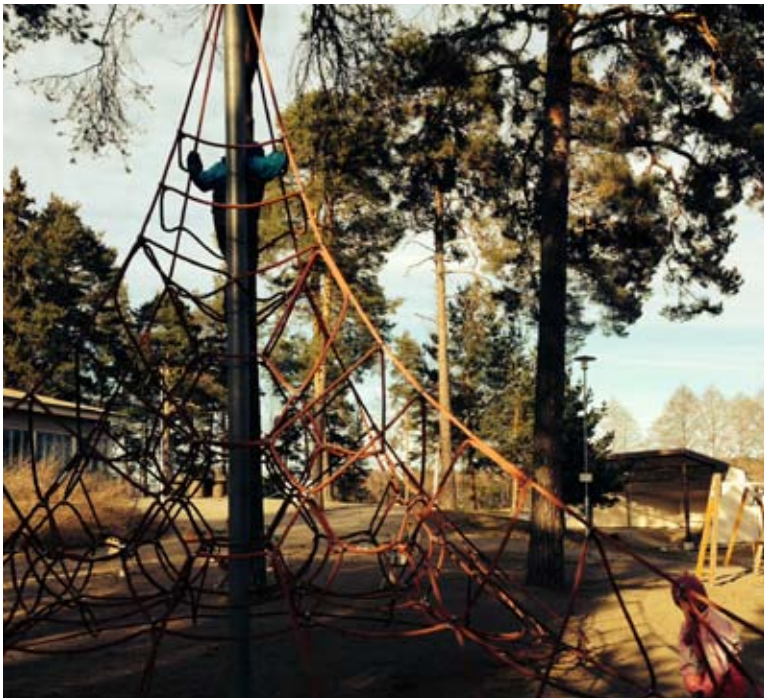
Sporttis-tsemppin lapset seikkailupuistossa.

Lisäksi Yhteistoimintajaosto on järjestänyt tyky- ja taukoliikuntaa yrityksille.