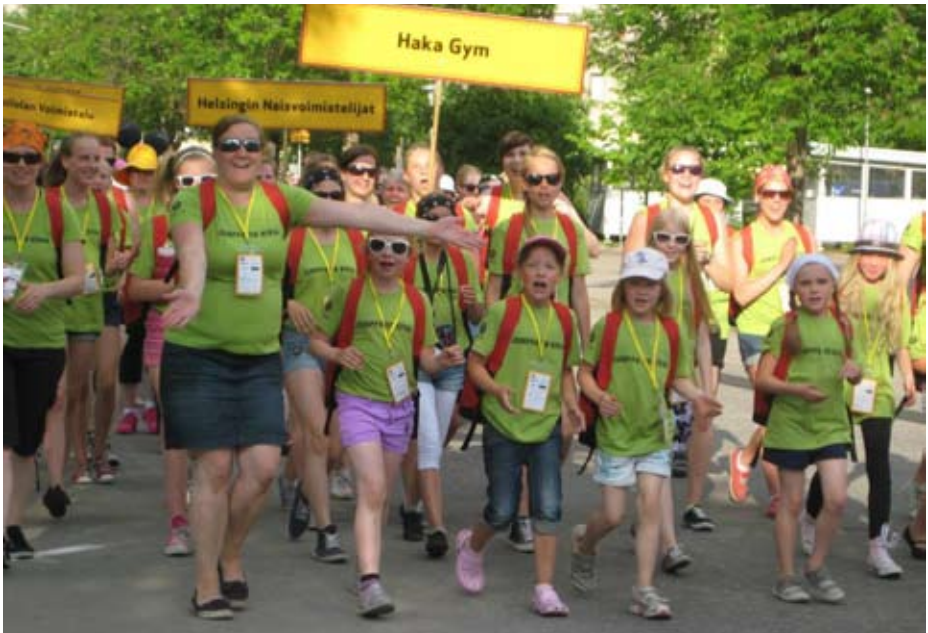
Sun Lahden avajasten tunnelmaa kesäkuussa 2013.

Jo perinteinen syyskauden avaus, Ohjaajien aloituspamaus, järjestettiin Liikuntahallin kokoustiloissa 26.8. Seuran ohjaajia oli paikalla upeat xx