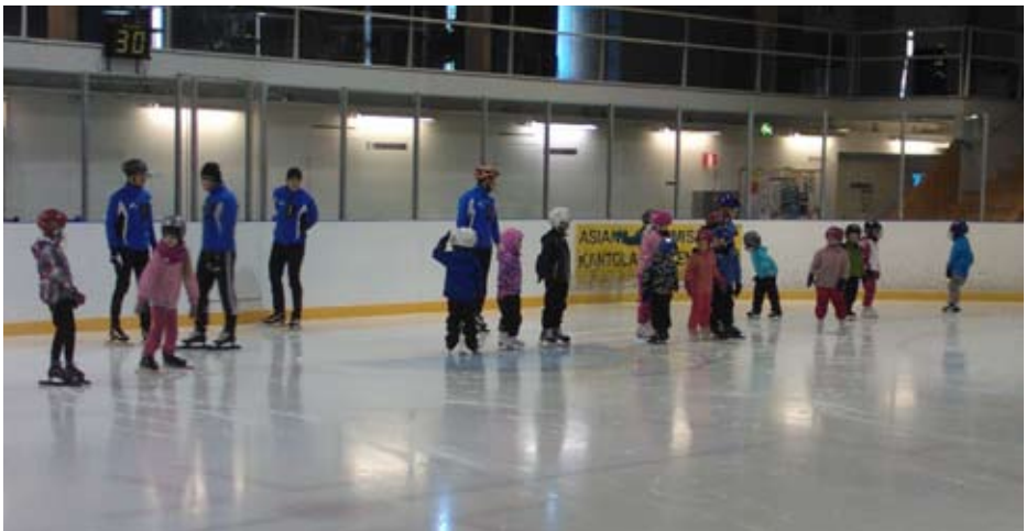
Luistelukoululaisia ja ohjaajia Wareenassa vuoden 2013 syksyllä.