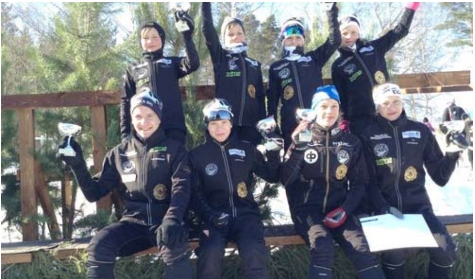
Aamulehden nuorisoviestin voittajat.