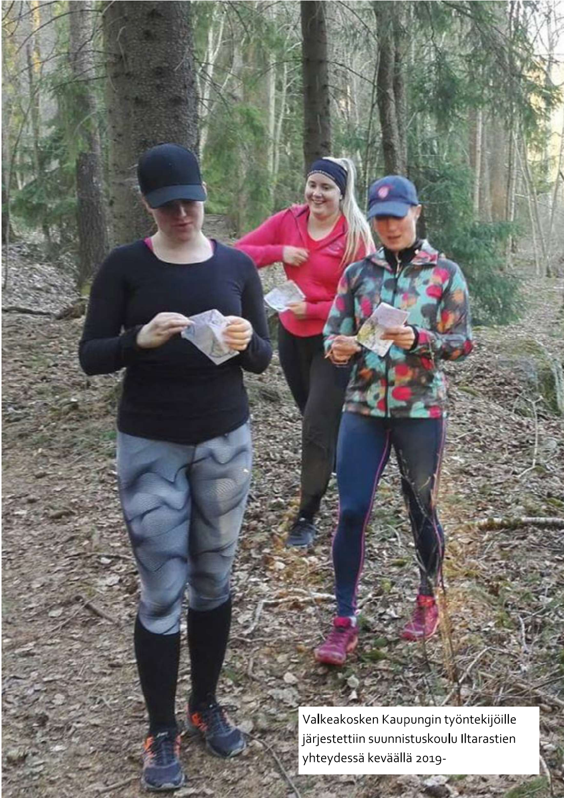
Valkeakosken Kaupungin työntekijöille järjestettiin suunnistuskoulu Iltarastien yhteydessä keväällä 2019-