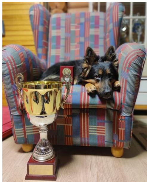
Suur-Savon Kennelpiirin vuoden 2022 paras palveluskoira "Riha"