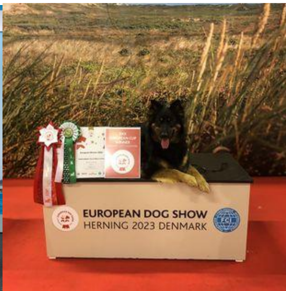
NORDIC MVA FI MVA DK MVA EE MVA LV MVA CH MVA(N) LT MVA CZ MVA BALT MVA HU MVA LT JMVA HeW-19 HeJW-19 BALTV-20 DKKJUBW-22 BORNHW-22 HAHW-22 EUV-23 TAABERNAKKELIN YOU'RE MINE FURFROU