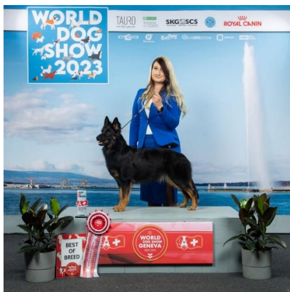
FI JMVA CH MVA(N) LT JMVA HeJW-22 PMJV-22 JV-22 BALTJV-23 MV-23 AJAWIXEN'S ECHO OF DÉJÀ VU

Yhä kasvava määrä tsekinpaimenkoiria edusti Suomea myös maan rajojen ulkopuolella. Vuodelta 2023 meillä on nartuissa sekä Maailman Voittaja että Euroopan Voittaja. Taulukossa myös Kennelliiton vuonna 2023 vahvistamat valionarvot & voittajatittelit.