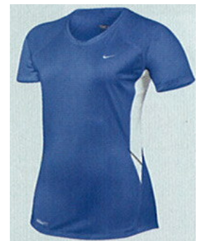
paita hihalla naiset