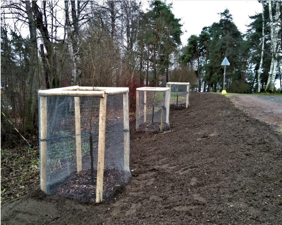
Yllä: Japaninsiipipähkinöitä Pyynikin laajalla viheralueella.