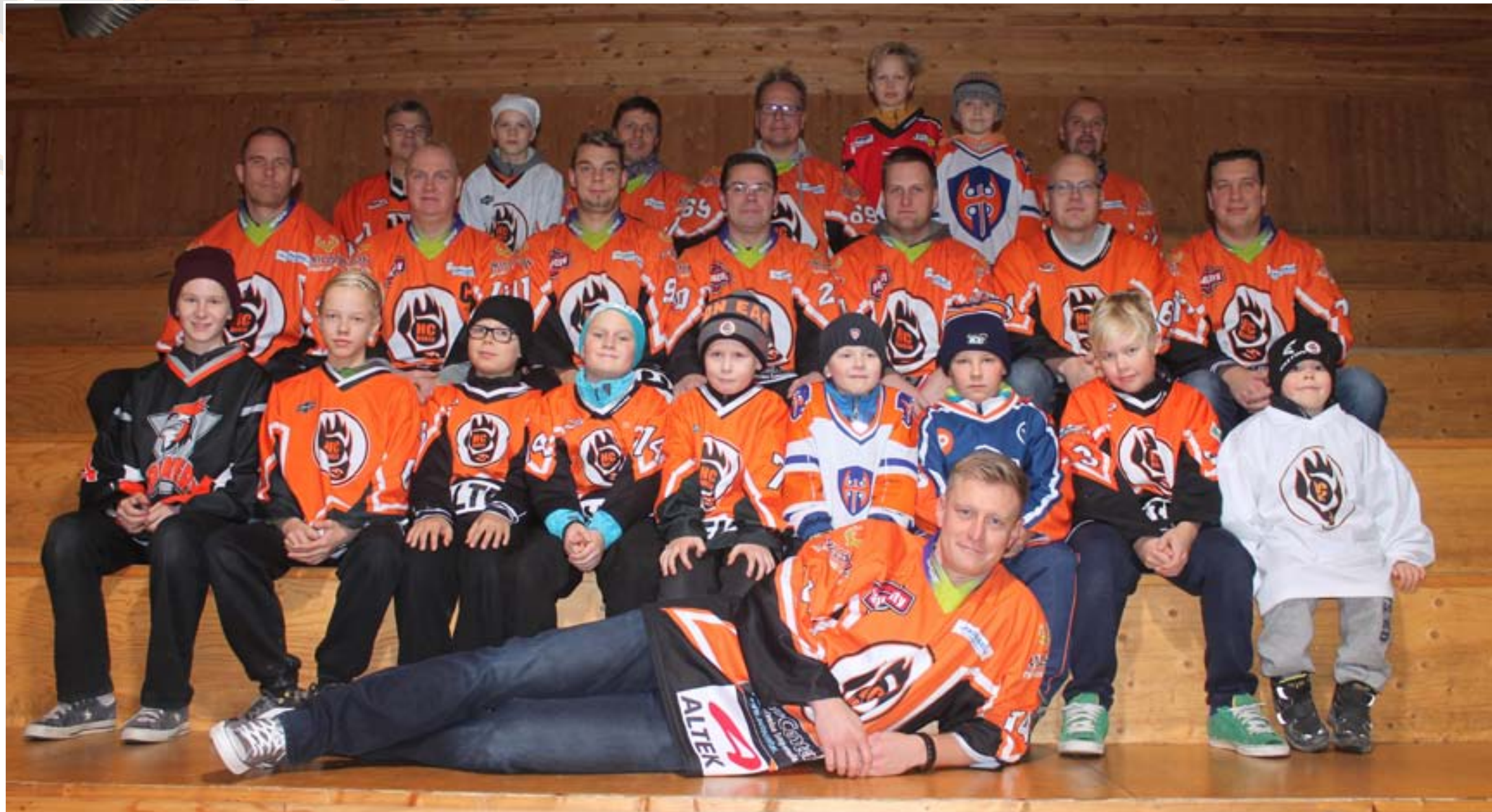
HC Power 2014-15. Kuvassa pelaajat sekä heidän jälkikasvua omissa peliasuissa.