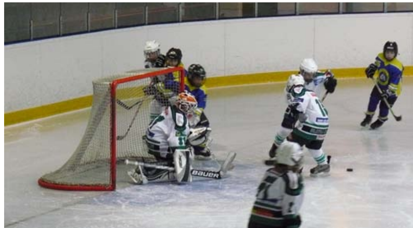
Torjunta. Ensimmäisen kotipelin pelitilanne.