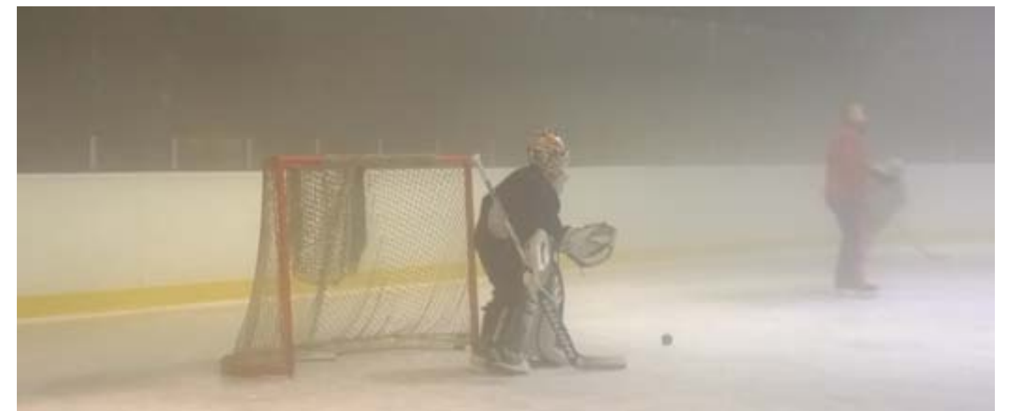
Ekoissa harjoituksissa. Sumua halli täynnä. Ulkona 25 astetta lämmintä.