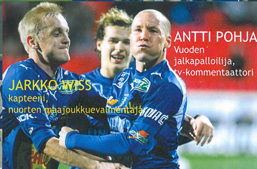
ANTTI POHJA Vuoden jalkapalloilija, tv-komentaattori