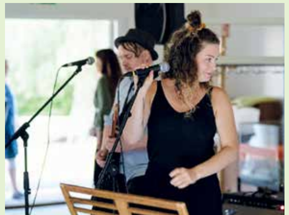
Juhannusta vaivasi jälleen kokonpolttokielto mutta bilebändi Millie Jean hehkui.