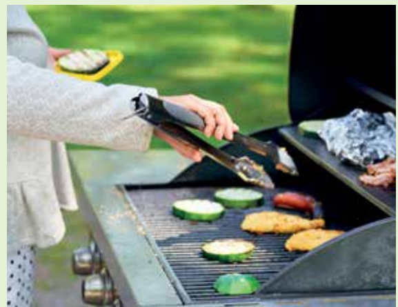
Syödään yhdessä -tapahtuma keräsi veraten pienen mutta kulinaarisen joukon piknikkareita. Pitsa se on kesäkurpitsakin.