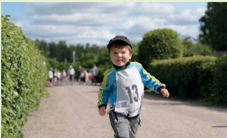
Lastentapahtuma kilpailuineen ja askarteluineen oli jälleen lasten mieleen ja jäätelöbaari muistetaan kauan.