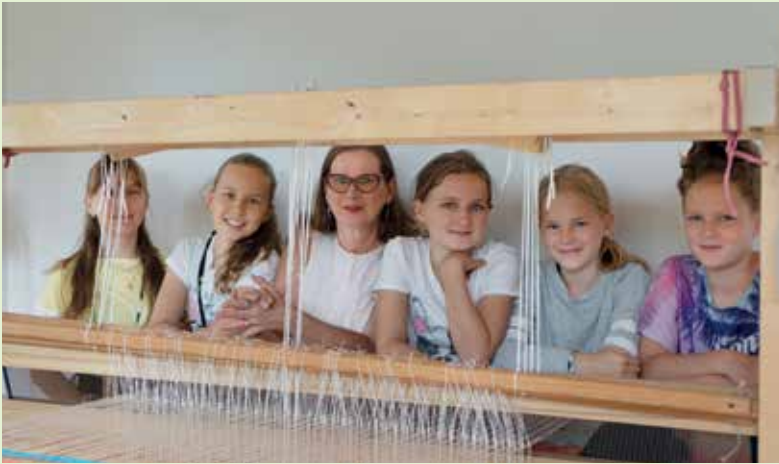
Kankaankudontaleirin päättäjäiset pidettiin lauantaina 31.8.

Kesä 2019 toi muun muassa supersuosittuja joogatunteja. Tässä kooste tapahtumista, jotka saatiin tallennettua.