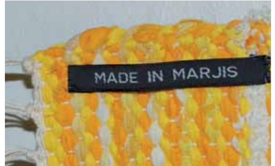
Aitoa MADE IN MARJIS -laatua! Nuo pienet ja tärkeät laput viimeistelivät monet taidokkaat työt.