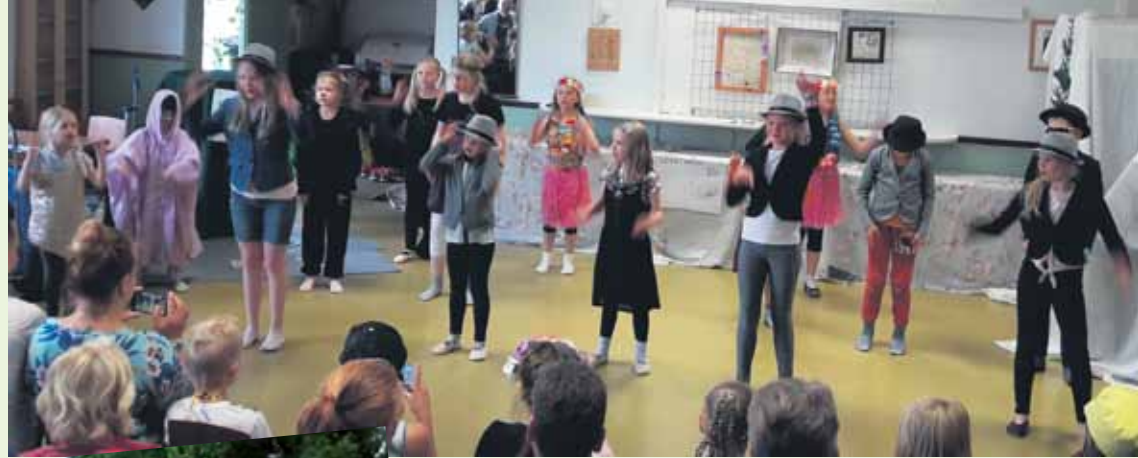
Lasten tanssileiri huipentui juhannusaattona uskomattoman hienoon esitykseen!