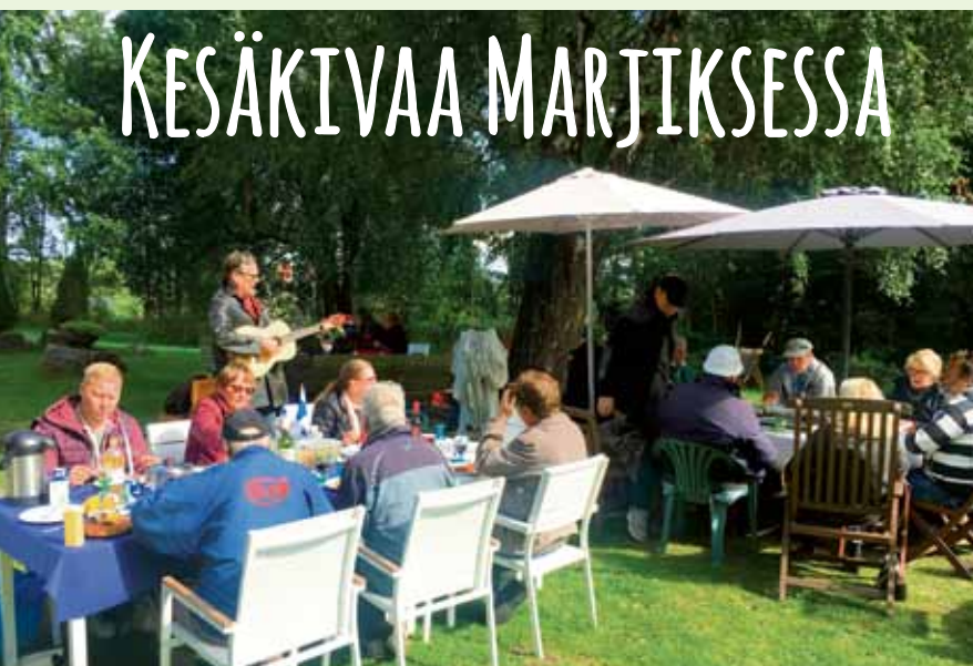
Elokuisena lauantaina osallistuimme Suomi 100-tapahtumaan yhteisellä piknikillä Kerhotalonmäellä. Tunnelman täydensivät upeat esitykset kitaransoitosta runonlausuntaan. Otettaisko ensi kesänä uusiksi?