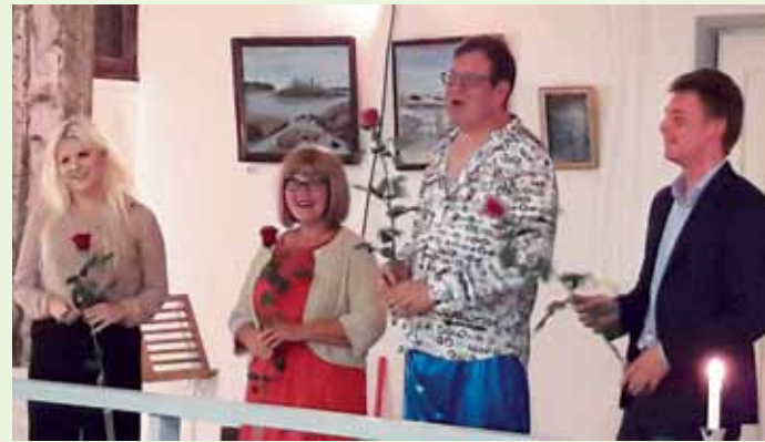
Pitkästä aikaa saimme nauttia näytelmästä. "Pelkkää petkutusta" veti Kerhotalon täyteen ja sai mökkiläiset ulvomaan naurusta.