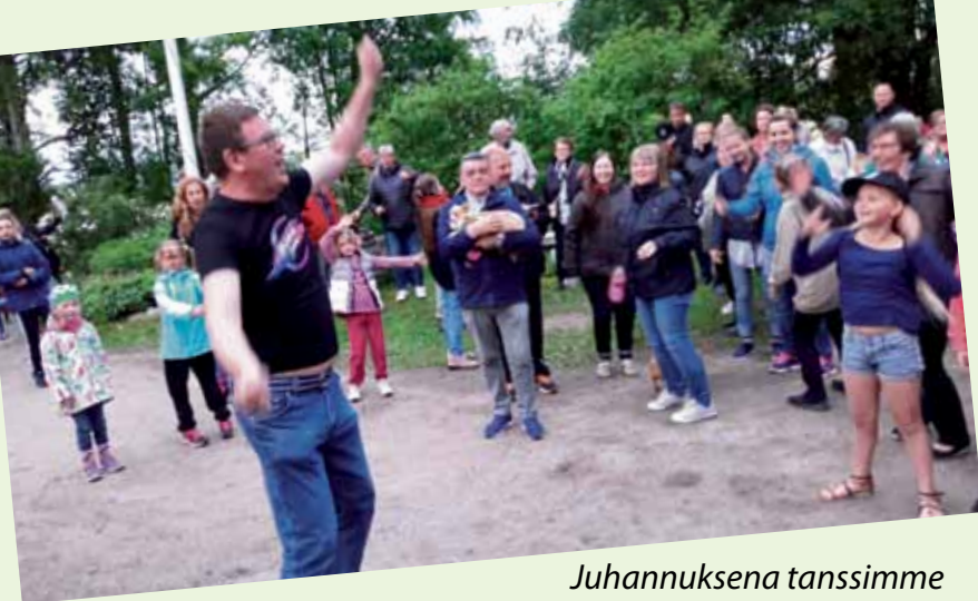
Juhannuksena tanssimme yhdessä koko Suomen kanssa Hulahulaa. Maailmanennätystä ei syntynyt mutta kivaa oli!