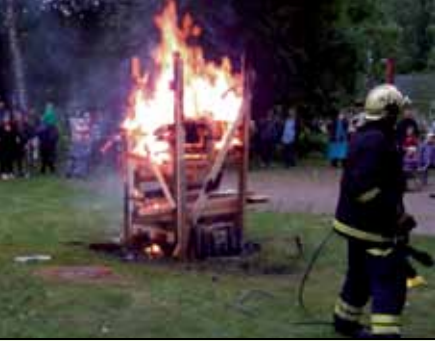
Juhannuskokkoa poltettiin Marjaniemen VPK:n valvonnassa.