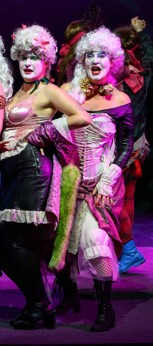
Kerjäläisooppera kuvattuna Opistotalon aula näyttelystä.

Puvustuksessa hyödynnettiin runsaasti kierrätysmateriaalia. Osa rekvisiitasta löytyi Opistotalon tarpeistosta ja osa lainattiin tai vuokrattiin muualta.