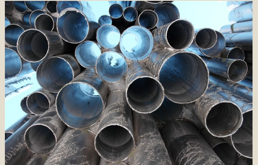
Kuva: Eila Hiltunen, Sibelius-monumentti © Kuvasto.