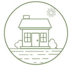
Kylien yhteiset tilat -hanke

Hankkeen yksi tärkeä painopiste on, että kyläläiset pääsevät suunnittelemaan yhdessä Oma kylätaide -tapahtumaan yhteyteen oman kylätaidenäyttelyn, jonne kyläläiset voivat tuoda kylätalolle tai muulle vastaaville yhteisille sisätiloille esille omia tärkeiksi kokemiaan taide-esineitä. Teos voi olla pieni patsas, käsityö, lahjaksi saatu taulu, esine tai jonkin muu merkityksellinen esine tai kuva. Taidenäyttelyn suunnittelussa ja pystyttämisessä auttaa hankkeen kylätaidekoordinaattori. Jokainen taidenäyttely tulee olemaan uniikki ja kyläläisten itsensä näköinen. Taidenäyttelyt saavat toteutukseltaan olla luovan vapaita.