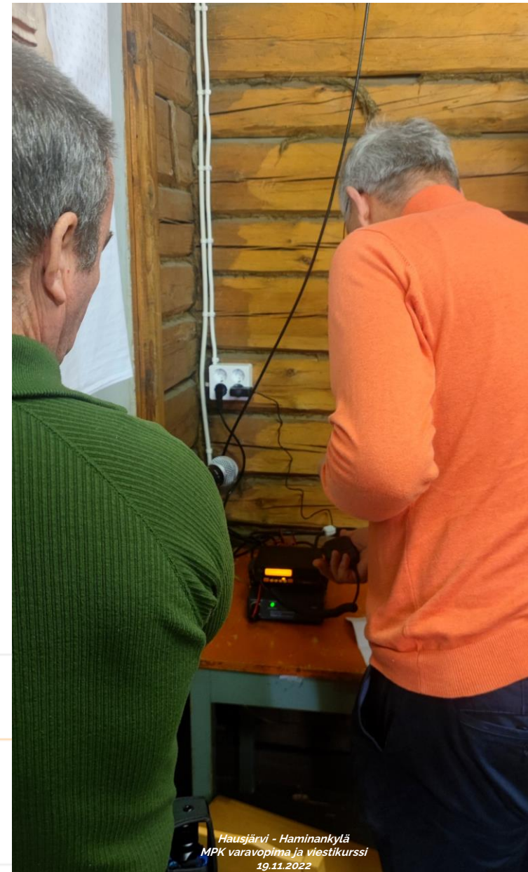
Hausjärvi - Haminankylä MPK varavopima ja viestikurssi 19.11.2022