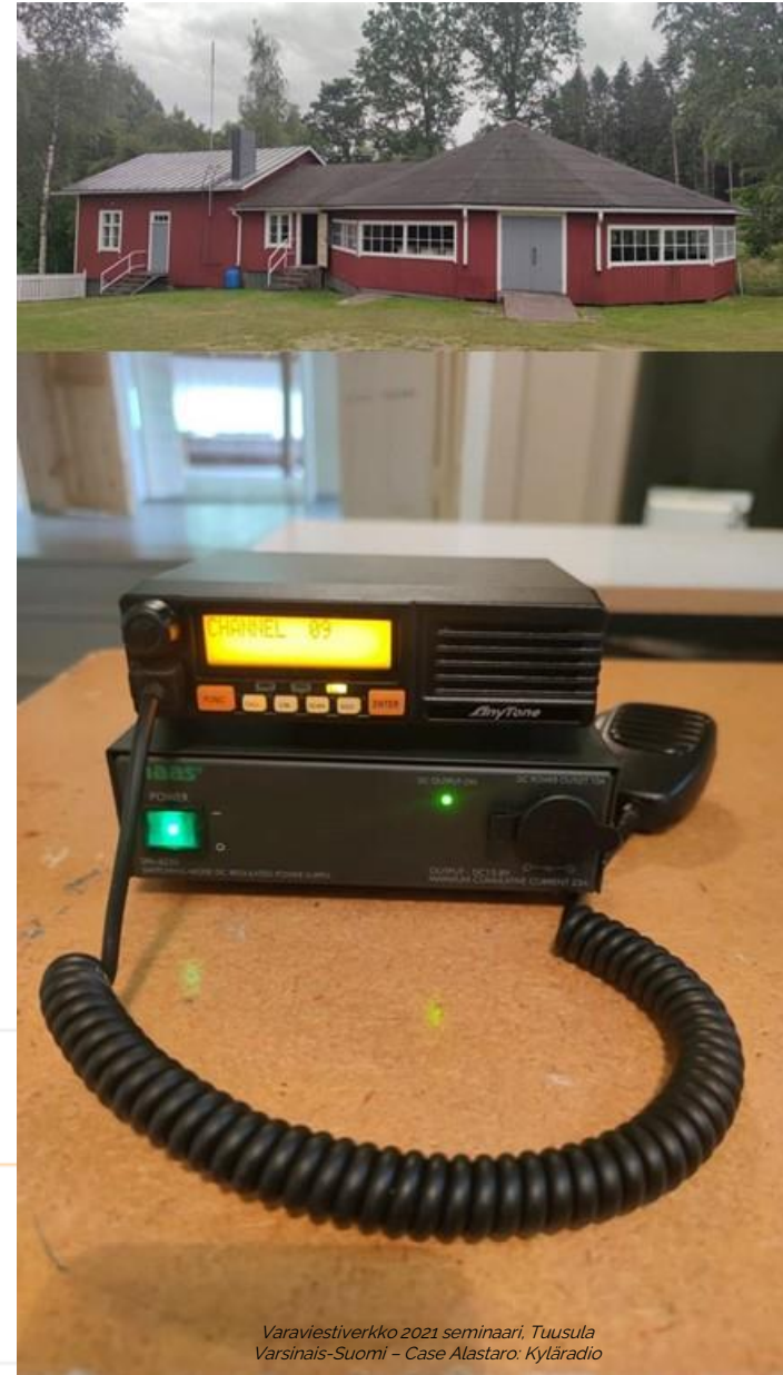
Varaviestiverkko 2021 seminaari, Tuusula Varsinais-Suomi – Case Alastaro: Kyläradio