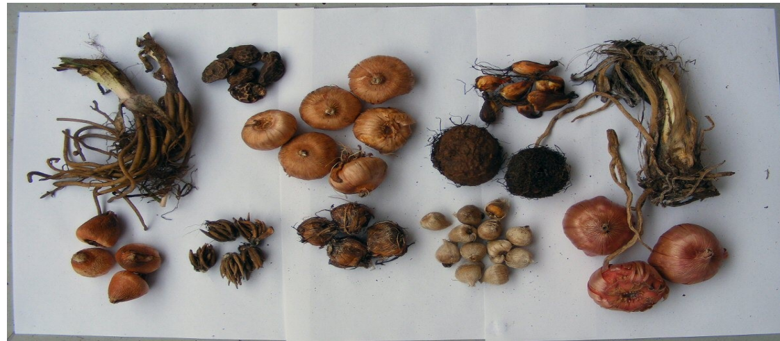
Ylärivissä soihtuliljan, kruunuvuokon, tarhamiekkaliljan, tiikerikukan, sinisarjan ja begonian mukuloita