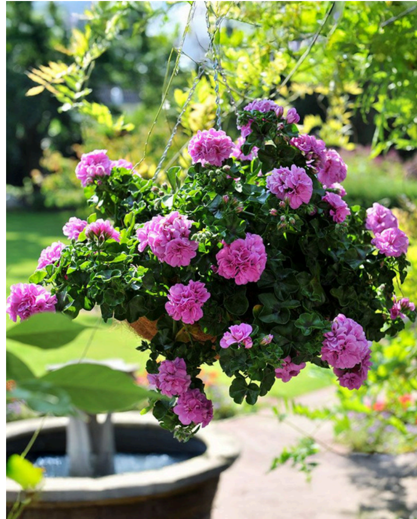
KERRANNAISKUKKAINEN 'ATLANTIC LAVENDER'