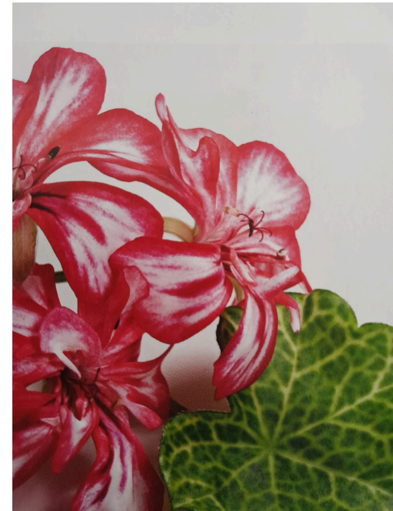
'CROCKETTA' - RIIPPAPELARGONILLA ON KAUNISKUVIOISET TERÄLEHDET JA UPEA MOSAIIKKIKUVIOINTI LEHDISSÄ