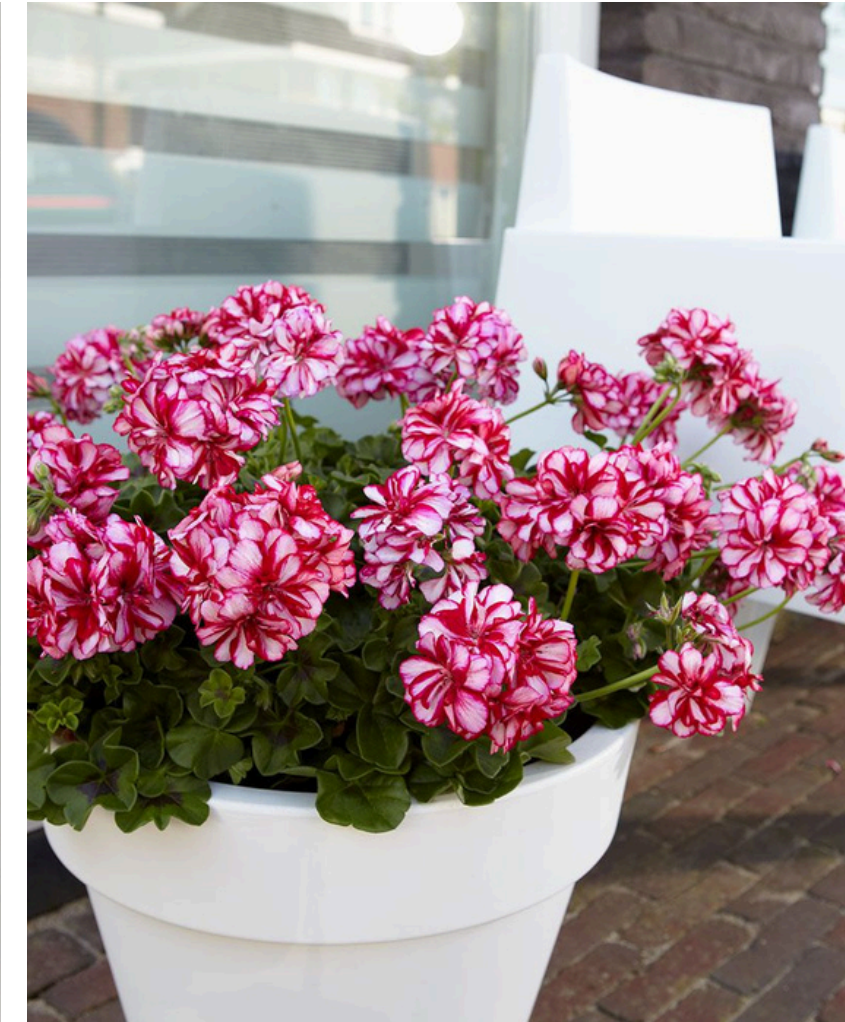
KAUNIIN KIRJAVA KERRANNAISKUKKAINEN 'NIXE'