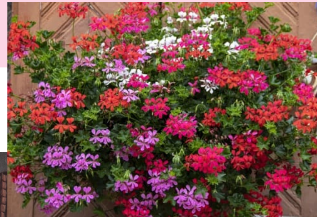
YKSINKERTAISKUKKAINEN 'CASCADE'- LAJIKE KUKKII HYVIN RUNSAASTI

Kuten kotipelargoneilla myös riippapelargoneilla on lehdissään hevosenkengänmuotoinen vyöhyke. Joillakin lajikkeilla on kaksiväriset tai kirjavat lehdet.