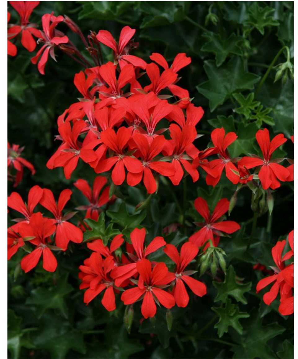
LOISTAVAN PUNAINEN 'DECORA ROOD'