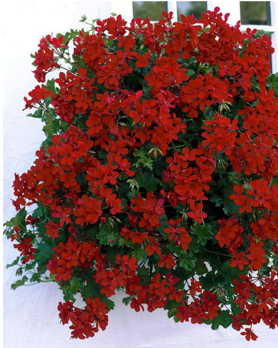
UPEASTI LOISTOSSAAN 'CASCADE RED'

Riippapapelargonit sopivat rennon kasvutapansa vuoksi upeasti ampeleihin ja laatikkoistutuksiin, joissa versot saavat riippua vapaasti. Yksinkertaiskukkaiset lajikkeet ovat hyvin runsaskukkaisia, etuna on myös se, ettei niitä tarvitse nyppiä, sillä kuihtuneet kukat varisevat itsestään eivätkä rumenna kasvia.