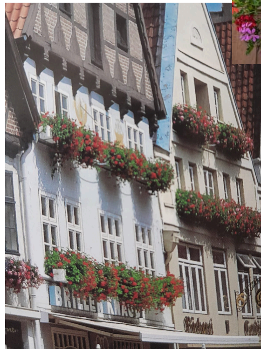
RIIPPAPELARGONEJA KUKKALAATIKOISSA SAKSASSA LÜNEBURGISSA