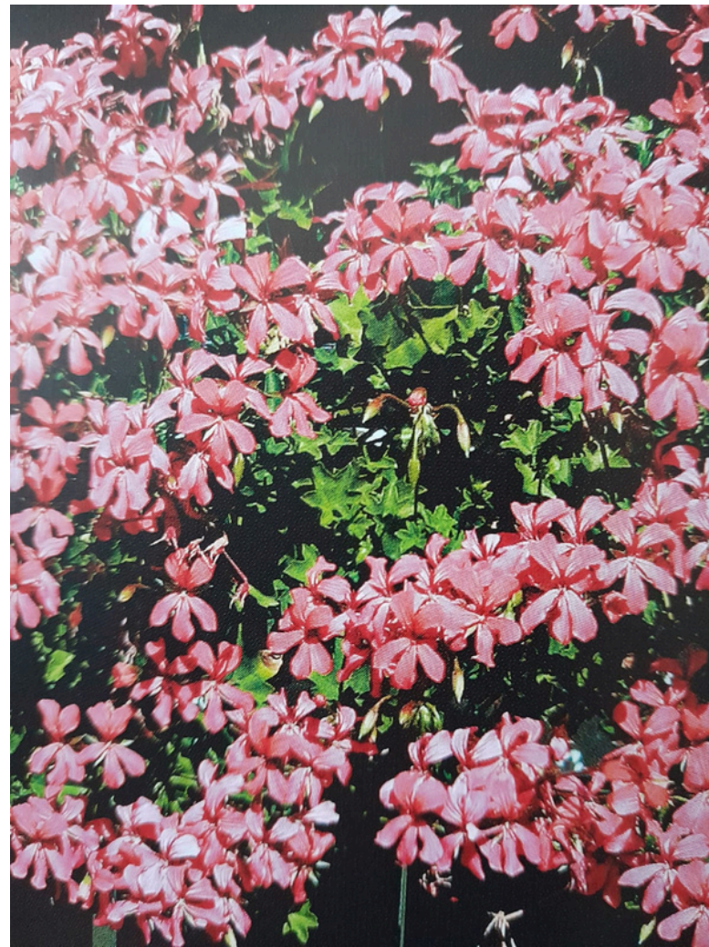
CASCADE-LAJIKKEET OVAT SUOSITTUJA ETELÄISESSÄ EUROOPASSA, JOSSA NIILLÄ KORISTELLAAN TALOJEN JULKISIVUJA

Riippapelargonien kukat voivat olla yksinkertaisia, puolikerrannaisia tai kerrannaisia. Kukat kestävät melko hyvin säiden vaihteluja, eivätkä mene sadekuuron vuoksi pilalle. Kukkien terälehdet tippuilevat kukinnan jälkeen, niinpä joku voi pitää riippapelargoneja roskaavina. Kukkien väri vaihtelee valkoisesta roosaan, violetista purppuraan ja punaiseen, jopa miltei mustaan. Melkein kaikilla lajikkeilla on kukissa viininpunaisia täpliä tai terälehdissä sulkamainen kuvio niin kuin esivanhemmalla P. Peltatumilla. Riippapelargoneja on kutsuttu myös murattipelargoneiksi. Nämä ovat helppohoitoisia, isokokoiset kasvit kuluttavat tosin paljon vettä, mutta tuulensuojainen ja aurinkoinen paikka takaavat komean kukinnan ja rehevän kasvun.