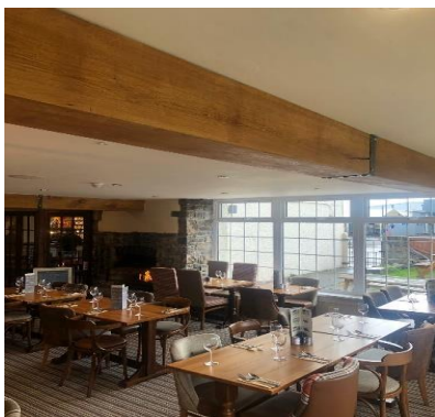
ravintola Schiffbörse, Hampuri

20.00 Tervetuloilaisuus , hotellin aamiaishuoneessa.