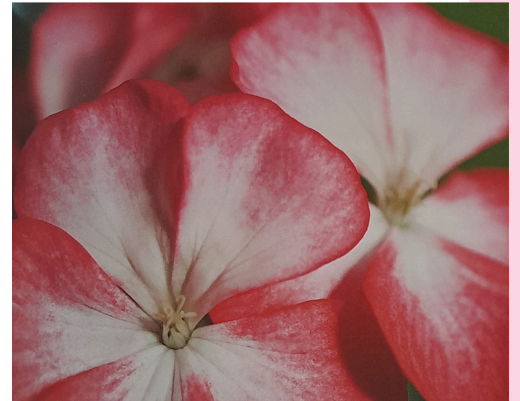
MINIATYYRI 'BALLERINALLA' ON UPEAN MAALAUKSELLISET KUKAT