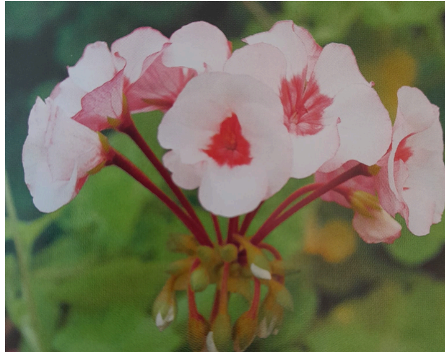
'SCOTTOW STAR' KÄÄPIÖPELARGONI

Kääpiö- ja miniatyyripelargoneja on tuhatkunta lajiketta. Mitä moninaisimmat sävyt ovat kukkien väreissä edustettuina, myös normaalikokoisilla lajikkeilla harvinaiset värit kuin hyvin tumma sametinpunainen ja oranssi. Terälehdet voivat olla myös kaksiväriset, niissä voi olla erivärinen tyvi tai läiskiä. Useilla lajikkeilla on koristeellinen lähes mustanvihreä lehdistö, joka on harvinainen muissa pelargoniryhmissä.