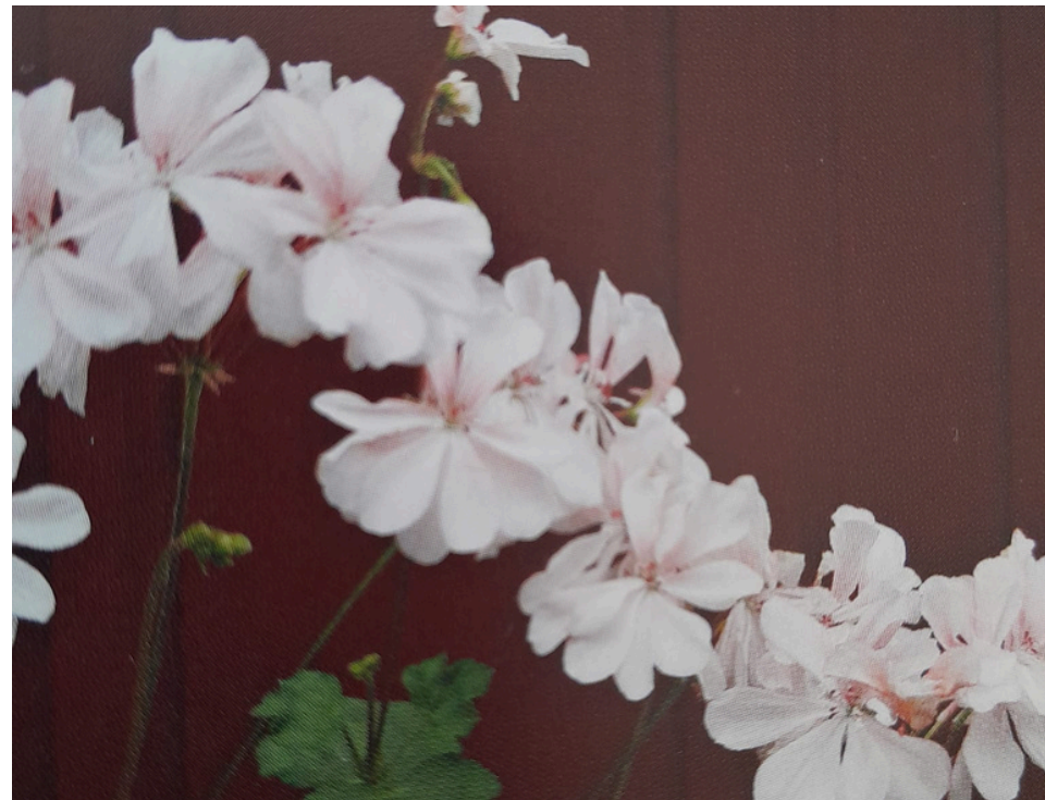
'HONEYWOOD SUZANNE' KÄÄPIÖPELARGONI