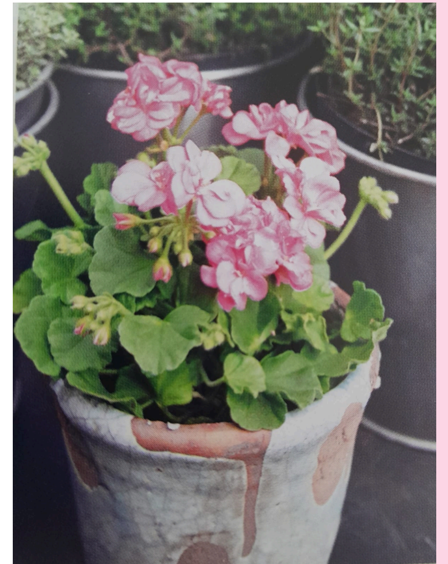
'LITTLE LADY ROSA' KÄÄPIÖPELARGONI