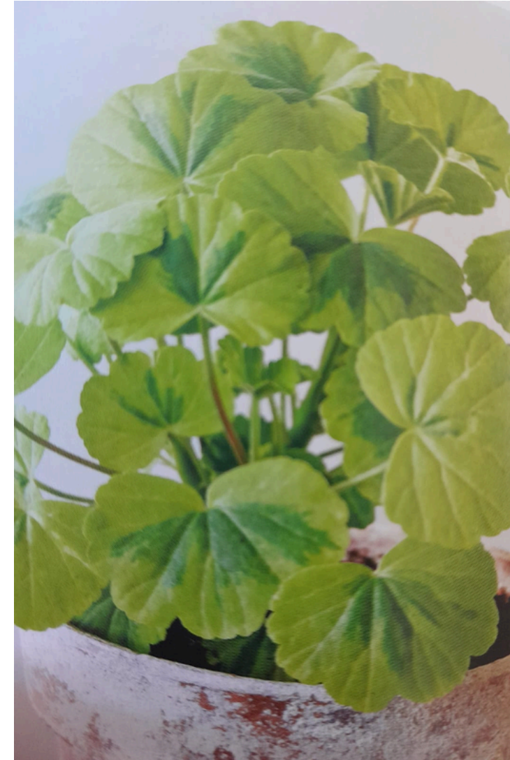
'GREENGOLD KLEINER LIEBLING' LAJIKKEELLA ON ERIKOISEN VÄRISET LEHDET