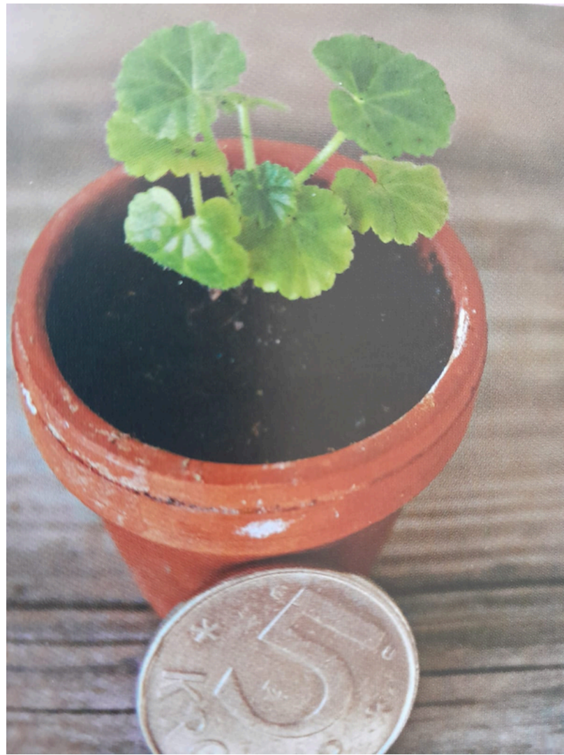
'MIKRO-MINIATYYRIPELARGONI 'SALMON TINY TIM' LAJIKKEELLA ON LOHENPUNAISET KUKAT'

Miniatyyripelargoneja kasvatetaan kuten muitakin pelargoneja, mutta ne ovat talvisin tavallista herkempiä kosteudelle. Nämä voivat myös saada herkemmin hometta matalan ja tuuhean kasvun vuoksi. Vaativin kasvatettava on mikrominiatyyripelargoni, sillä sille sopiva ruukku on korkeintaan kuuden sentin levyinen. Näiden pikkuruisten aarteiden hankkiminen on hyvin vaikeaa ja onnistuu vain asianharrastajien välityksellä ja lajikkeita ei ole paljonkaan.