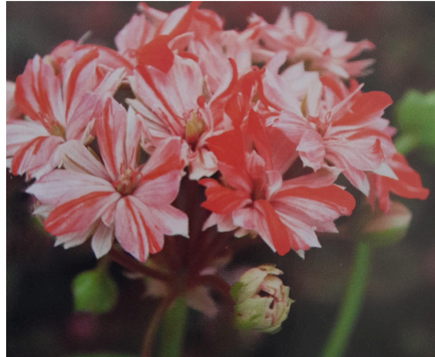
'SWISS STAR' KÄÄPIÖPELARGONI