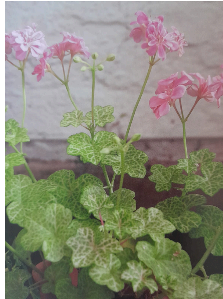
'LACED SUGAR BABY' KUKKII VAALEANROOSAN VÄRISIN KUKIN JA SILLÄ ON ERIKOISET VAALEANVIHREÄT, MOSAIKKIKUVIOISET LEHDET