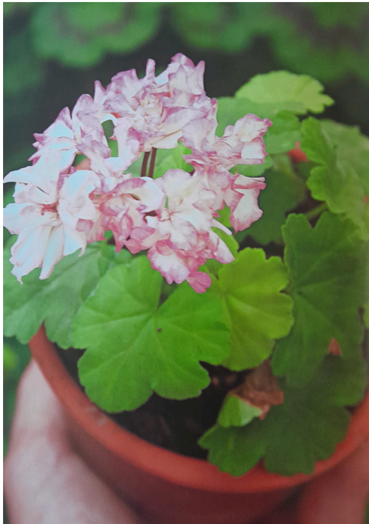
'TAFFETY' MINIATYYRILAJIKKEELLA ON KÄHÄRÄT TERÄLEHDET

Näiden pienoispelargonien sievä ja pikkuruinen kasvutapa tekee niistä haluttuja keräilykasveja, sillä niitä mahtuu pieneenkin tilaan paljon. Kasvit kasvatetaan hyvin pienissä ruukuissa, jotta ne säilyttävät miniatyyriominaisuutensa. Mullan tilavuus vaikuttaa kasvin kokoon, eivät ainoastaan perityt ominaisuudet. Pienet kasvit ovat hyvin herkkiä liikakastelulle tai kuivumiselle, joten näitä on hankalampi kasvattaa. Miniatyyrilajikkeita on yksinkertais-, puolikerrannais- ja kerrannaiskukkaisia sekä tähti- ja koristelehtipelargoneja.