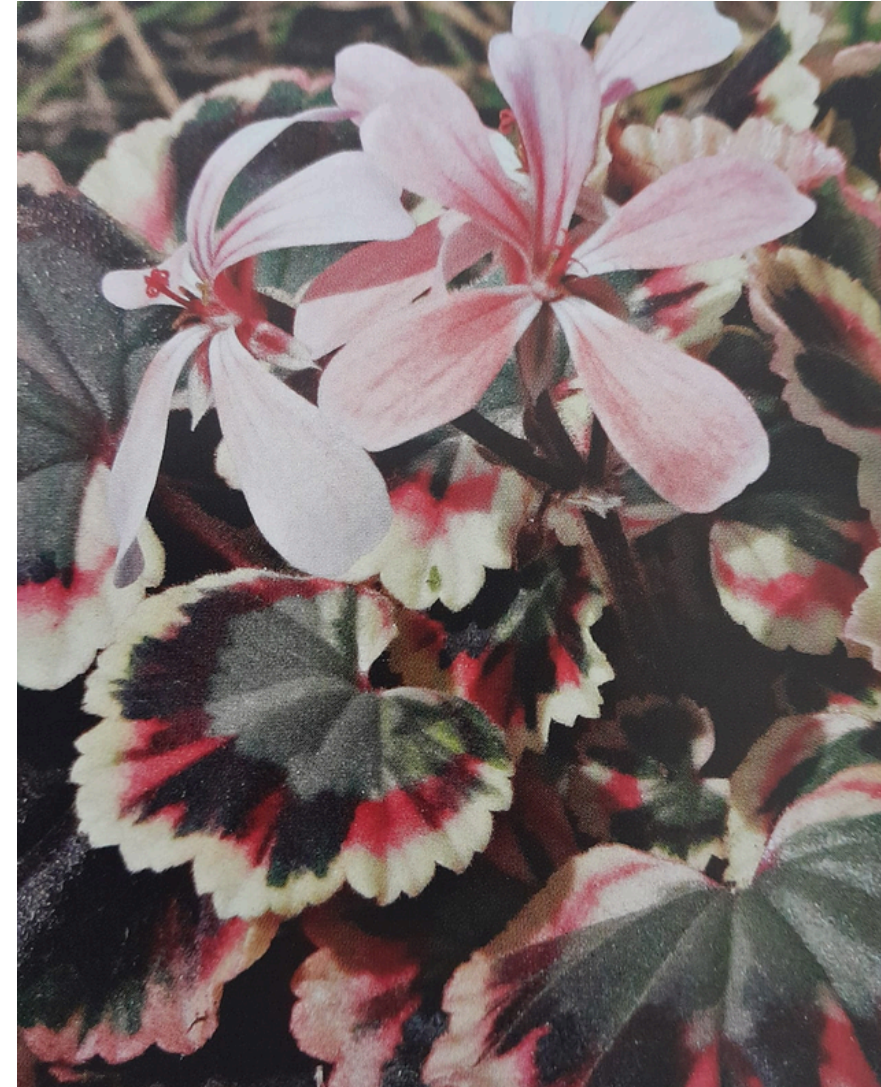
'EXCALIBUR' ON KIRJAVALEHTINEN MINIATYYRI