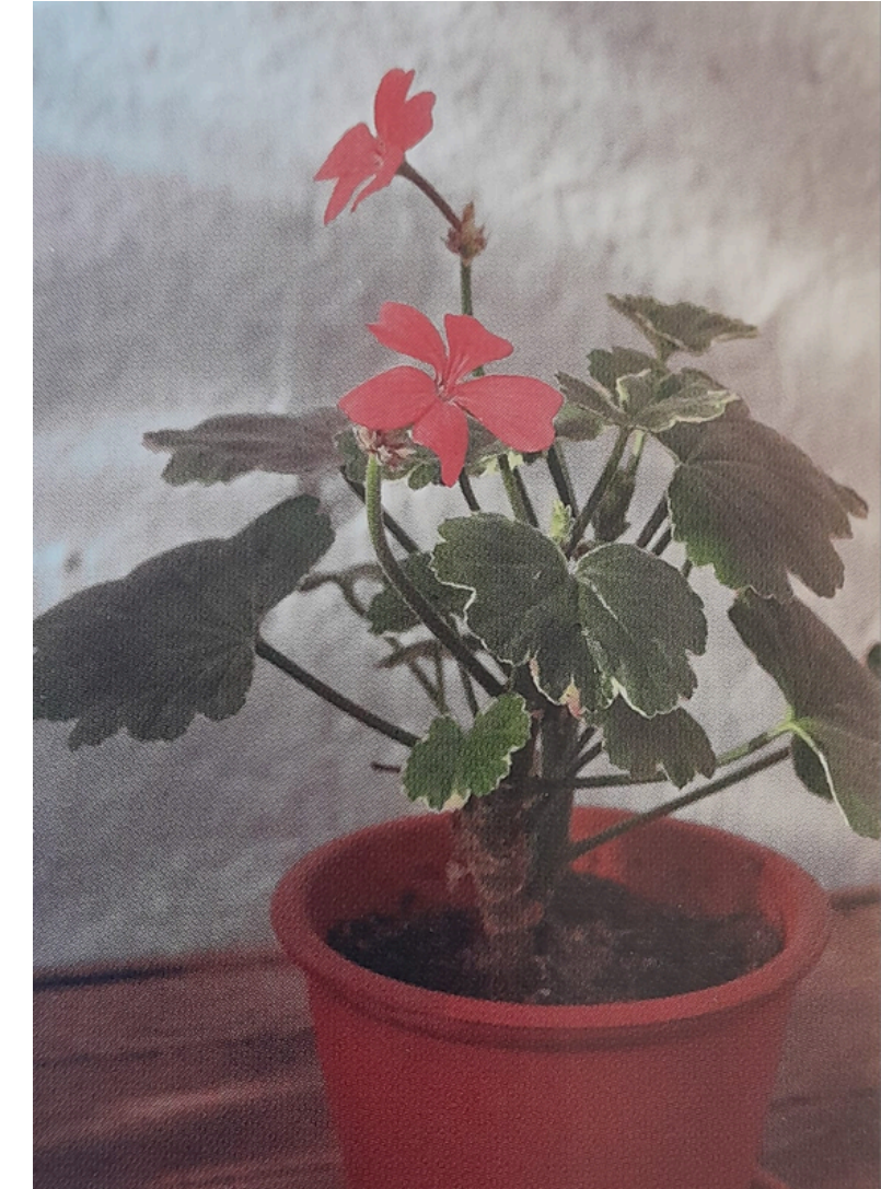
'GREEN SPRITE' LAJIKKEELLA ON YKSINKERTAISET KUKAT JA KESKIVIHREÄT LEHDET, JOITA KIERTÄÄ OHUT VAALEA REUNUS