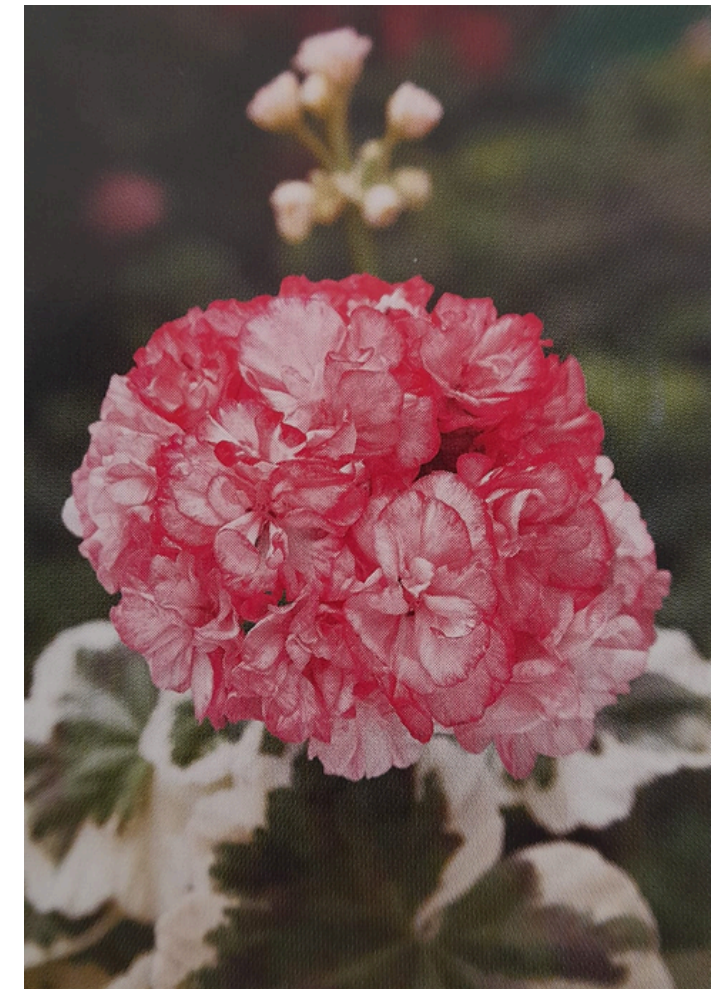
'CHELSEA DIANE' KÄÄPIÖPELARGONI