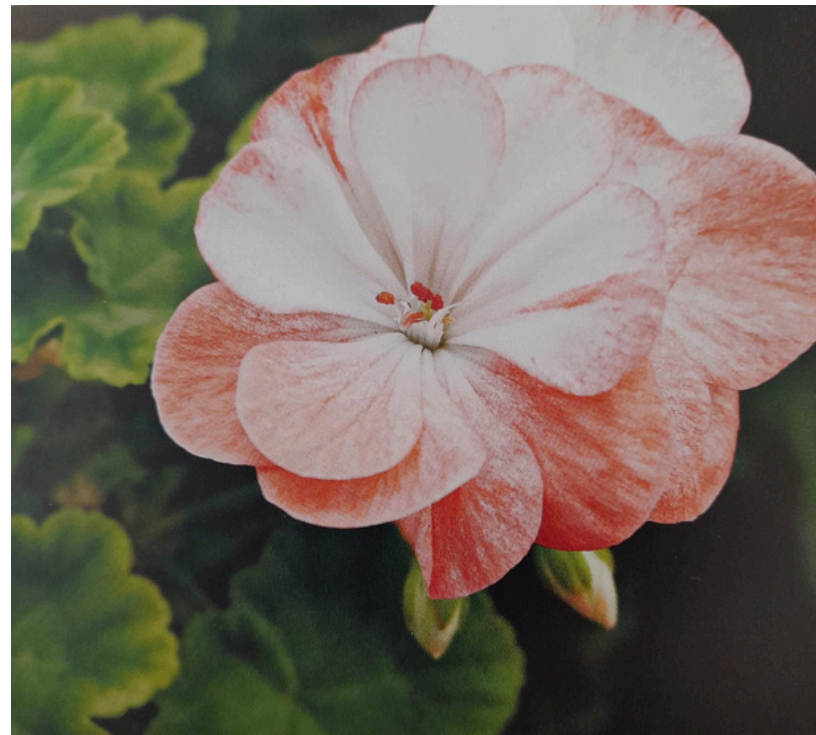
'SWAINHAM MELLOW YELLOW' KÄÄPIÖPELARGONI

Nämä kaikki ovat kotipelargonien alaryhmä, yhteistä näille lajeille on hillittykasvuisuus. Ryhmään kuuluu yksinkertais-, puolikerrannais- ja kerrannaiskukkaisia muotoja. Näissä on myös ruusunnuppu-, tähti-, koristelehti-, kaktus-, sormi-, linnunmuna- ja munankuoripelargoneja. Kasvien pieni koko tekee näistä haluttuja keräilykohteita, kasveja mahtuu samaan tilaan enemmän kuin tavallisen kokoisia. Kääpiöpelargoneilla on myös tiiviimpi kasvutapa, lopulliseen kokoon vaikuttavat niin geenit kuin viljelyolot. Miniatyyri voi kasvaa samankokoiseksi kuin pienikokoinen kääpiöpelargoni. Kasveja pidetään pienissä ruukuissa, jotta kasvit pysyisivät mahdollisimman pieninä. Raja tavallisten pelargonien, kääpiömuotojen ja miniatyyrien välillä on usein häilyvä, koska ruukun koko ja kasvien hoito vaikuttaa niin suuresti pelargonien kokoon.