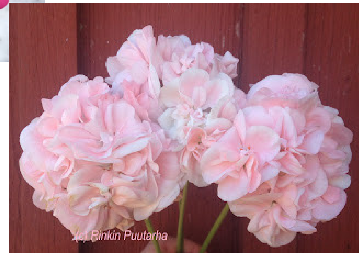
'HELMI-ELISABETH' ULVILASTA 1900-LUVUN ALUSTA