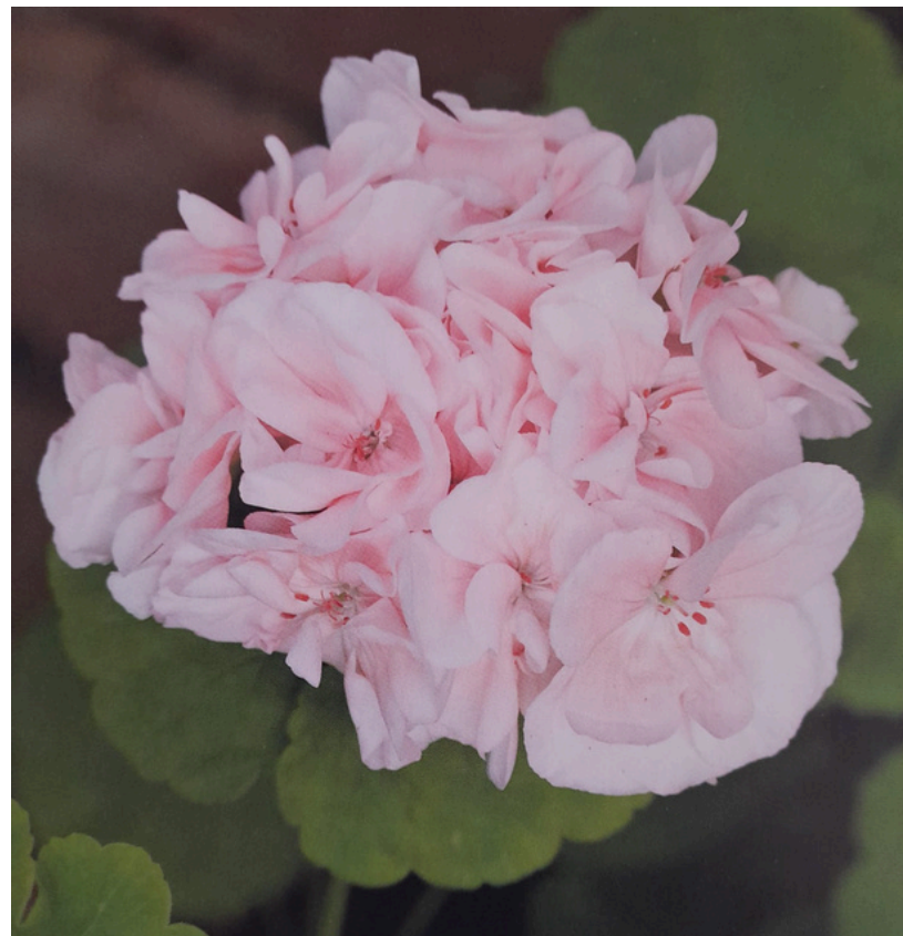
KUVAN PELARGONI, LEMPINIMELTÄÄN 'PORI', KUKKA MUISTUTTAA SUURESTI RUOTSALAISTA 'MÅRBACKAA'

Hyvin monien nyt "suomalaistuneiden" pelargonien kaukainen alkuperä on kulkeutunut Ruotsista meille, esim. 1700-luvun lopulla ensin Länsi-Suomeen, jolloin Suomi oli osa Ruotsin valtakuntaa. Kun Suomesta tuli osa Venäjää Haminan rauhassa v. 1809, sen jälkeen myös Venäjältä kulkeutui ensin säätyläiskoteihin Karjalaan ja Itä-Suomeen paljon uusia pelargonilajikkeita. Ruotsin ja Venäjän hoveihin pelargonit löysivät tiensä Hollannista, Englannista, Ranskasta ja Saksasta. Joten monien suomalaisten pelargonien kaukainen alkuperä on näistä maista kotoisin. Vanhojen pelargonien alkuperäislajike on usein tuntematon! Pelargonien laajamittainen monivuotinen kasvatusta juontaa Suomessa juurensa 1800-luvun loppupuolelle ja näistä tunnetuista lajikkeista puhutaan vanhoina suomalaisina pelargoneina. Kyllä 150-vuotinen pelargonilajike on jo vanha!