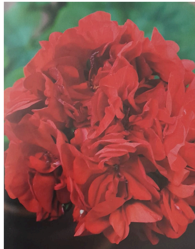
KOTIPELARGONI 'SAIMA' VOIMAKKAASTI KERROTUT, KIRKKAANPUNAISET KUKAT JA SAMETTIMAISET LEHDET