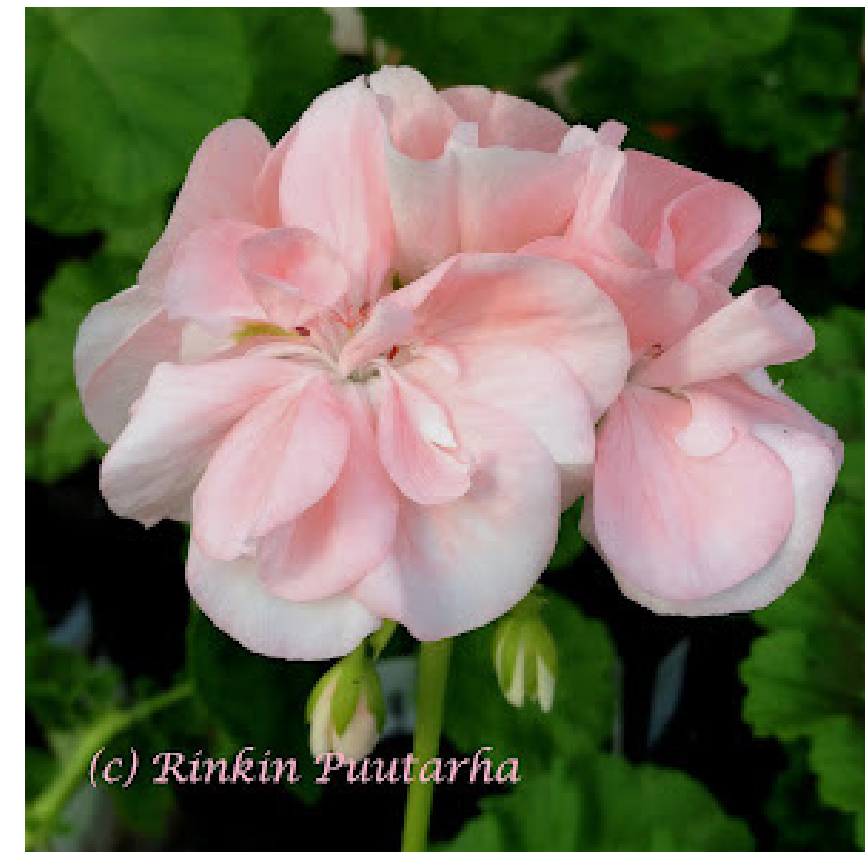
'REIJOLAN AINO' ETELÄ-KARJALASTA