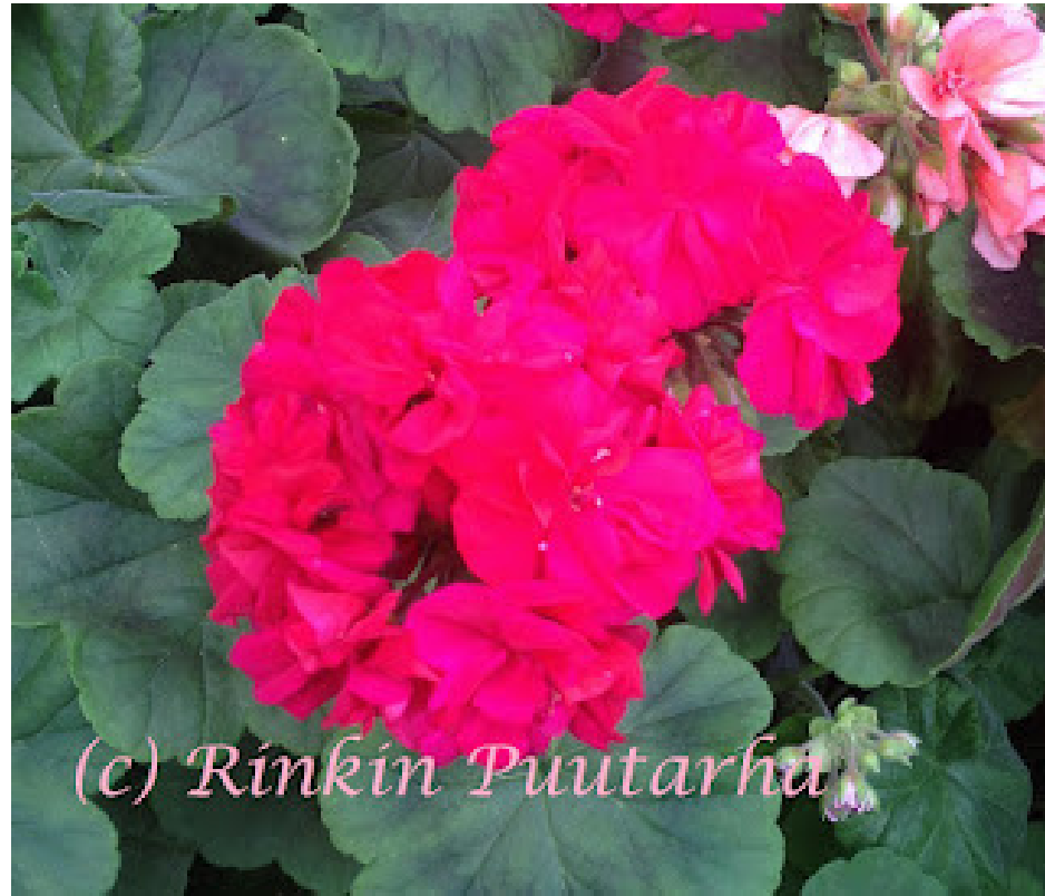
'KORTON HILDA' ETELÄ-KARJALASTA