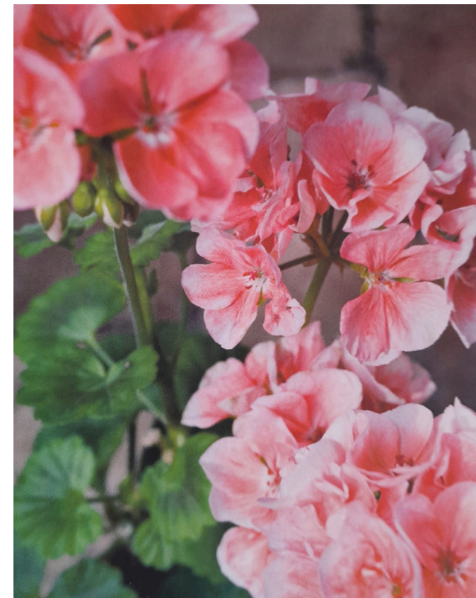
LOHENPUNAINEN 'HAUSKA' NIMINEN PELARGONI ON SAANUT NIMENSÄ OMISTAJANSA HAUSKA- NIMISESTÄ MÖKISTÄ VILJAKKALASTA.