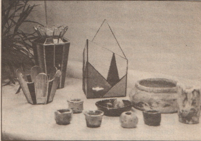
Pyylammen kerhohuoneella oli esillä tasokkaita harrastajataiteilijoiden töitä.

Kevätnäyttelyn keskellä kannettiin murhetta Pyylammen kerhohuoneen