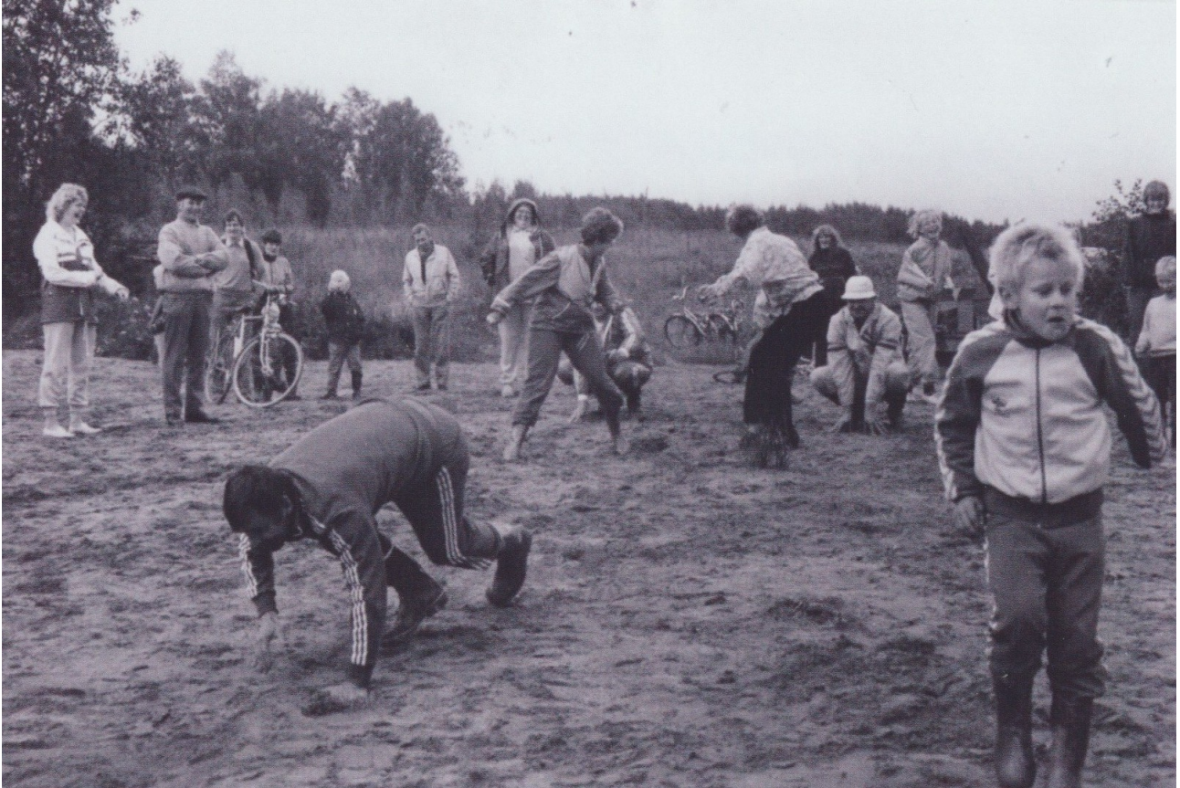
Pyylammin viestijuoksukilpailut käynnissä 1980-luvun lopulla leikkikentän kohdalla.