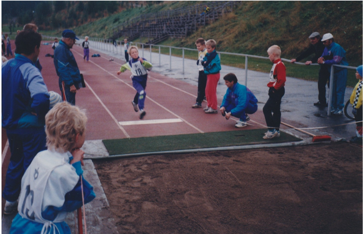
Pyylammin nappulaolympialaiset käynnissä Ahmolla v.1991.