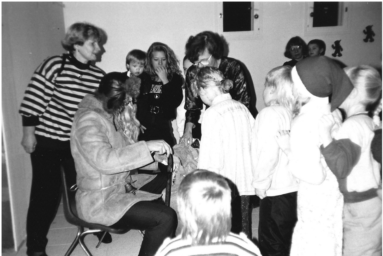
Pikkujoulu Pyylammin kerhuhuoneella 1980-luvun loppupuolella.