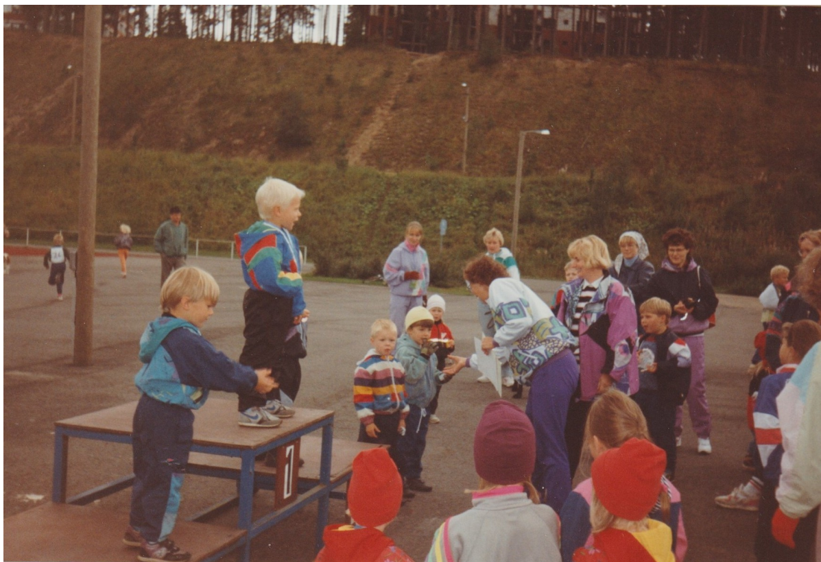
Nappulaolympialaisten palkintojenjakajaiset menossa Ahmolla.