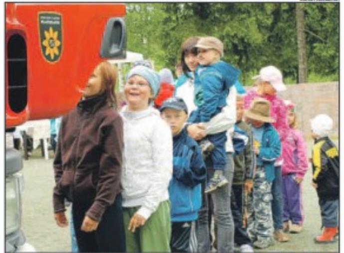
Paloauton tulo Pyyllämmän alapuiston hiekkakentälle oli monelle kesäjuhlan kohokohta.

"Haluaisin tietää milta tuntuu istua kyydissä", kuulsi lapsistaan. Molemmiin puoliin auton ovia muodostui nopeasti naurava ja innostunut jono.