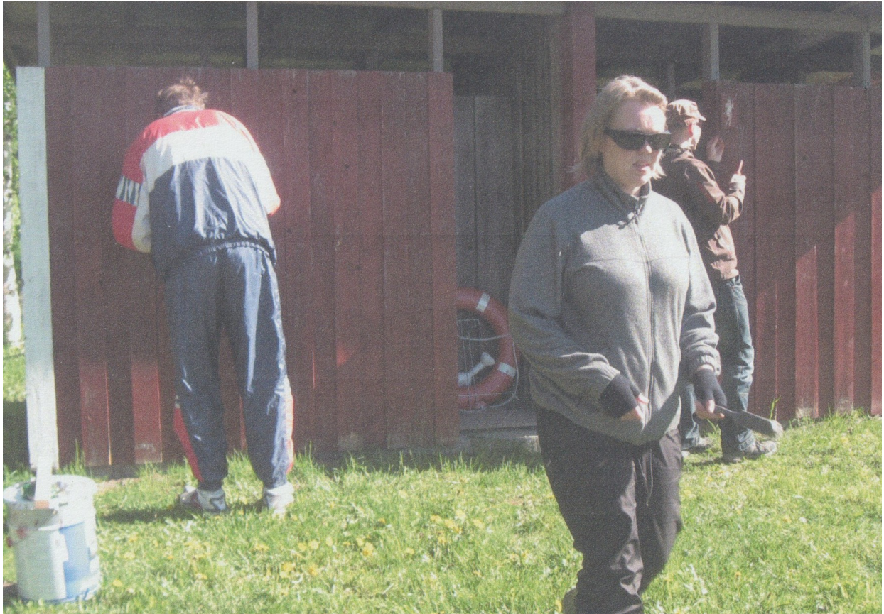
Panninniemen uimakopin maalaustalkoot käynnissä v.2012.