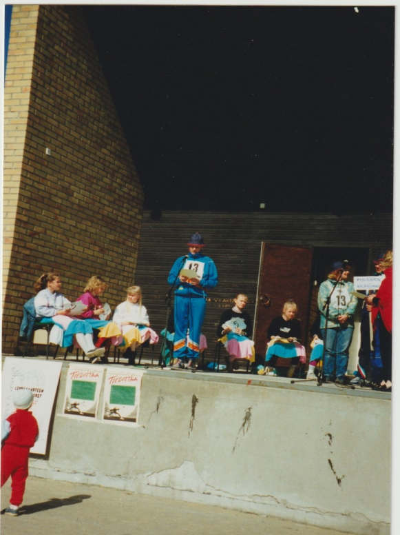
Pyylammin kylätoimikunnan joukkue osallistui numerolla 13 eri paikoilla toteutettuihin leikkimielisiin kilpailulajeihin 1980-luvun lopun eräässä tapahtumassa.