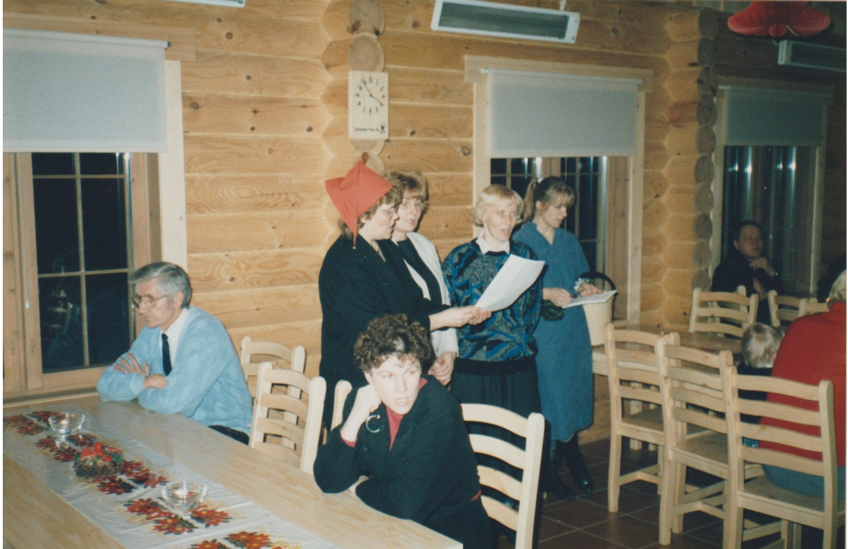
Kylätoimikunnan pikkujoulujuhla käynnissä Ystävyyden Majalla 1990 -luvun alkuvuosina.