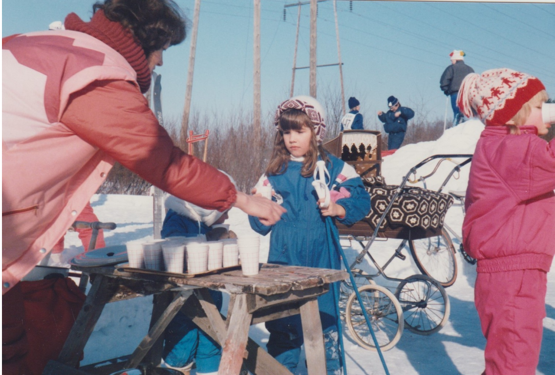
Mehu maistui lapsille Pyylammin hiihtokilpailuissa 1987.