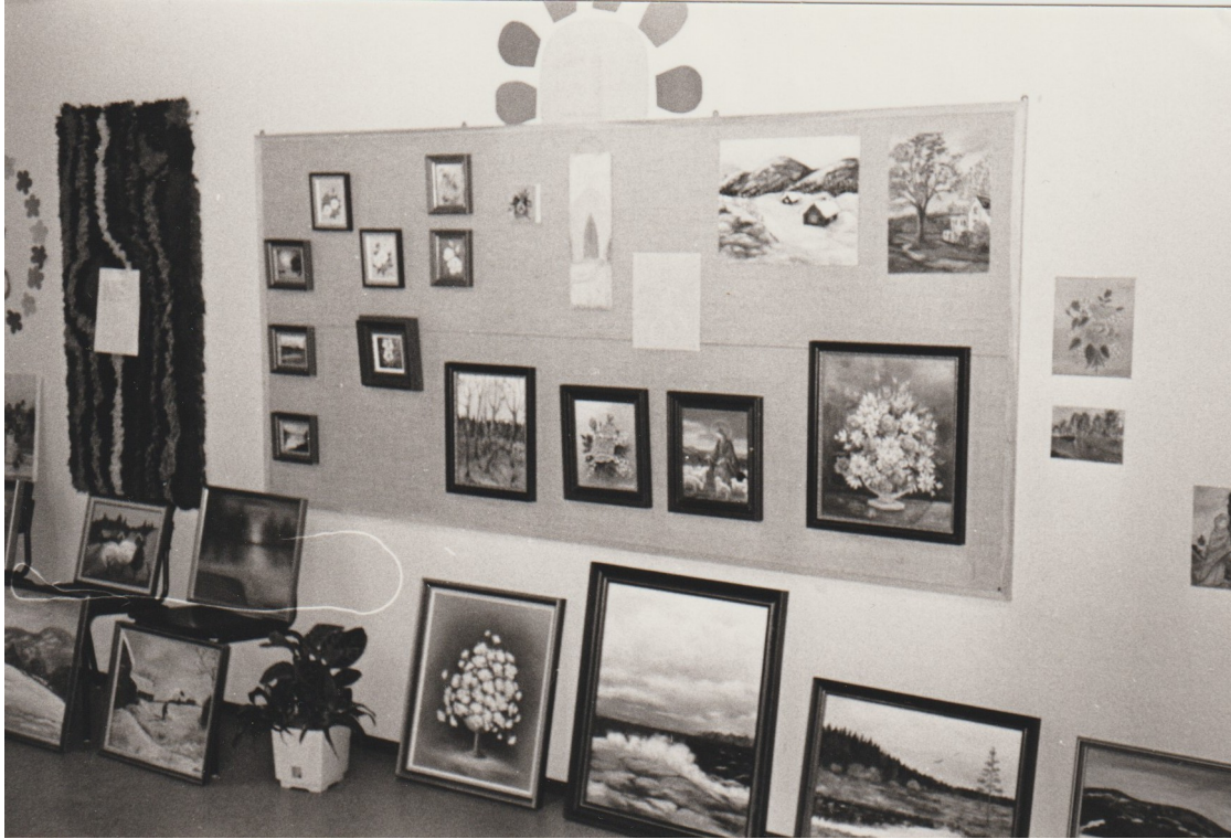
Pyylammin taidepiiriläisten töiden näyttely kerhuhuoneella.