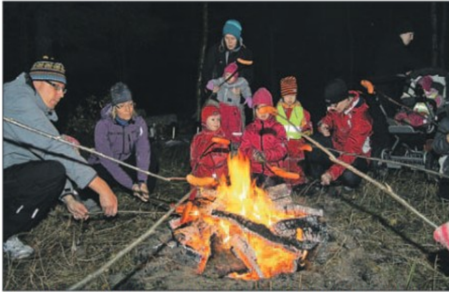
Pyylammin ja Panninniemen asukkaat kokoontuivat perjantaina nuotion ääreen kyläyhdistyksen järjestämässä tapahtumassa.

"Kyläyhdistys toteuttaa kylän yhteistä tärkeitä asioita. 70-luvulla täällä oli aktiivinen kyläyhdistys, jonka toi-