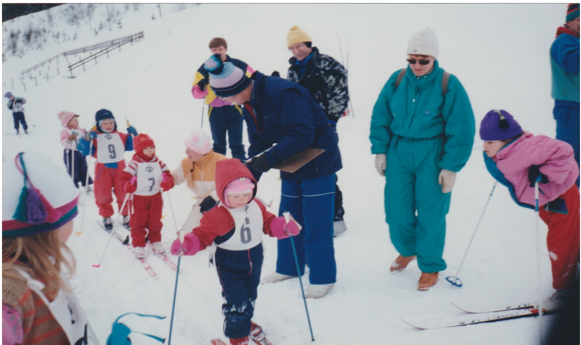
Lasten hiihtokilpailut Ahmolla.