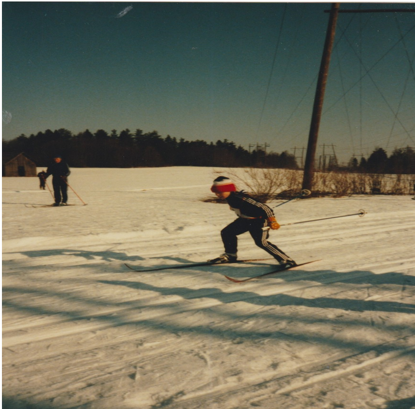
Hiihtokilpailut Pyylammella v.1987.