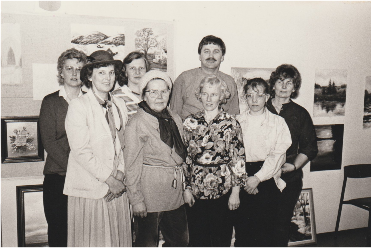
Kuvassa Pyylammin kuvataidepiiriläisiä kerhohuoneella.