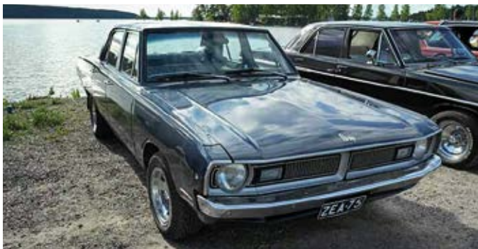
Dartti siinä kunnossa kun se nykyään on. Ei suuria ulkoisia muutoksia. (Lahti cruisingista vesilahden rannalla)