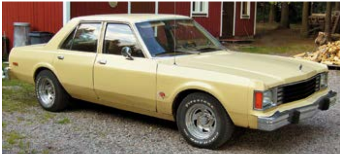
Ensijenkki Dodge Aspen

Kaikki alkoi, kun kaverini sai minut ylipuhuttua ostamaan amerikkalaisen "kesäauton" noin 13 vuotta sitten. Ensijenkki oli Dodge Aspen 3,7l kuutoskoneella automaattivaihteistolla. Sillä ajelin 1,5 kesää, kunnes sain kaveriltani tietää edullisesta 1970 vuosimallin Dodge dartista sekin kuutoskoneinen ja tietysti automaattivaihteinen. Varsinainen tyypimerkintä on Dodge dart 4d custom. Auto oli lähes tulkoon valmiiksi kunnostettu pieniä puutteita lukuunottamatta. Latiamatot puuttui ja jarrut joutui käymään läpi.