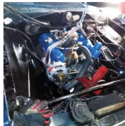
V8:n paikalleen asennus

Oli muistaakseni heinäkuun puolivälin paikkeilla, kun sain auton vietyä omaan talliin. Auto ei ollut vielä täysin katsastus kunnossa, joten jorkavuotiseen forssan picknickiin mentiin ns. puuhakilvillä eli väliaikaisilla rekisterikilvillä. Talven aikana tehtiin lopulliset säädöt ja osien vaihdot, joilla parannettiin moottorin toimivuutta. Seuraavan kesän alussa heti katsastukseen, jossa jouduin tekemään muutoskatsastuksen moottorin vaihdon vuoksi.