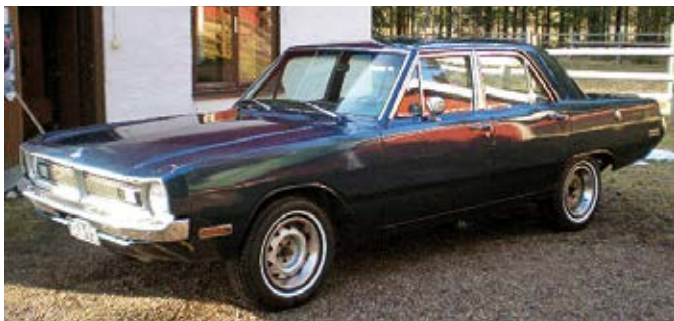
Dartti siinä kunnossa, kun se minulle tuli

No Aspen meni myyntiin ja välittömästi hakemaan darttia. Pari päivää meni ja dartti oli kotipihalla, josta vein sen silloiseen "talliin" joka oli puolikas ratsastusmaneesi. Kylmähän siellä oli, mut en talvella mitään autolle tehnyt. Ilmat kun alkoi lämpenemään niin aloin laittamaan mattoja lattiaan ja jo aikaisemmin hommaamiani jarrun osia asentamaan paikalleen. Se alkukesä meni auton kunnostamiseen ajokuntoon. Eipä siinä ihmeitä tarvinnut tehdä, kun jo sain auton katsastettua. Auto pysyi tuossa kuosissa noin seitsemän vuotta. Koko ajan oli mielessäni V8 moottori ns. täysmoottori, mutta en millään olisi halunnut tuhota tuota alkuperäisyyttä tuosta autosta. Ei vaan varat riittäneet ostaa toista autoa, jossa olisi tuo kasin kone.