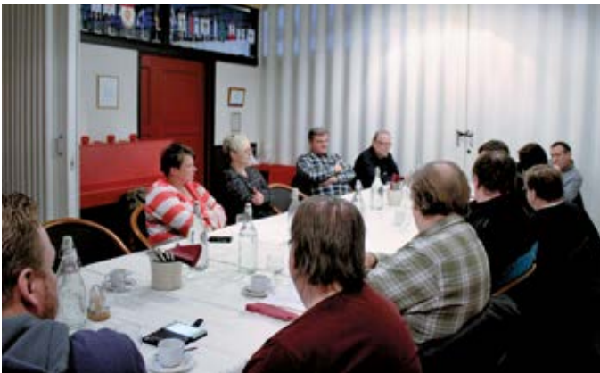
Luottamushenkilöiden tapaamisessa ravintola Harlekiinissa jutelimme kilpailukykykysymyksistä.