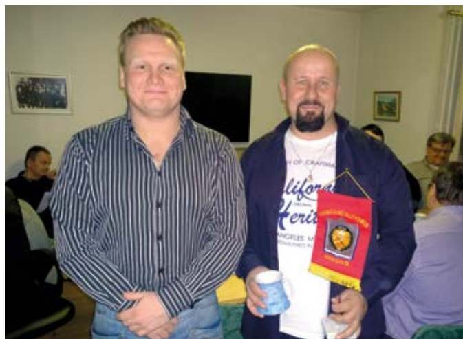
Uusi puheenjohtaja ojentaa viirin poistuvalla puheenjohtajalle.