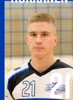
L | s. 2003 | 181 cm