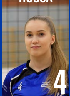
KT | s. 2003 | 176 cm