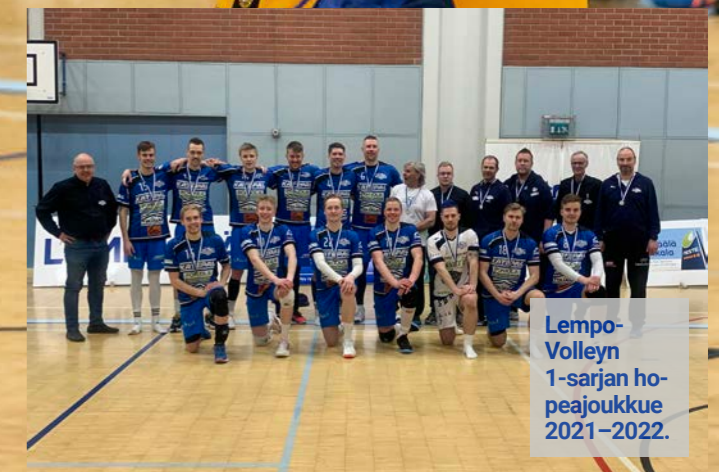
Lempe-Volley 1-sarjan hopeajoukkue 2021–2022.