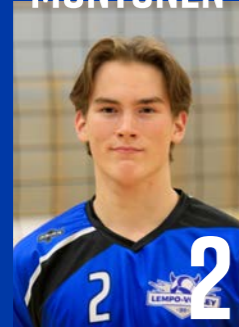
YP | s. 2003 | 190 cm