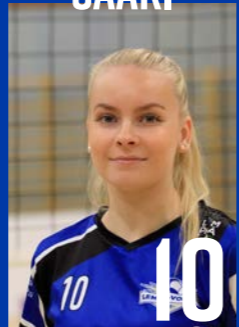
YP | s. 2003 | 172 cm