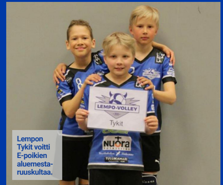
Lempon Tykit voitti E-poikien aluemestaruuskultaa.

Kesällä 2022 alkoi taas uusi beach volley -kausi Hääkiven kentillä ja 1-sarjajoukkueiden rakentaminen. Kevätkokous pidettiin 14.6.2022.