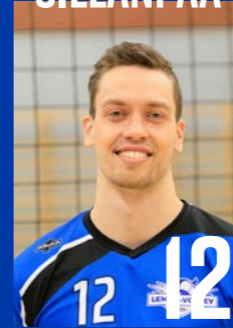
H | s. 1992 | 193 cm