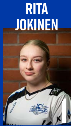
LIB | s. 2004