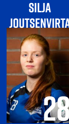
L | s. 2005