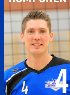
YP | s. 1987 | 194 cm