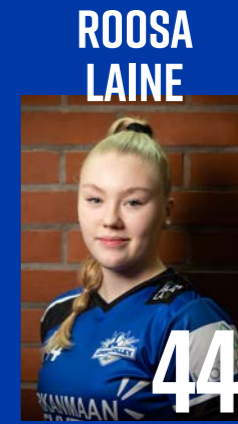
KT | s. 2006