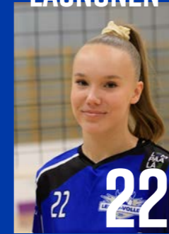
YP | s. 2002 | 170 cm