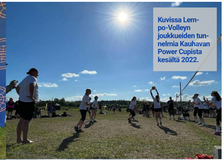
Kuvissa Lembo-Volley joukkueiden tunnelmia Kauhavan Power Cupista kesältä 2022.