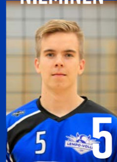
P | s. 2004 | 190 cm