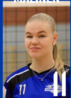
KT | s. 2003 | 183 cm