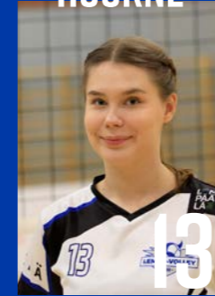
L | s. 1999 | 172 cm