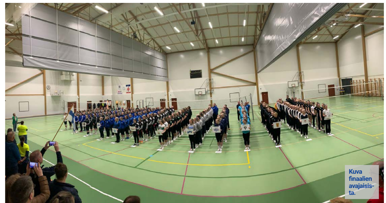
Kuva finaalien avajaisista.