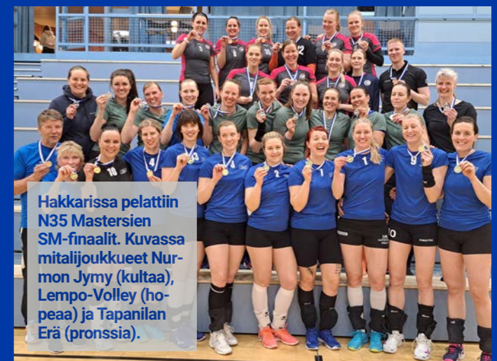
Hakkarissa pelattiin N35 Mastersien SM-finaalit. Kuvassa mitalijoukkueet Nurmon Jymy (kultaa), Lempo-Volley (hopeaa) ja Tapanilan Erä (pronssia).