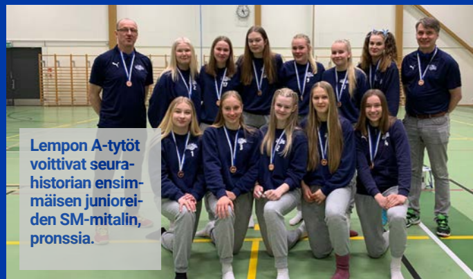
Lempon A-tytöt voittivat seurahistorian ensimmäisen junioreiden SM-mitalin, pronssia.

Huipennuksista puhuttaessa oman mainintansa ansaitsee edustusjoukkueiden kausien päätökset. Miesten 1-sarjajoukkue eteni aina finaaleihin asti.