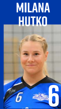
KT | s. 1999