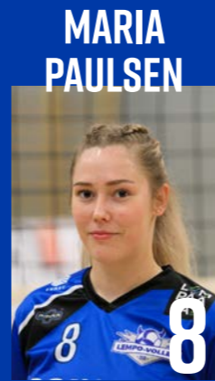
P | s. 2000