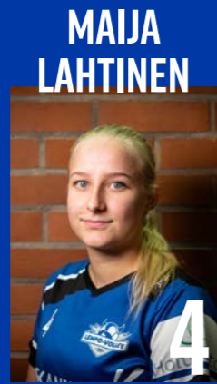
YP | s. 2005