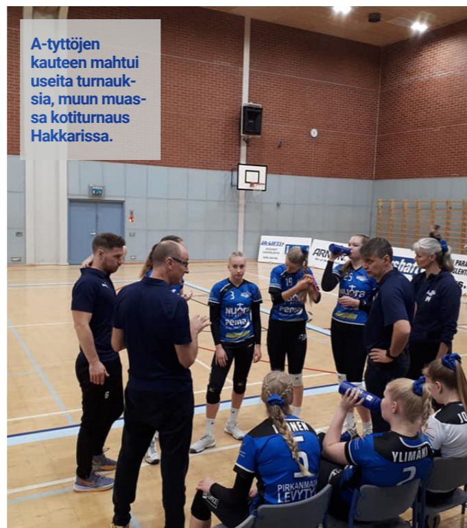
A-tyttöjen kauteen mahtui useita turnauksia, muun muassa kotiturnaus Hakkarissa.

Kausi oli todella pitkä, sillä Lempon naisten 1-sarjan ja A-tyttöjen joukkue aloitti viime kauteen valmistautumisen toukokuussa 2021. Joten SM-mitalin varmistuttua tuli täyteen 12 kuukauden lentopallokausi.