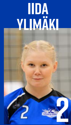
H | s. 2003