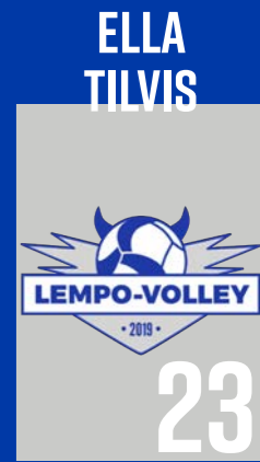
P | s. 2006