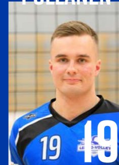
YP | s. 2001 | 187 cm