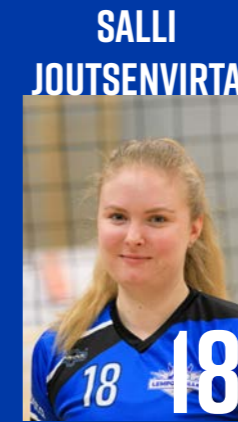
YP | s. 1999