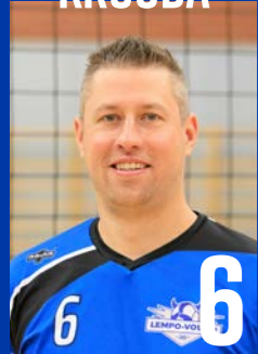
KT | s. 1986 | 200 cm