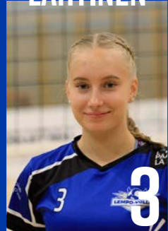
P | s. 2003 | 170 cm