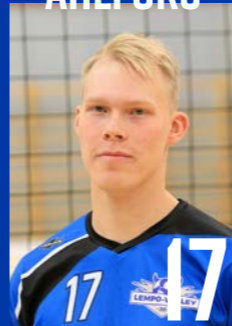
KT | s. 2002 | 191 cm