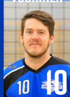
YP | s. 1995 | 190 cm