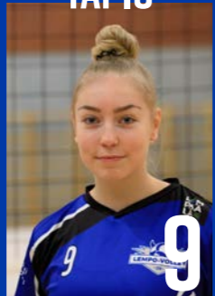
KT | s. 2004 | 182 cm