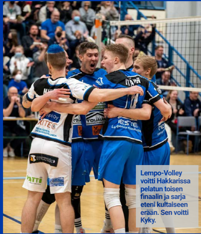
Lempe-Volley voitti Hakkarissa pelatun toisen finaalin ja sarja eteni kultaiseen erään. Sen voitti Kyky.

Molemmissa peleissä voiton vei vierasjoukkue, kun Kyky vei mestaruuden kultaisessa erässä ja cupissa Savo voitti 3–0. Mutta lempääläisyleisö pääsi kokemaan upeaa lentopallohuumaa. Kahteen peliin 970 katsojaa on huikea lukema Lempäälän urheilussa.