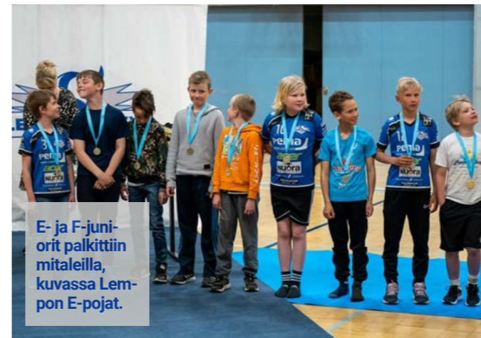
E- ja F-juniorit palkittiin mitaleilla, kuvassa Lempon E-pojat.