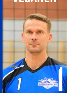
H | s. 1980 | 201 cm