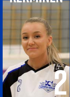
L | s. 1997 | 161 cm