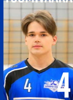
H | s. 2004 | 187 cm