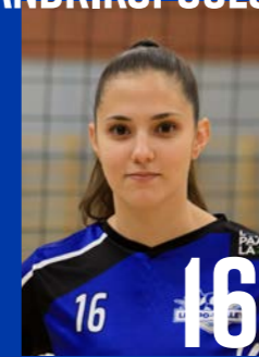
H | s. 1998 | 181 cm