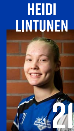
KT | s. 2005