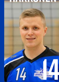
KT | s. 1993 | 190 cm