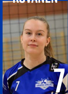
H | s. 1999 | 180 cm