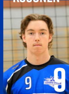
YP | s. 2002 | 191 cm