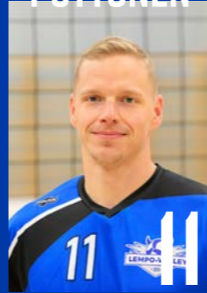
YP | s. 1990 | 190 cm