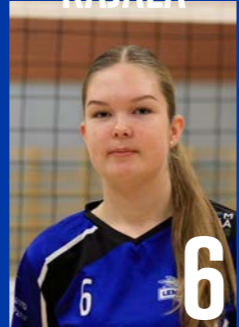
KT | s. 2005 | 184 cm