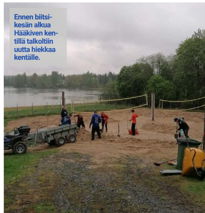
Ennen biitsikesän alkua Hääkiven kentillä talkoitiin uutta hiekkakentälle.

Kesän ykkösturnaus oli Hääkiven kentillä Lempäälässä pelattu Villihanhi beach-turnaus 8. heinäkuuta. Kovatasoisessa turnauksessa oli mukana Lempon tähtipelaajia ja tuttuja pelaajia niin liiga- kuin biitsikentiltä. Sää suosi hienoa turnauspäivää ja uututena turnauspaikalle oli saatu kunnan katsomo. Turnaus on ottanut tapahtumana isoja harppauksia viime vuosina, nyt katsojat saivat nauttia kuulutuksista, kunnan katsomosta ja ravintolatason ruuasta Hääkivellä.