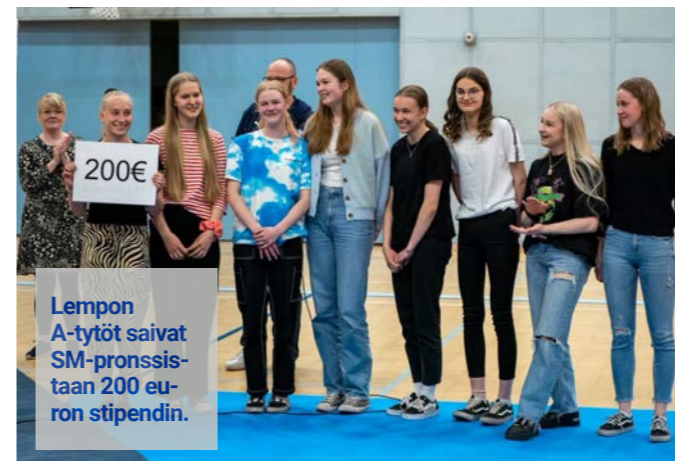
Lempon A-tytöt saivat SM-pronssistaan 200 euron stipendin.