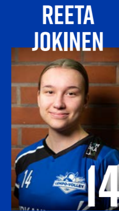
H | s. 2005