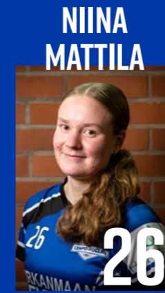
YP | s. 2007