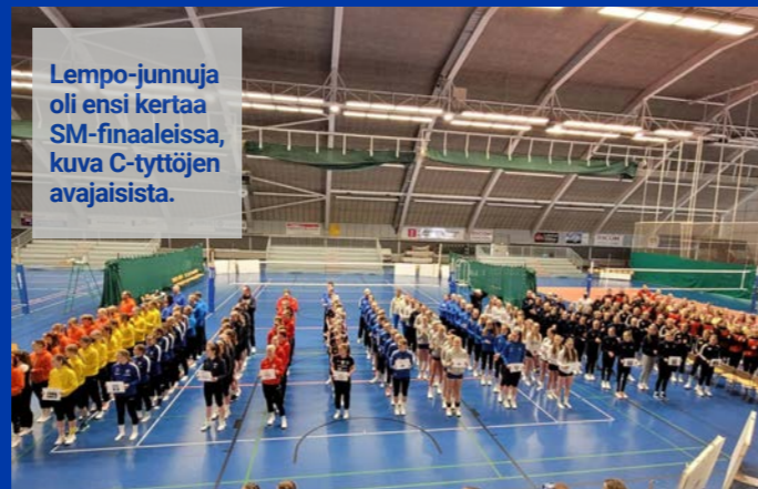
Lempo-junnuja oli ensi kertaa SM-finaaleissa, kuva C-tyttöjen avajaisista.

Kultaissa erässä Kyyjärven Kyky voitti mestaruuden ja Lempo jäi hopealle. 550 katsojaa todisti Hakkarisa yhtä koko Lempäälään urheiluhistorian upeimmista tapahtumista. Miesten 2-sarjajoukkue pelasi itsensä aina puolivälieriin asti.