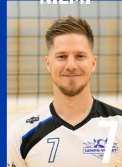
L | s. 1992 | 182 cm