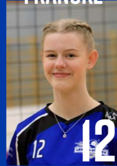
H | s. 2005 | 173 cm