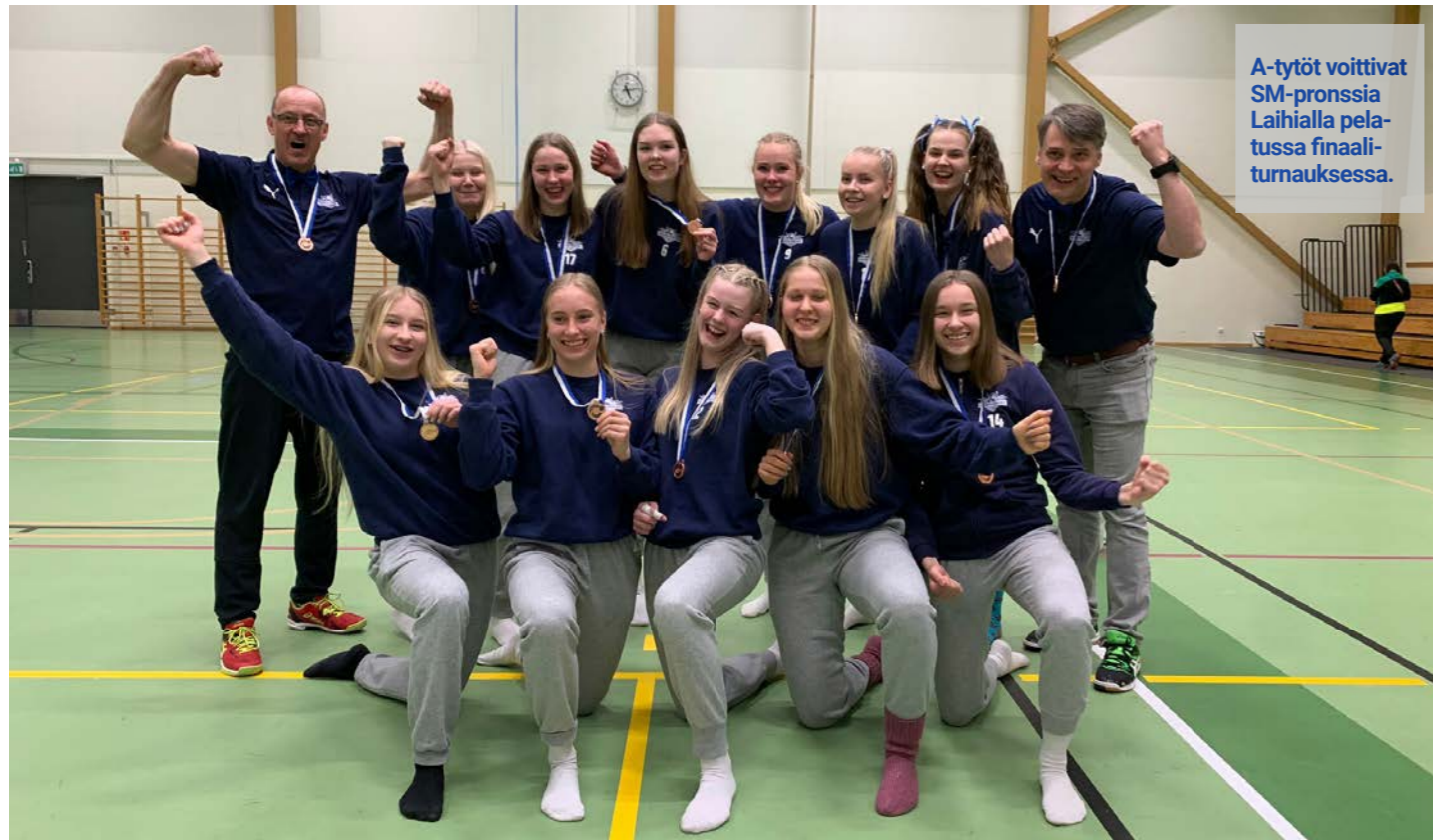
A-tytöt voittivat SM-pronssia Laihialla pelatussa finaali-turnauksessa.