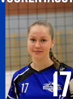
P | s. 2002 | 173 cm