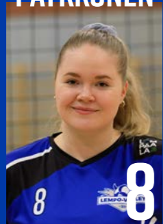
YP | s. 2002 | 176 cm