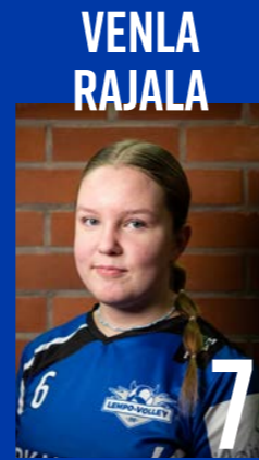
KT | s. 2008