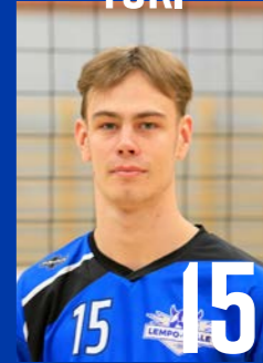
P | s. 2001 | 190 cm