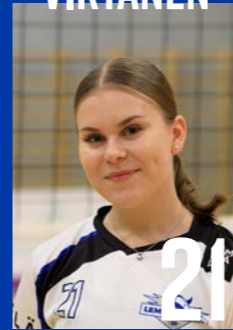
L | s. 2002 | 165 cm