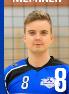
YP | s. 2001 | 194 cm