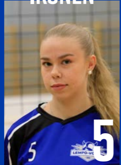
H | s. 2003 | 172 cm