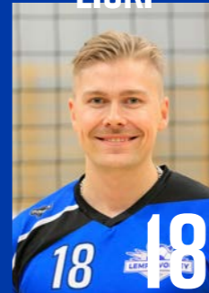
H | s. 1993 | 186 cm