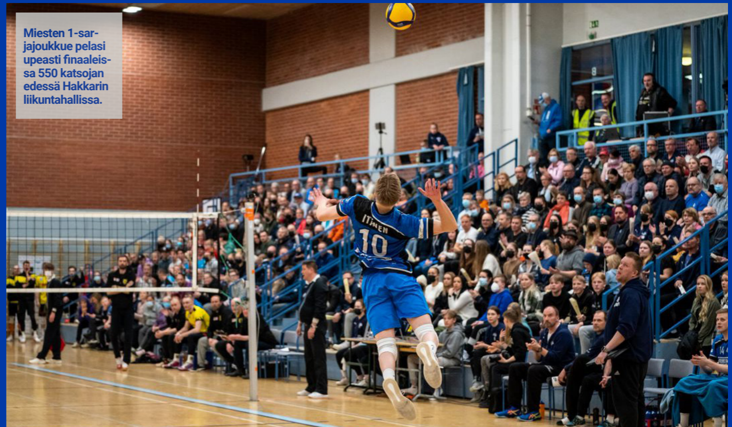
Miesten 1-sarjajoukkue pelasi upeasti finaaleissa 550 katsojan edessä Hakkarin liikuntahallissa.