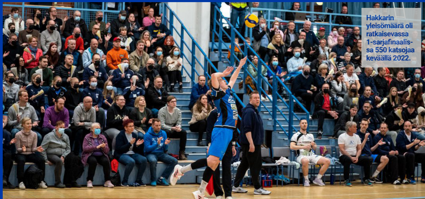
Hakkarin yleisömäärä oli ratkaisevassa 1-sarjafinaalissa 550 katsojaa keväällä 2022.