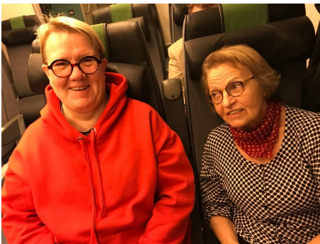
Junalla matka taittui mukavasti.

Tampereen Tenniskeskus oli reippaan urheiluhengen täyttämä, kun Parkinsonväki läheltä ja kaukaa kokoontui 17.5.2023 Parkiadeihin. Tunnelma veti vertoja MM-jääkiekon kisakatsomon menolle ja meiningille. Ilmassa oli pallon läiskettä, huutoja ja jalkojen töminää. Joku iloitsi menestyksestään, toinen epäonistumistaan, joku ei ollut tyytyväinen järjestelyihin.