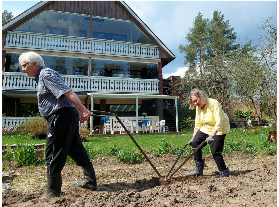
Perunan istutusvako aukeaa helposti ”akanvedettävällä” auralla.

Toisaalta taas ruokailu yhdessä toisten omaishoitajien kanssa avasi paljon keskustelua omaishoitajien arjesta. Kuinka paljon rakkautta omaishoitajalta vaaditaan. Ja vaikka rakkaus riittäisi, riittävätkö voimat. Miten sairaus on muuttanut myös hoidettavaa puolisoa. Monille voimaa antaa keskinäinen kiintymys ja toisen arvostus. Ehkä myös pitkä yhteinen taival on sitonut yhteen. Näin arjen tuomat haasteet kestetään. Myös tämän kurssin tarkoitus on auttaa ymmärtämään nykyisiä ja tuleviakin haasteita.